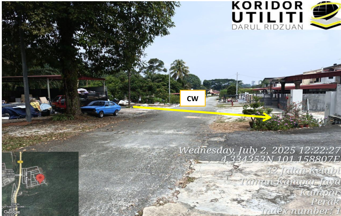
CADANGAN LALUAN BAGI KERJA KOREKAN TERBUKA (CW)