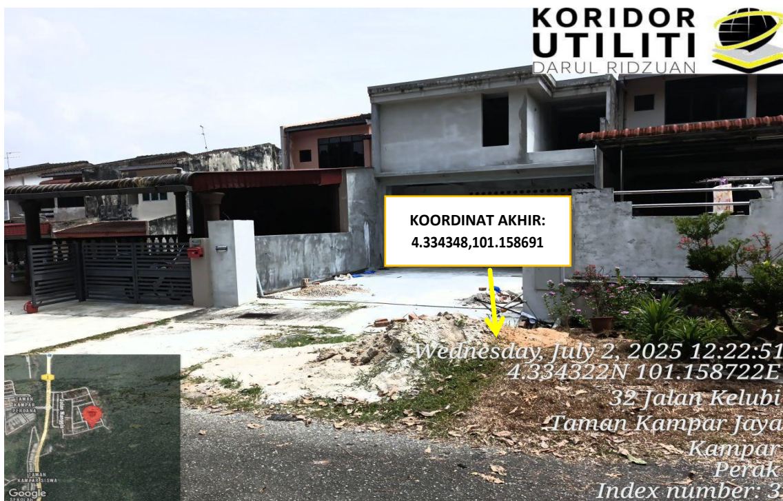
JALAN KELUBI (KOORDINAT AKHIR)