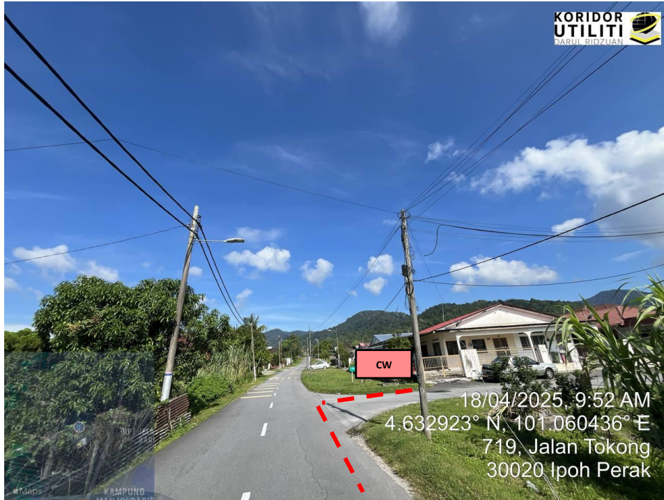
JAJARAN KOREKAN TERBUKA DI JALAN TOKONG