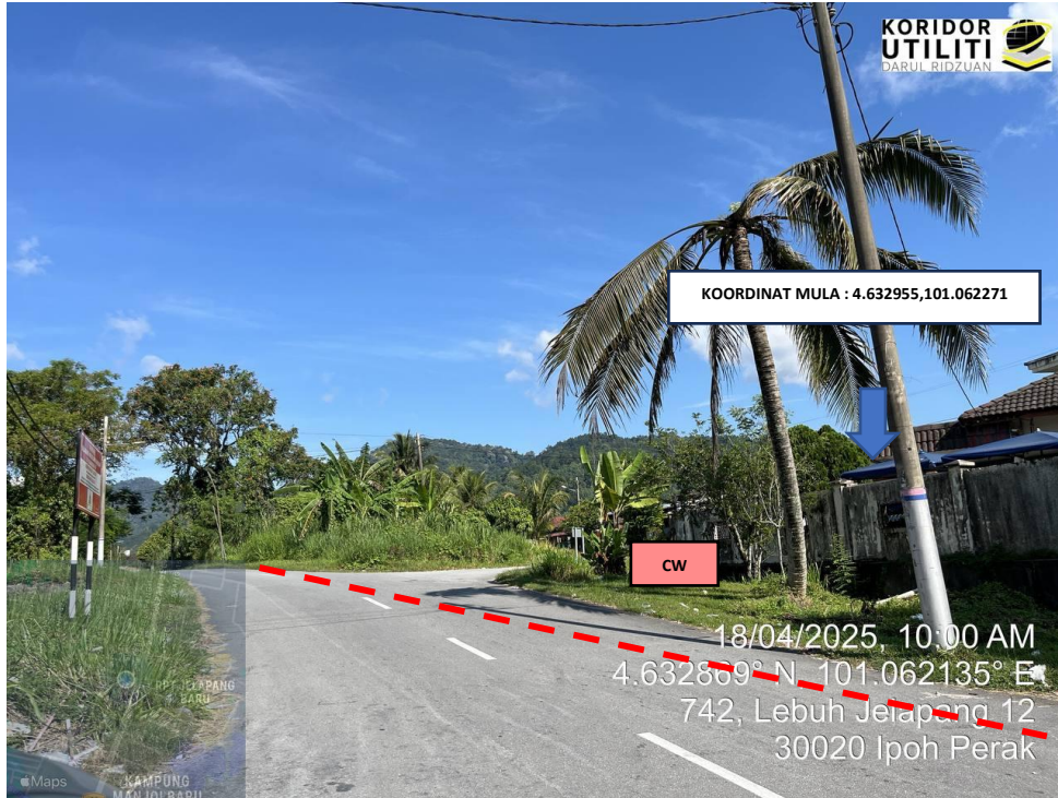
LOKASI KOORDINAT MULA KOREKAN TERBUKA DI JALAN TOKONG