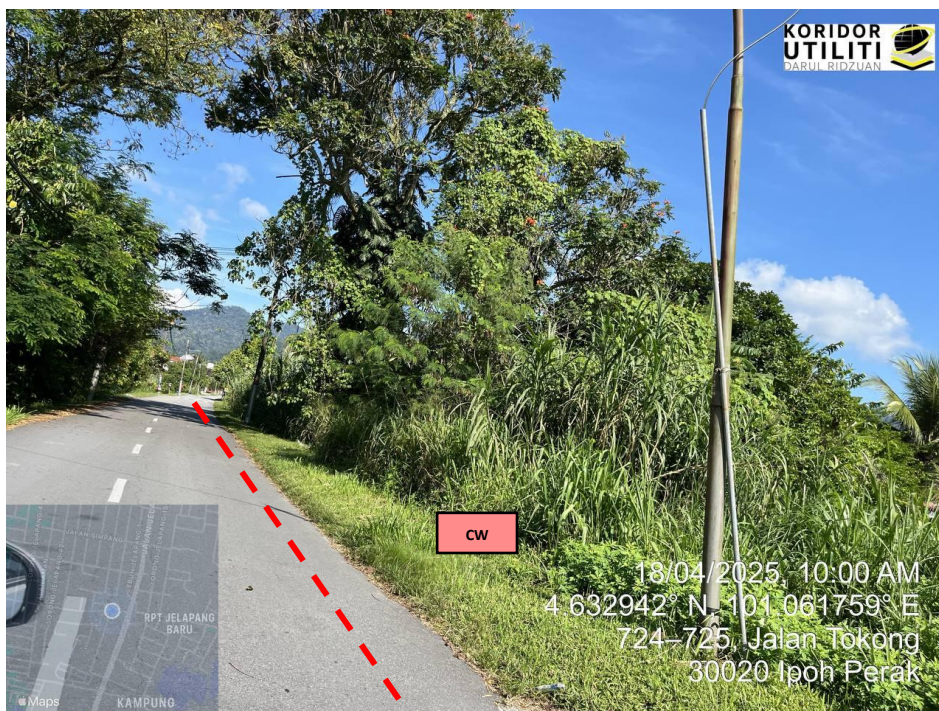
JAJARAN KOREKAN TERBUKA DI JALAN TOKONG