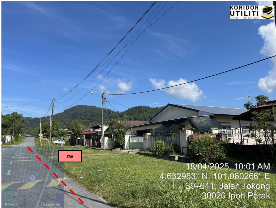
JAJARAN KOREKAN TERBUKA DI JALAN TOKONG