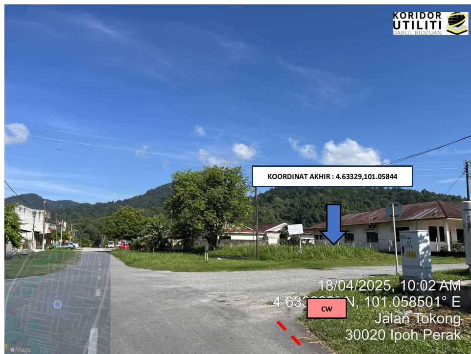
LOKASI KOORDINAT AKHIR KOREKAN TERBUKA DI JALAN TOKONG