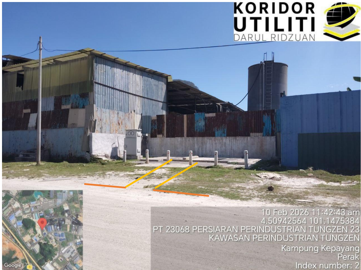
KOREKAN TERBUKA CW – 10 METER DAN GV – 6 METER