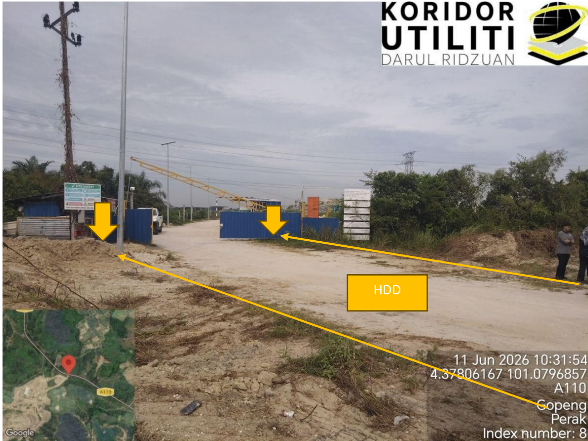
KOORDINAT AKHIR HINGGA KE DEPAN TAPAK PROJEK