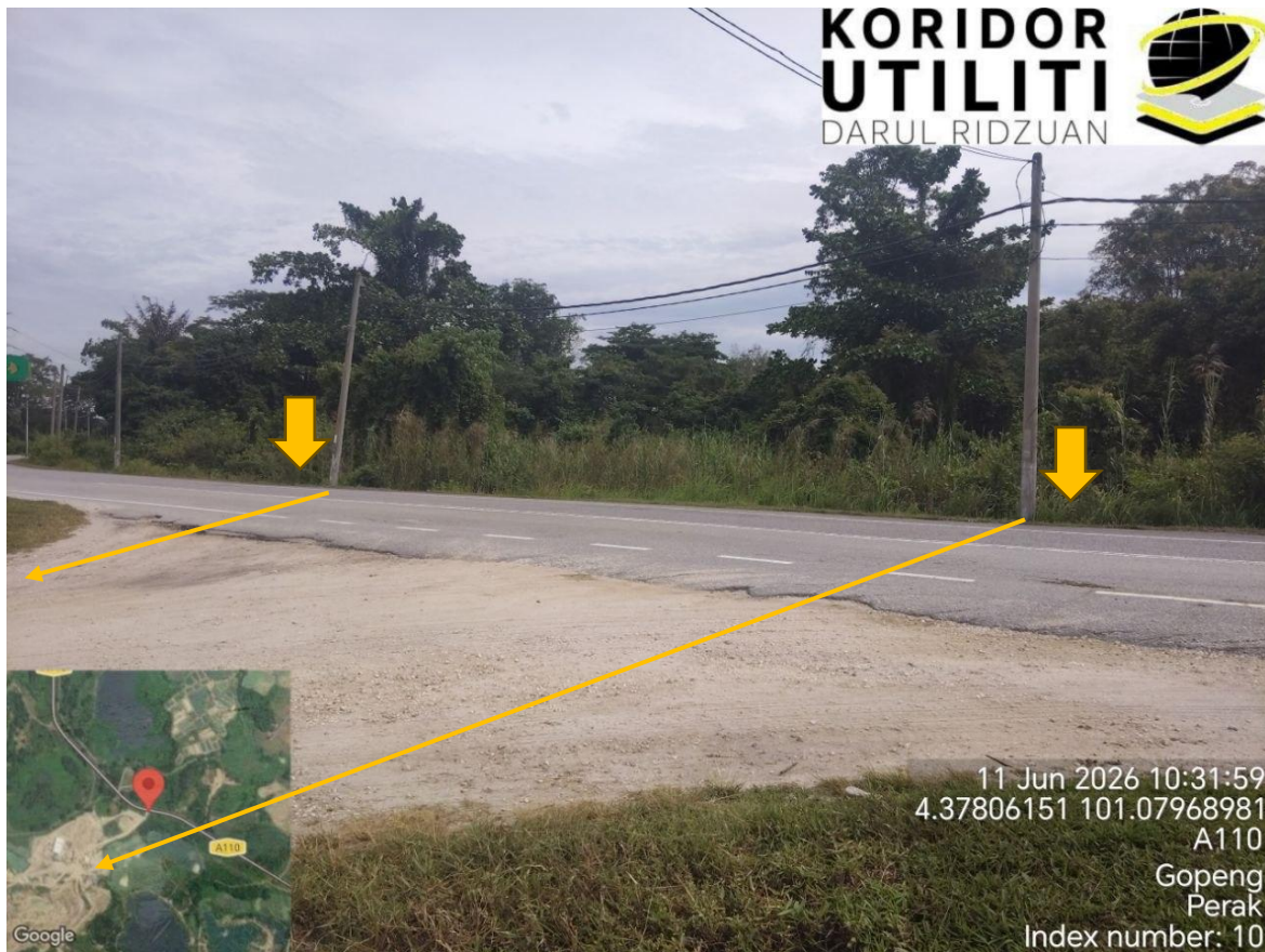
KOORDINAT MULA UNTUK KERJA HDD – JALAN KOTA BAHARU