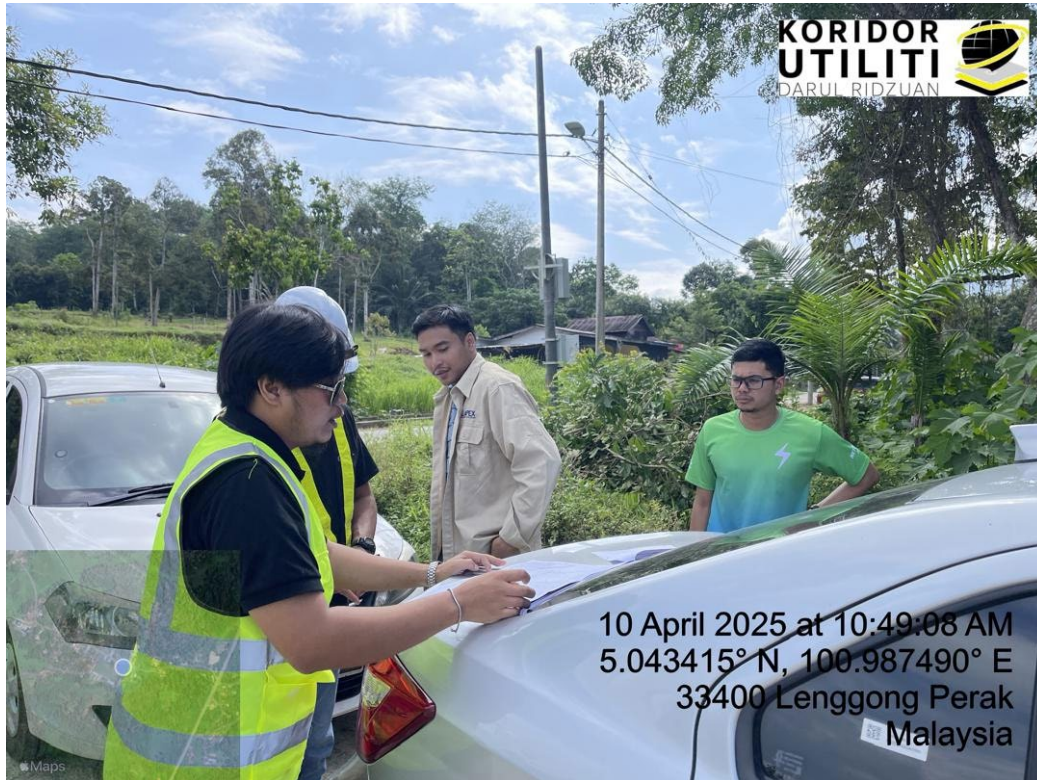
LOKASI DI SEKOLAH MENENGAH KEBANGSAAN TAN SRI AZIZ