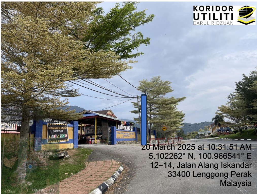
LOKASI DI JALAN BESAR