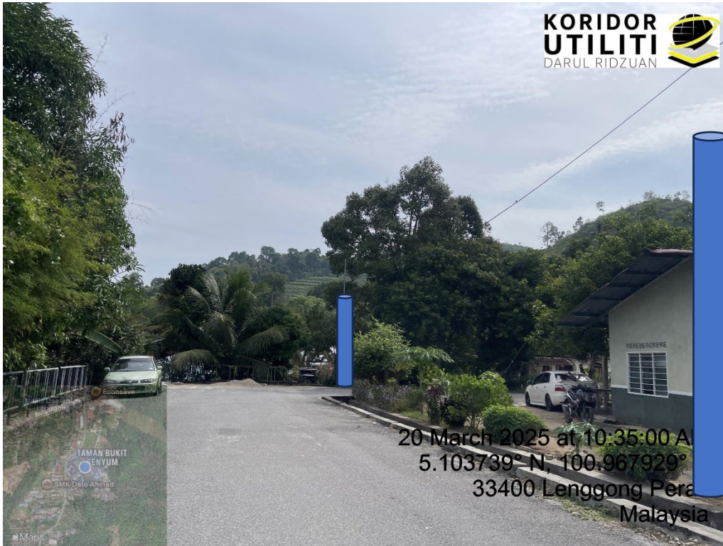
LOKASI DI JALAN BUKIT SENYUM