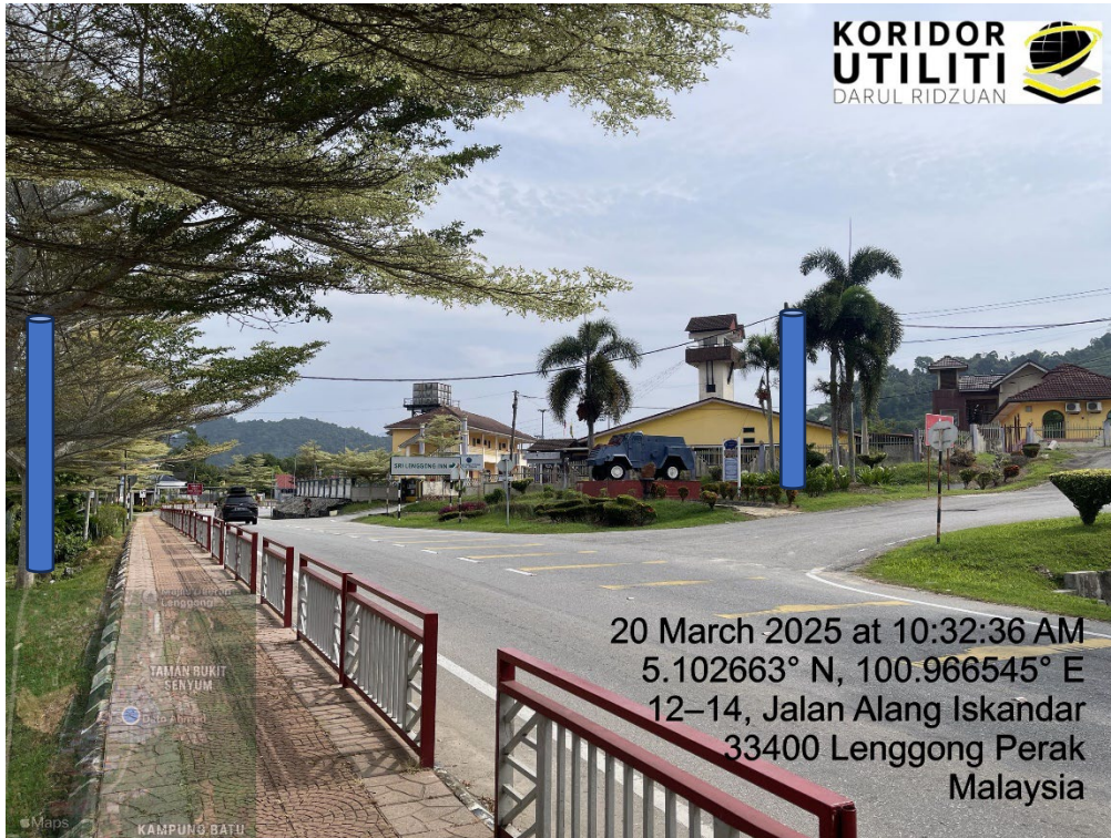
LOKASI DI JALAN BESAR