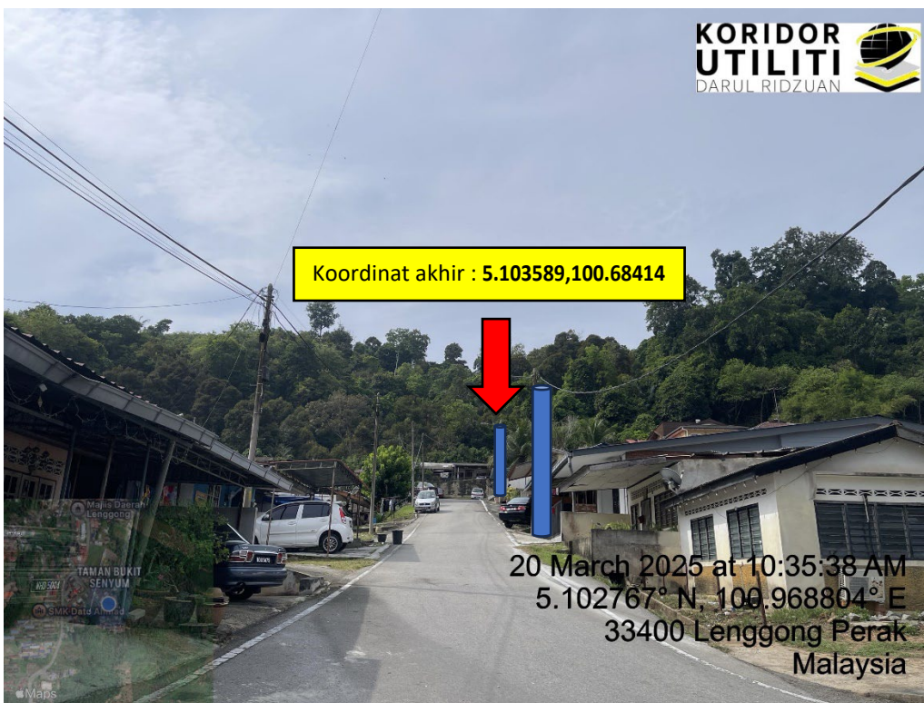
LOKASI DI JALAN BUKIT SENYUM