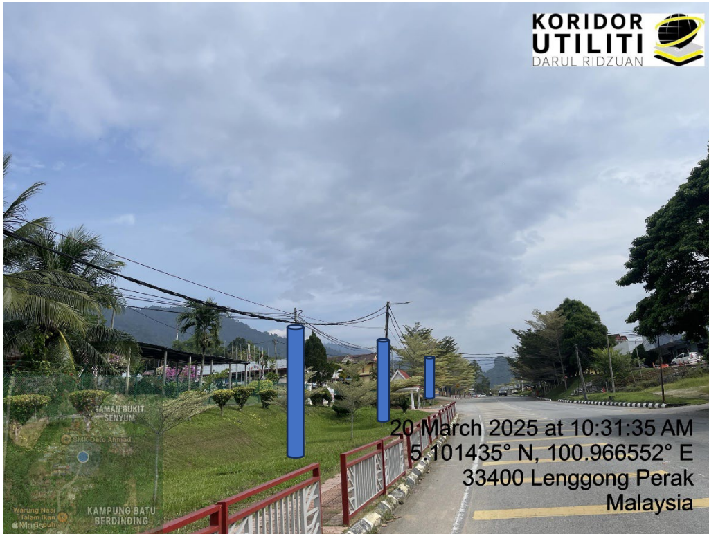
LOKASI DI JALAN BESAR