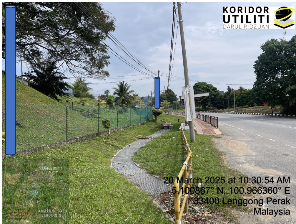
LOKASI DI JALAN BESAR