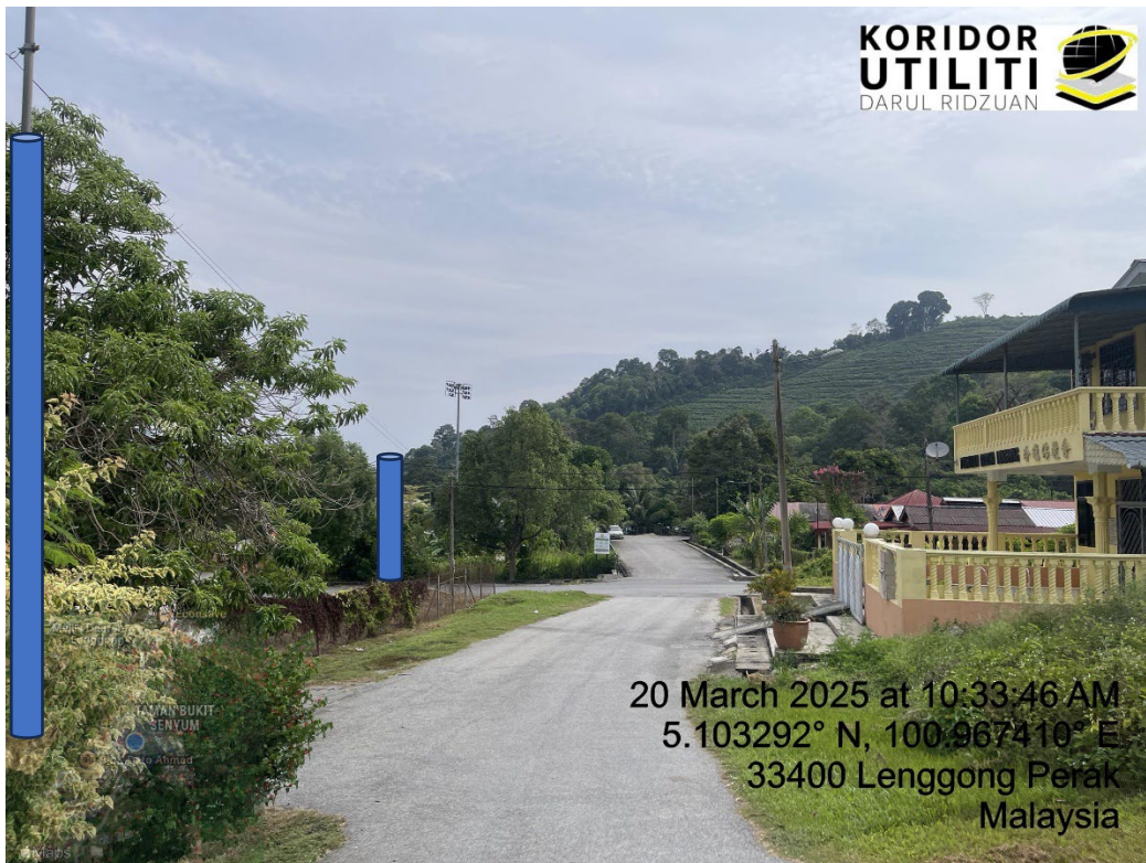
LOKASI DI JALAN BUKIT SENYUM