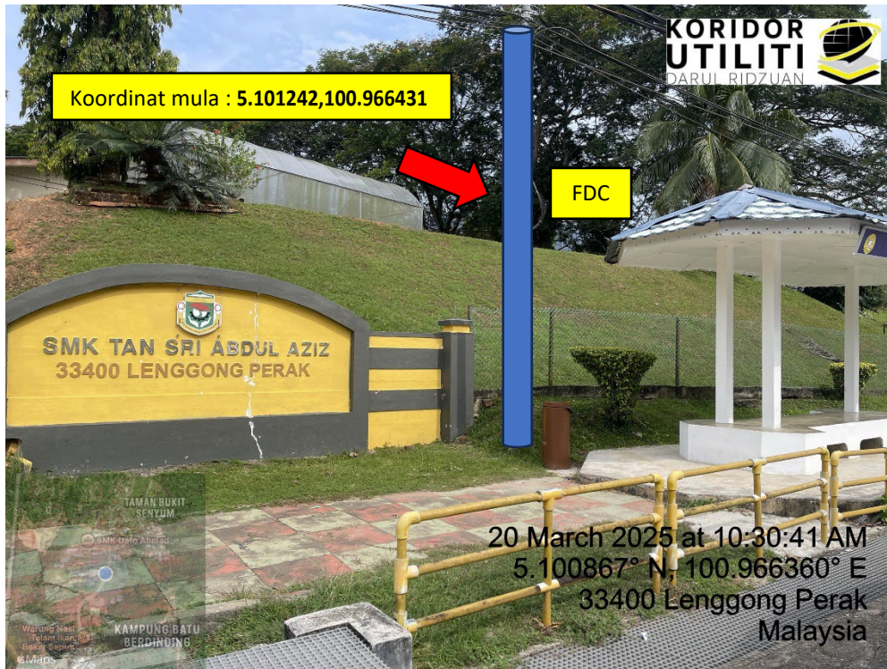
LOKASI DI JALAN SEKOLAH MENENGAH KEBANGSAAN TAN SRI ABDUL AZIZ