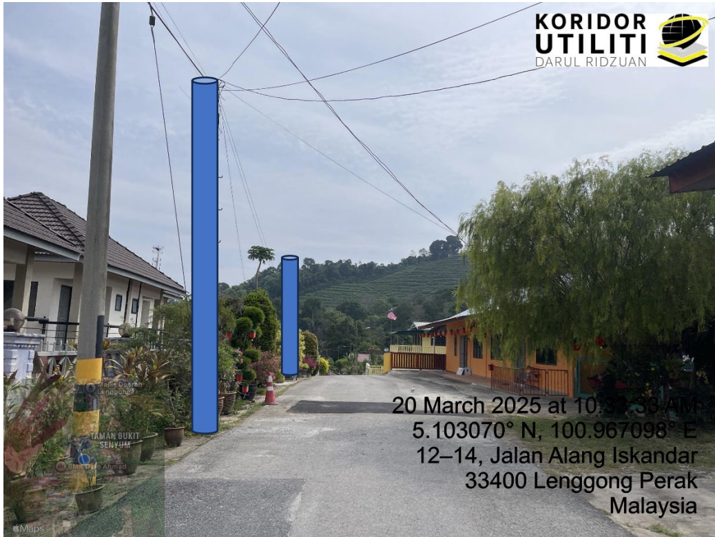
LOKASI DI JALAN BUKIT SENYUM