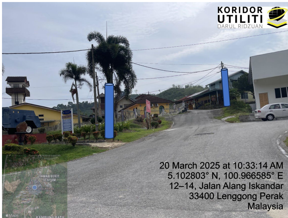
LOKASI DI JALAN SRI LENGGONG INN