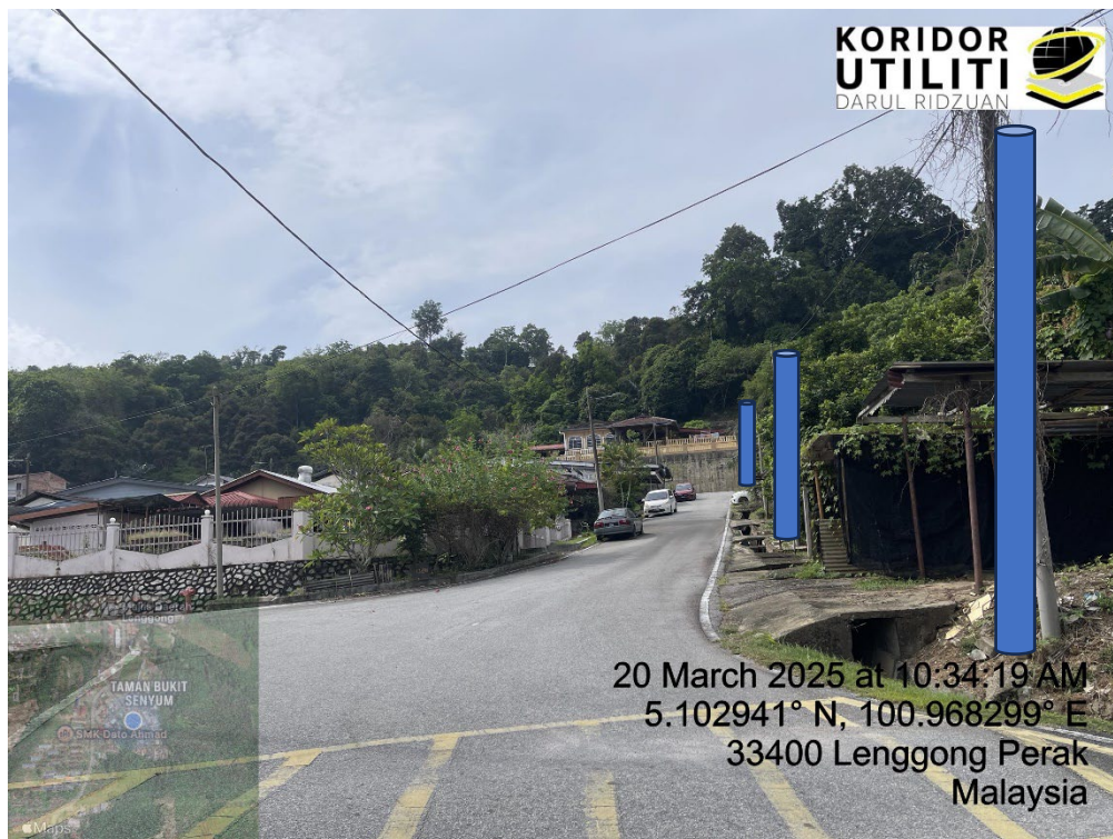
LOKASI DI JALAN BUKIT SENYUM