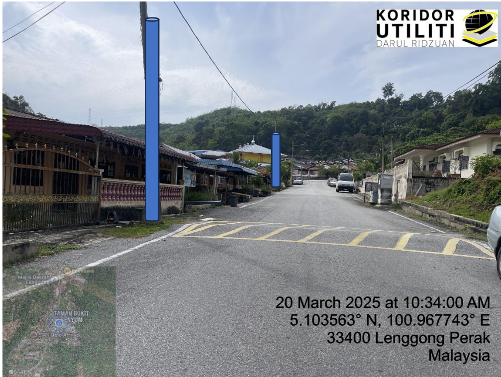
LOKASI DI JALAN BUKIT SENYUM