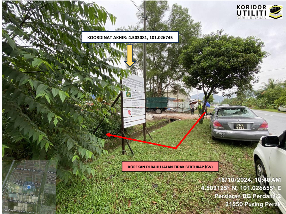
Lokasi koordinat akhir di Persiaran BG Perdana 2