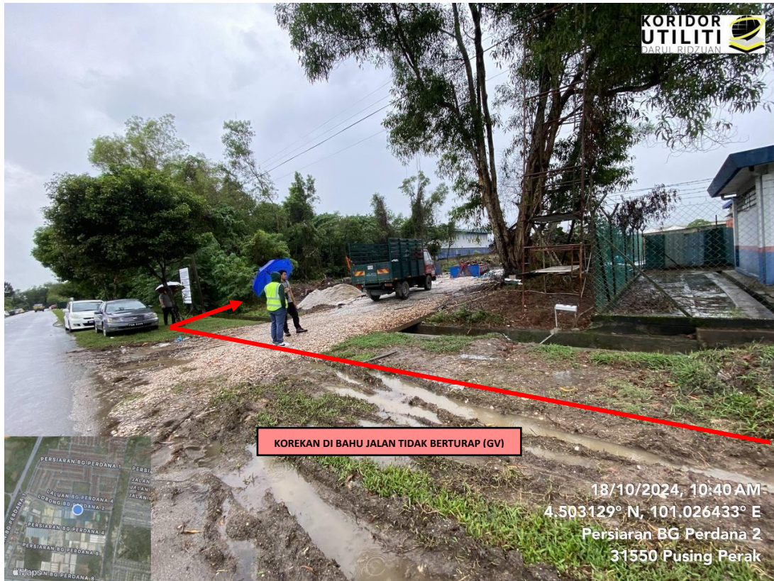
Jajaran korekan terbuka di bahu jalan tidak berturap (GV) di Persiaran BG Gajah Perdana