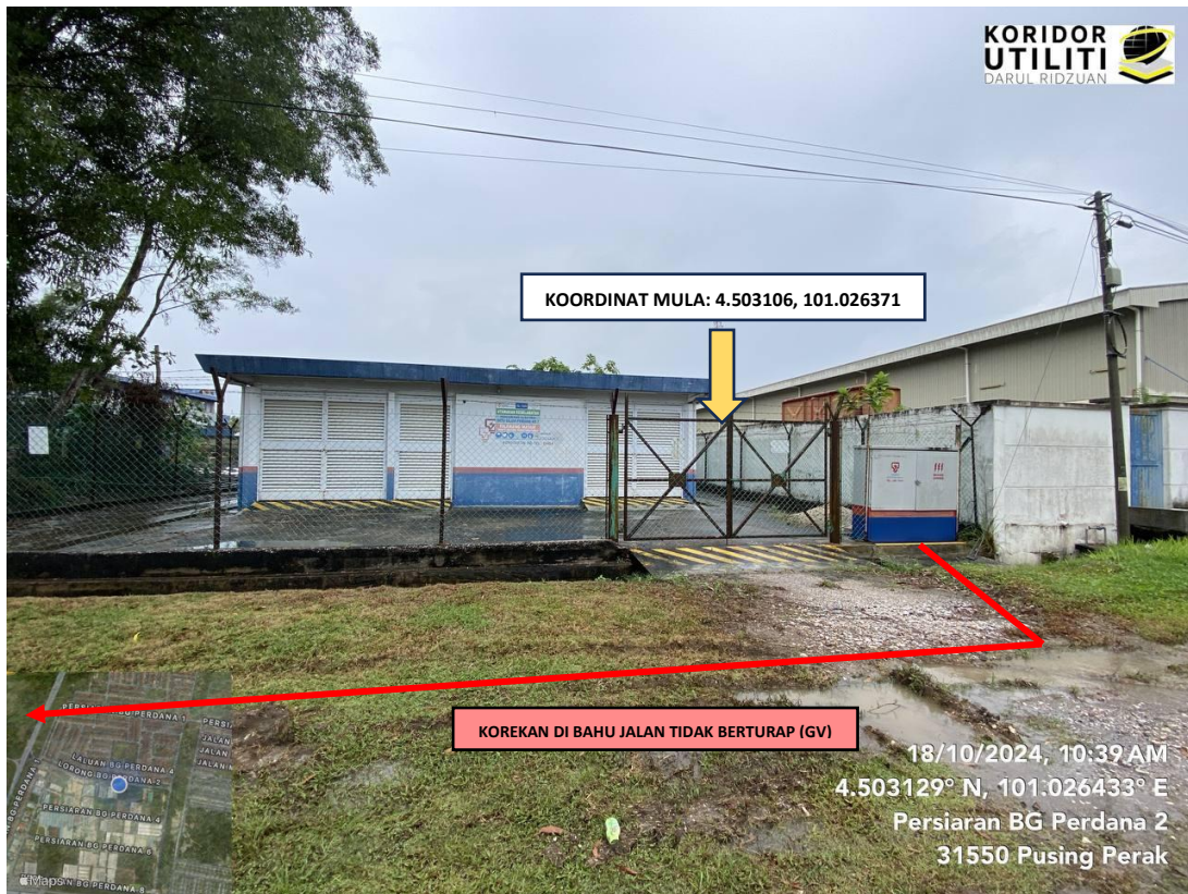
Lokasi koordinat mula di Persiaran BG Perdana 2 berdekatan PE Taman Batu Gajah Perdana No. 7