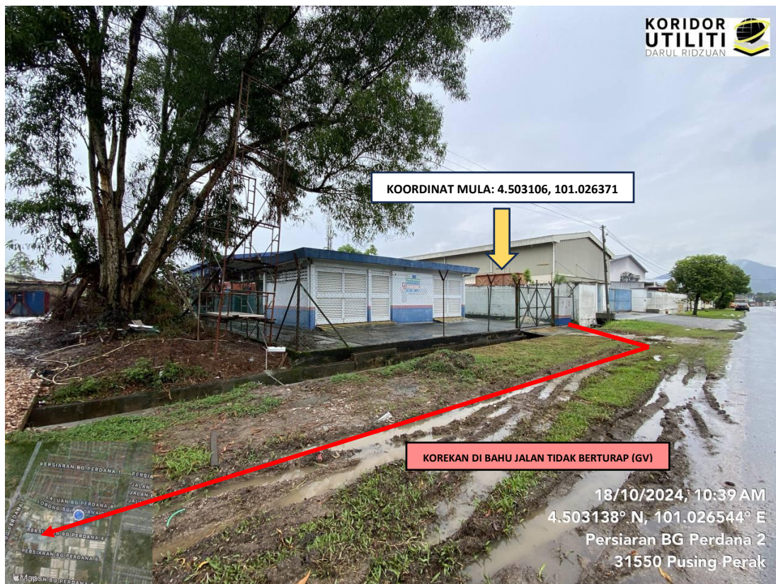
Jajaran korekan terbuka di bahu jalan tidak berturap (GV) di Persiaran BG Gajah Perdana