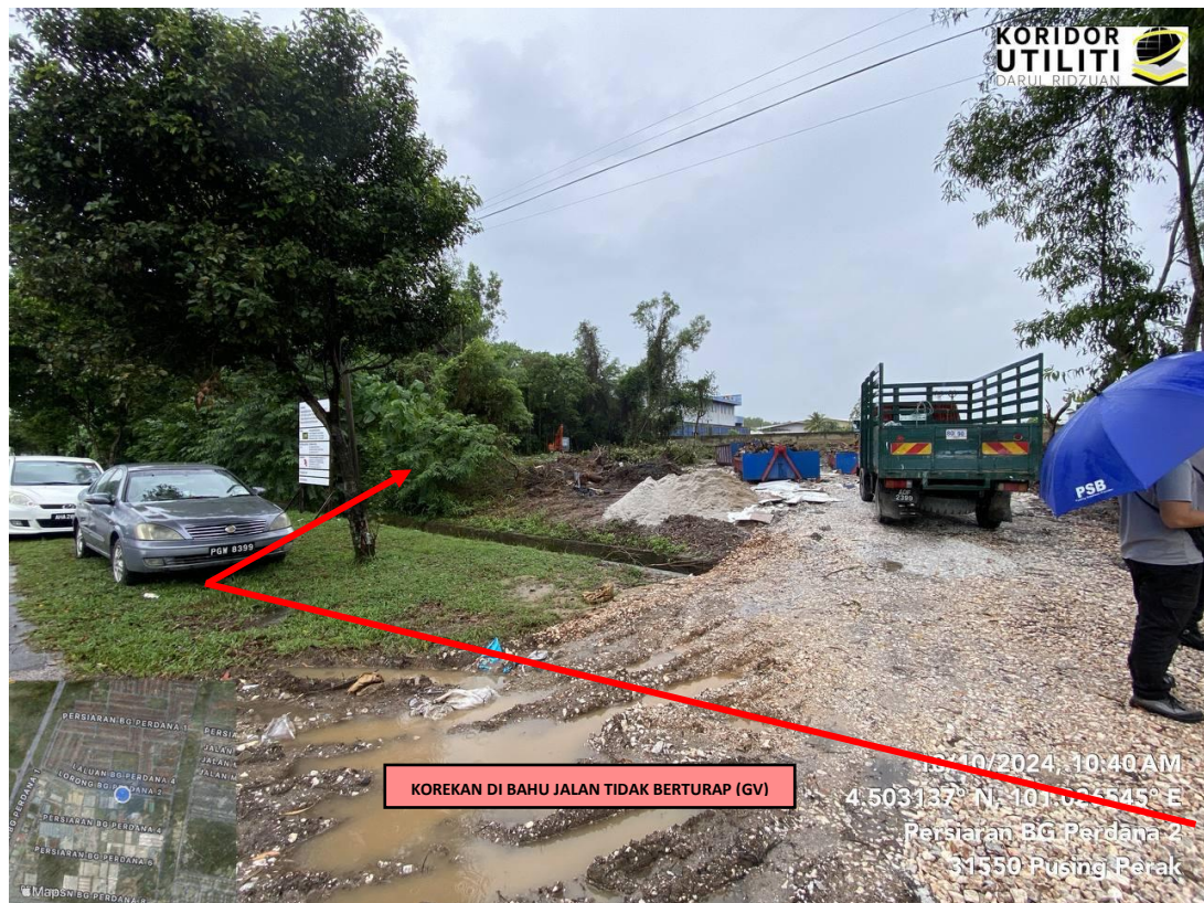
Jajaran korekan terbuka di bahu jalan tidak berturap (GV) di Persiaran BG Gajah Perdana