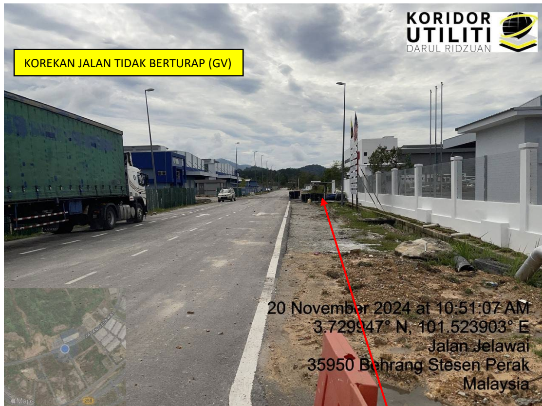
LOKASI DI JALAN JELAWAI 4