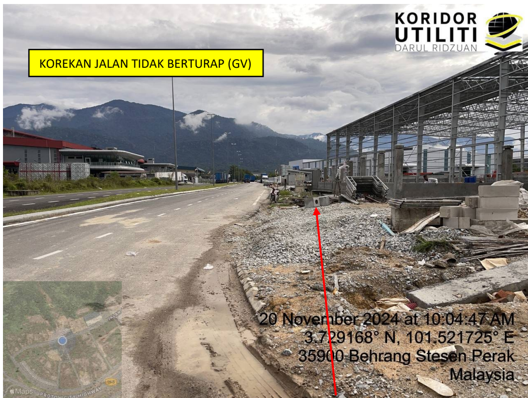
LOKASI DI JALAN JELAWAI 2