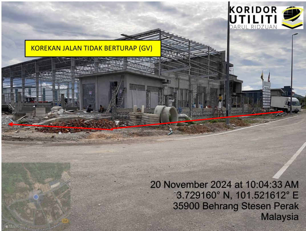
LOKASI DI JALAN JELAWAI 2