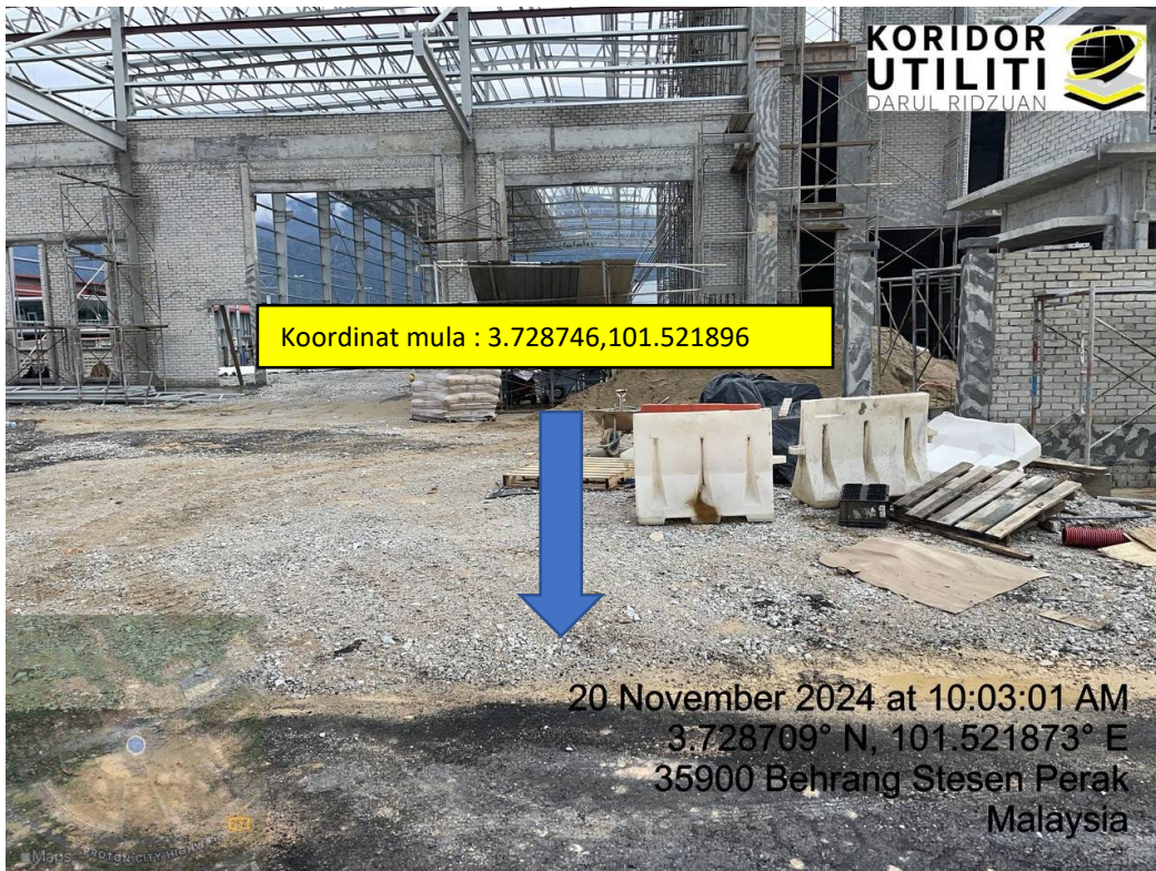
LOKASI DI JALAN JELAWAI 5