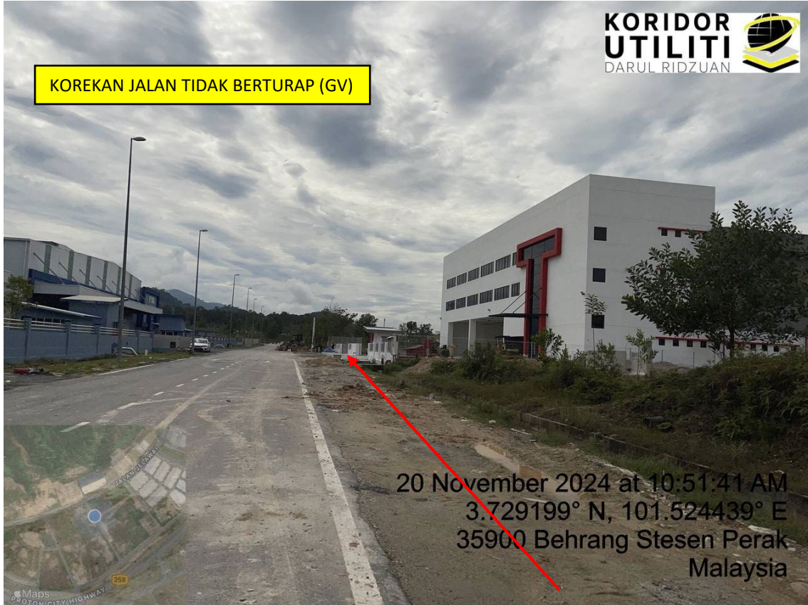
LOKASI DI JALAN JELAWAI 4