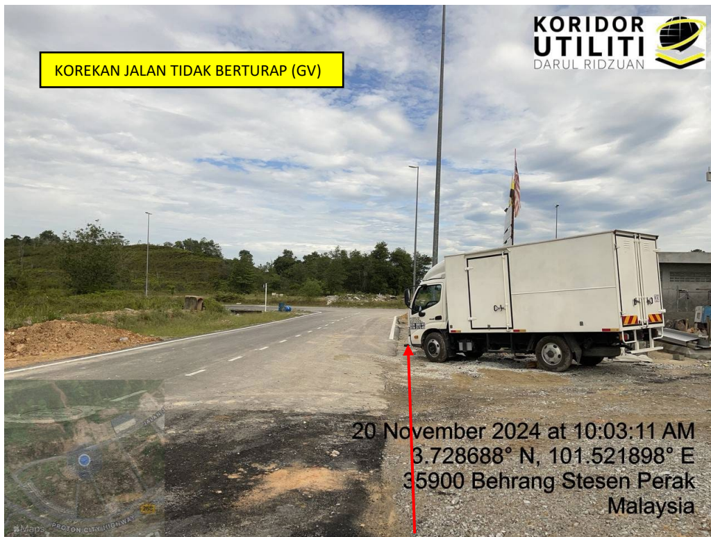
LOKASI DI JALAN JELAWAI 5