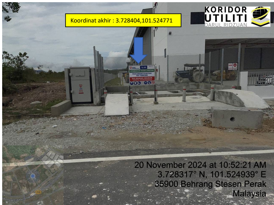
LOKASI DI JALAN JELAWAI 4