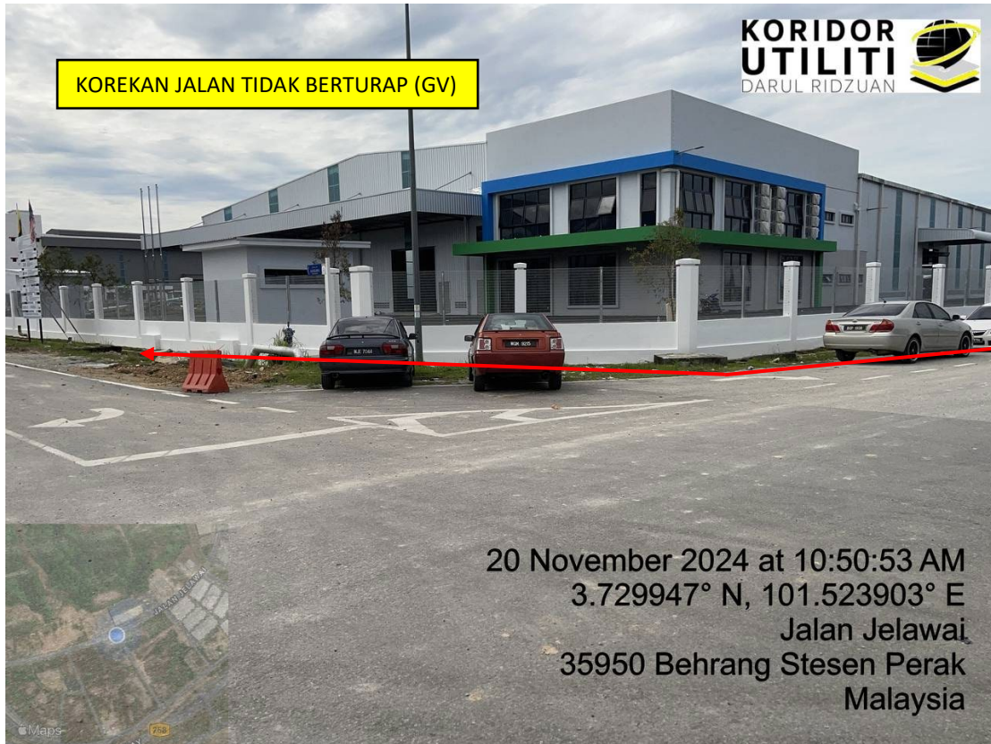
LOKASI DI JALAN JELAWAI 2