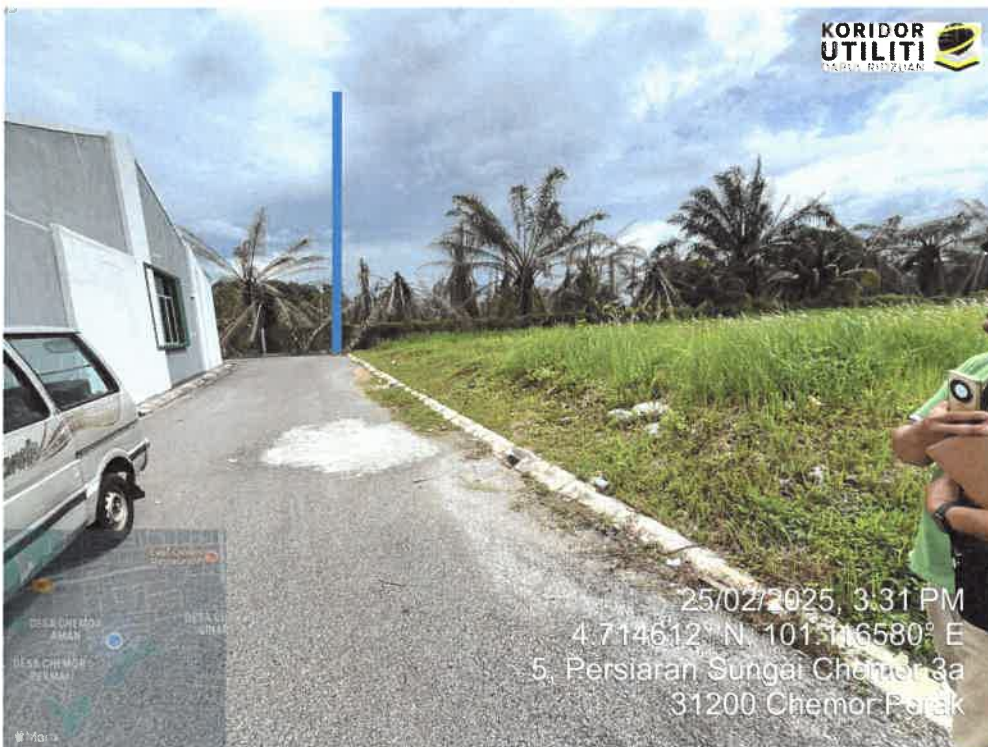
LOKASI PENANAMAN TIANG DI LALUAN BERHAMPIRAN PERSIARAN SUNGAI CHEMOR 3A