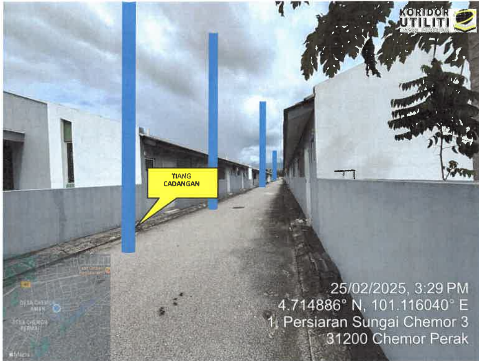
LOKASI PENANAMAN TIANG DI LALUAN ANTARA PERSIARAN SUNGAI CHEMOR 3 & PERSIARAN SUNGAI CHEMOR 3