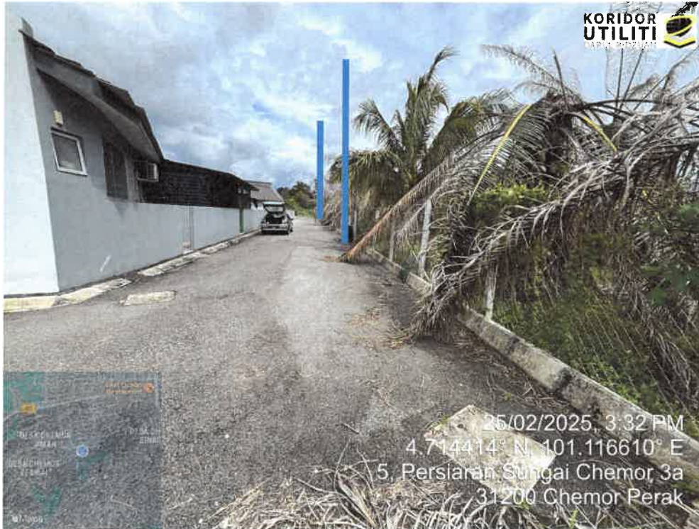
LOKASI PENANAMAN TIANG DI LALUAN PERSIARAN SUNGAI CHEMOR