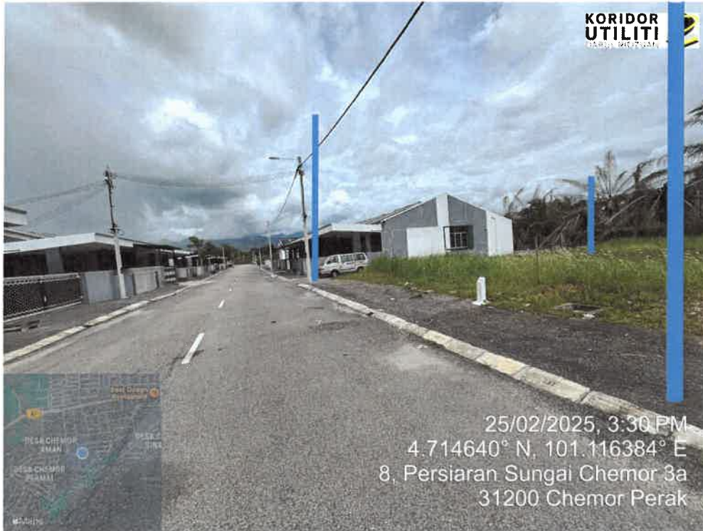
LOKASI PENANAMAN TIANG DI LALUAN PERSIARAN SUNGAI CHEMOR 3A