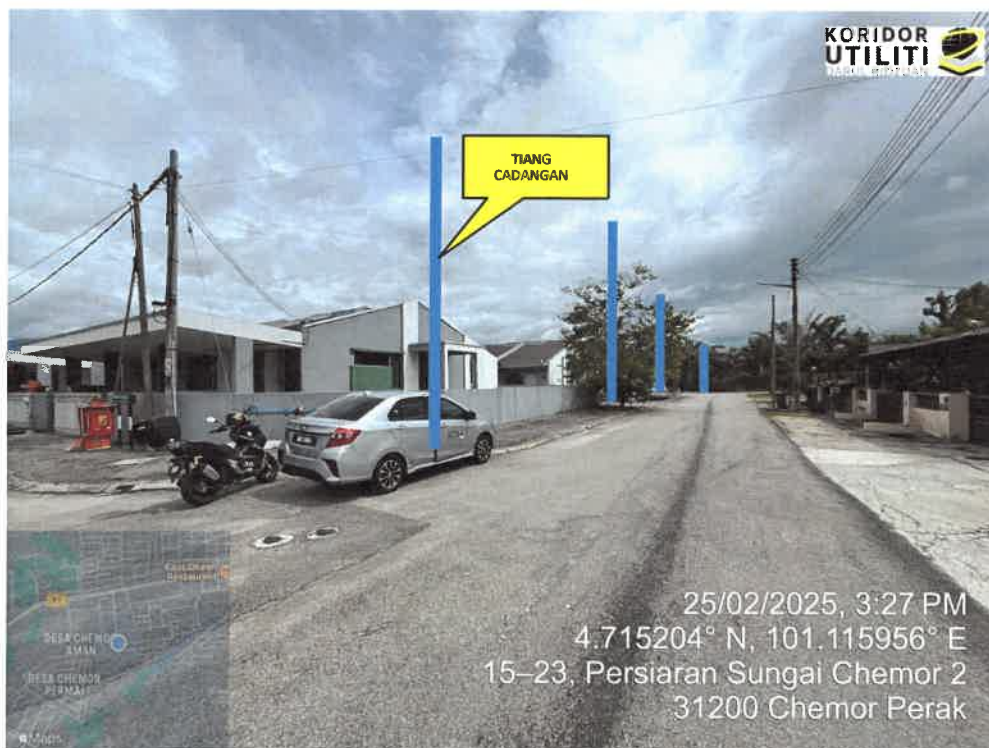
LOKASI PENANAMAN TIANG DI LALUAN PERSIARAN SUNGAI CHEMOR 2