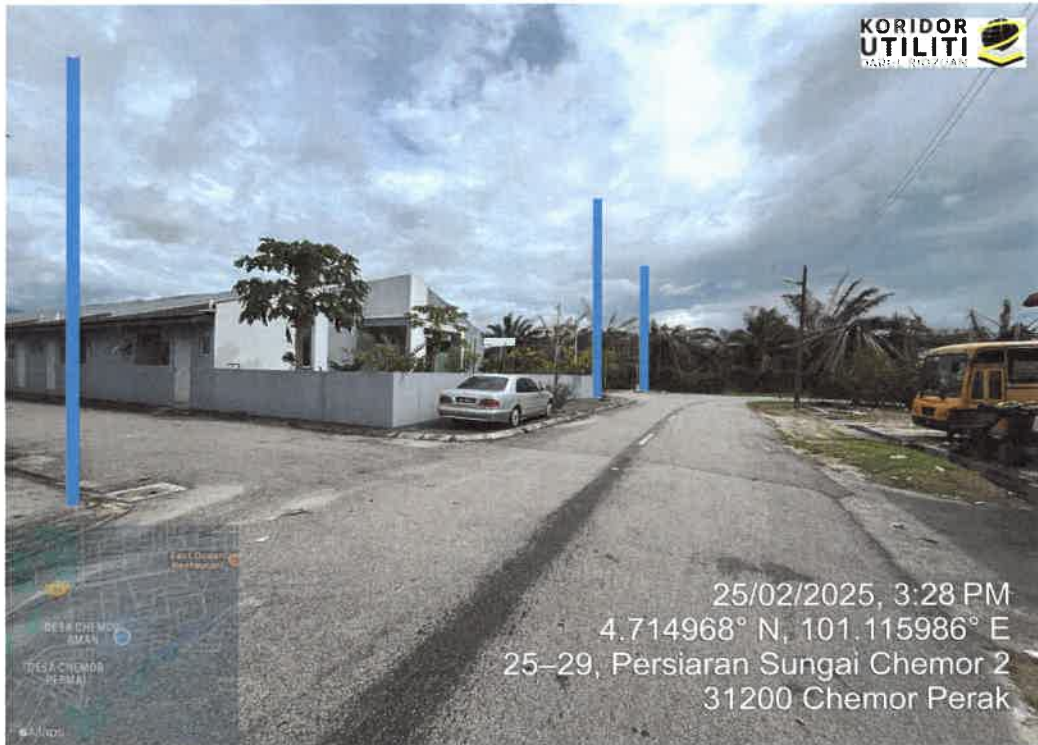
LOKASI PENANAMAN TIANG DI LALUAN PERSIARAN SUNGAI CHEMOR 2