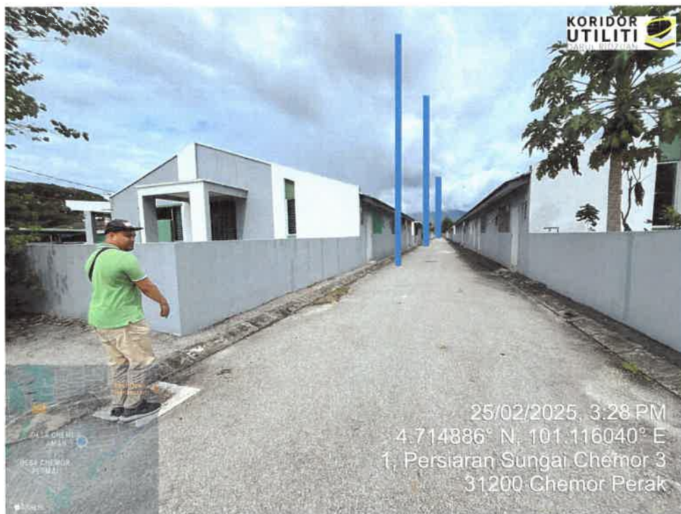
LOKASI PENANAMAN TIANG DI LALUAN ANTARA PERSIARAN SUNGAI CHEMOR 3 & PERSIARAN SUNGAI CHEMOR 3