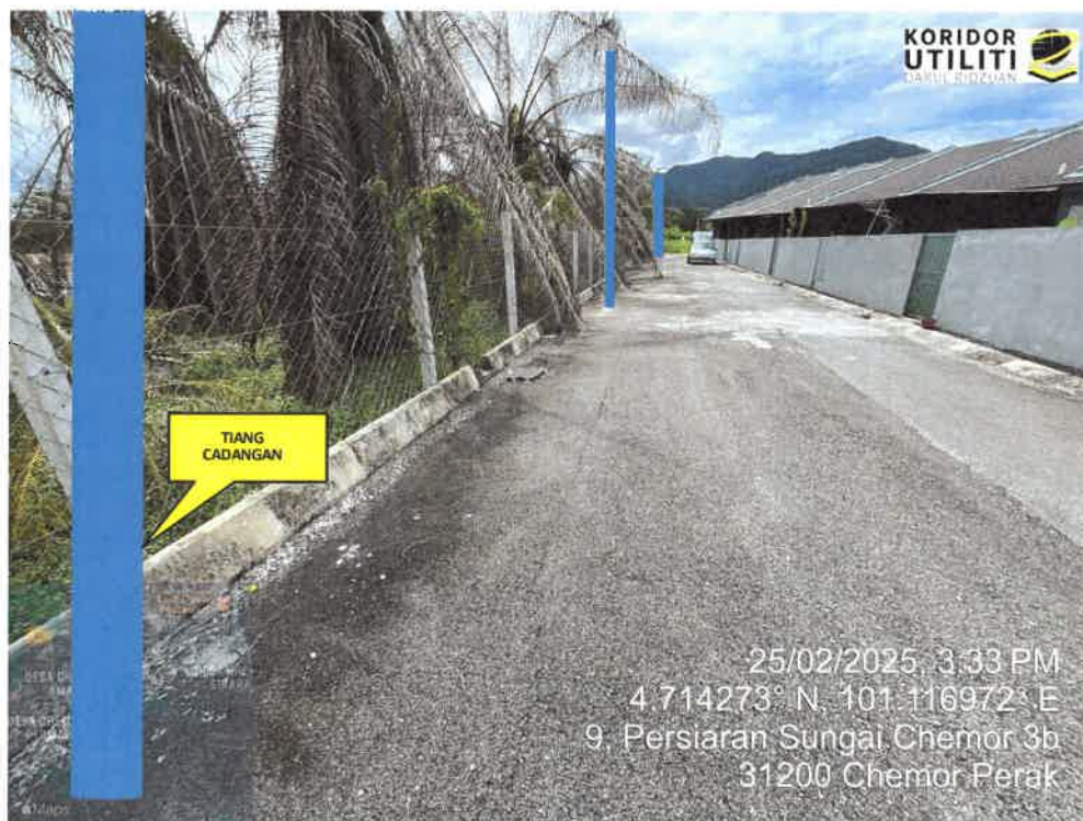
LOKASI PENANAMAN TIANG DI PERSIARAN SUNGAI CHEMOR 3