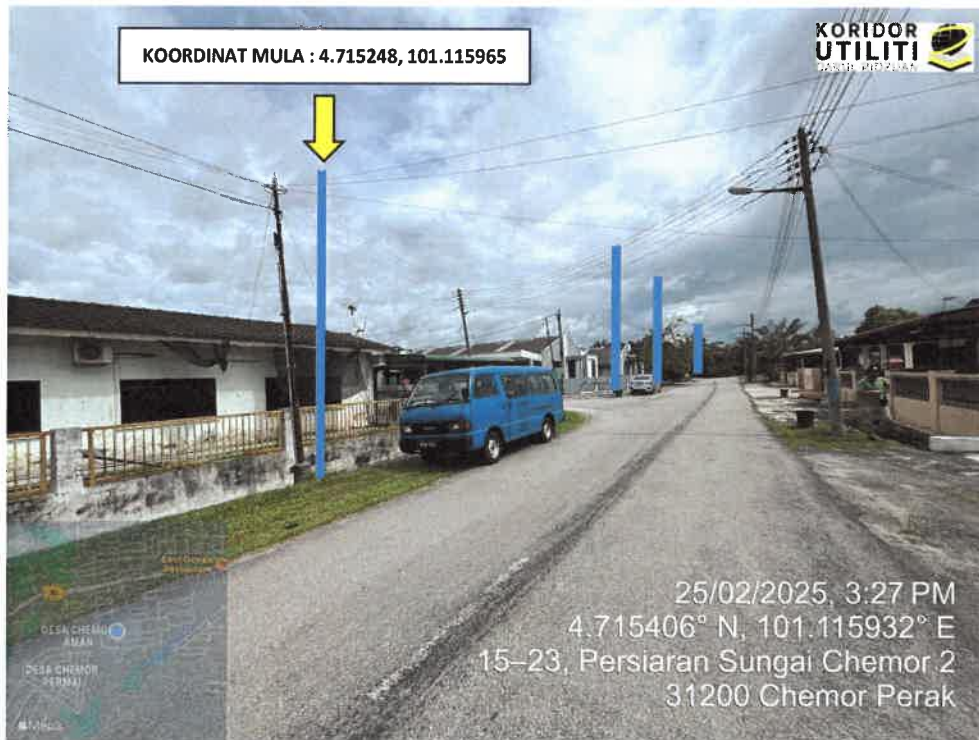
LOKASI KOORDINAT MULA DI LALUAN PERSIARAN SUNGAI CHEMOR 2