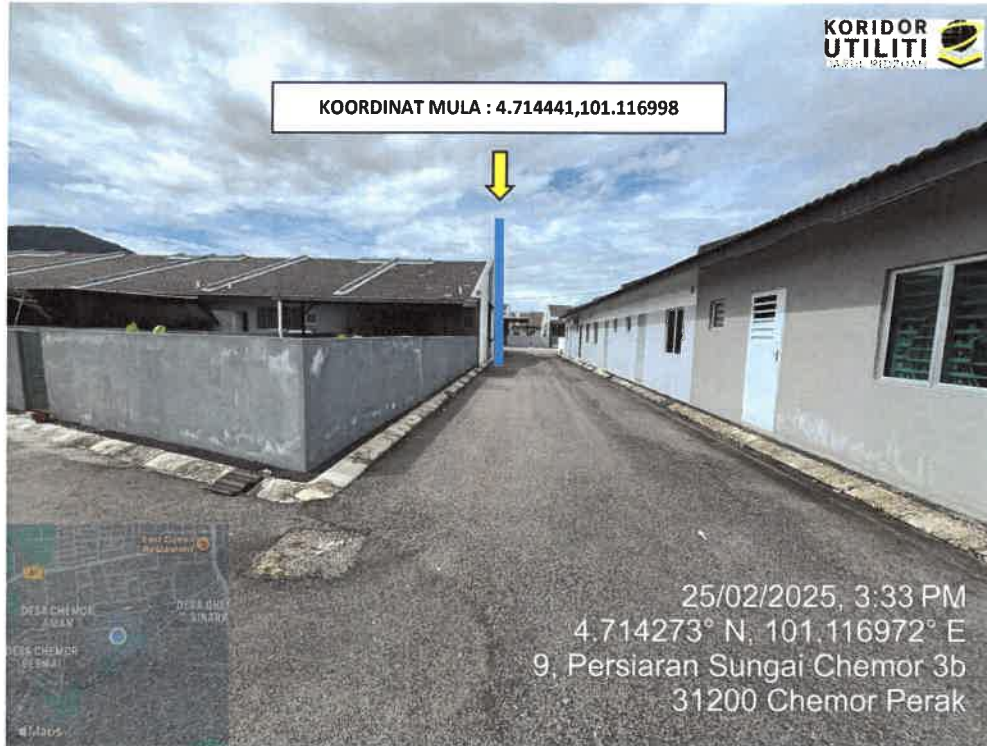
KOORDINAT AKHIR LOKASI PENANAMAN TIANG DI PERSIARAN SUNGAI CHEMOR