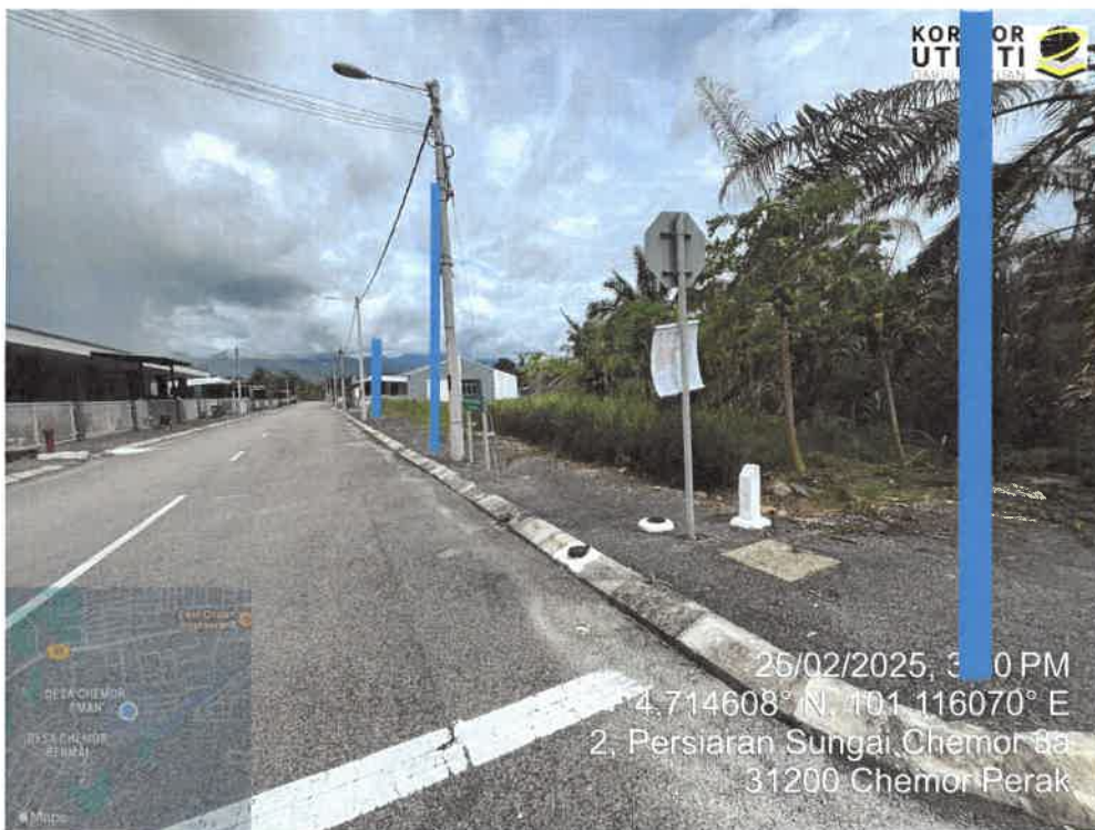
LOKASI PENANAMAN TIANG DI LALUAN PERSIARAN SUNGAI CHEMOR 3