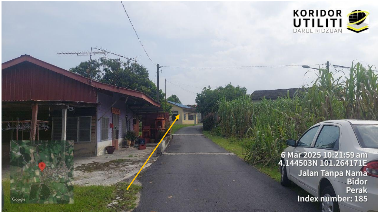
LOKASI DI KAMPUNG BAHARU TANAH MAS