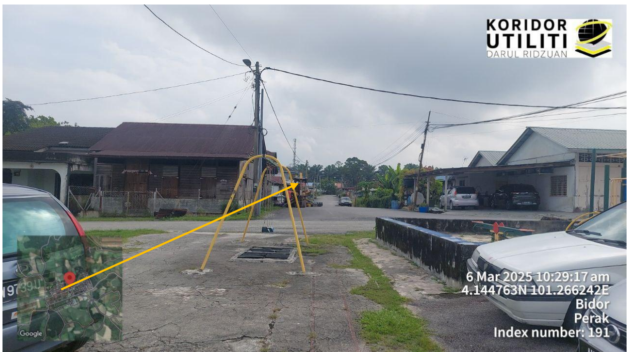
CROSSING MENGIKUT TIANG TNB SEDIA ADA