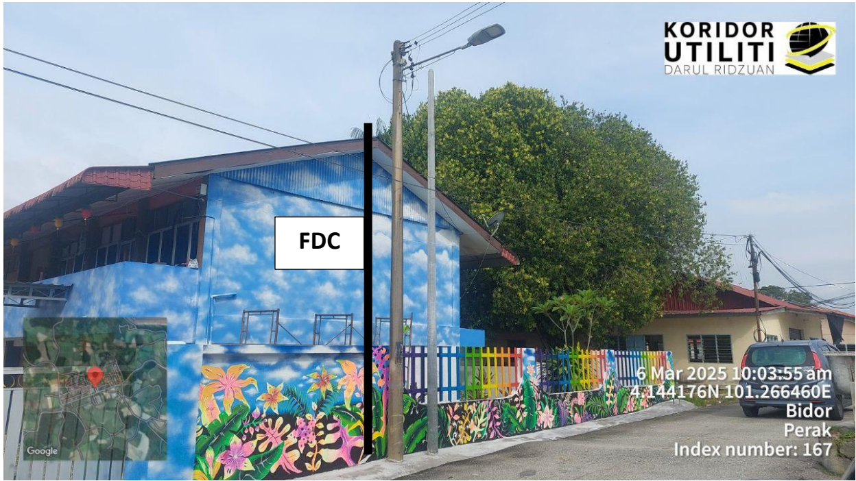
LOKASI DI SJKC TANAH MAS