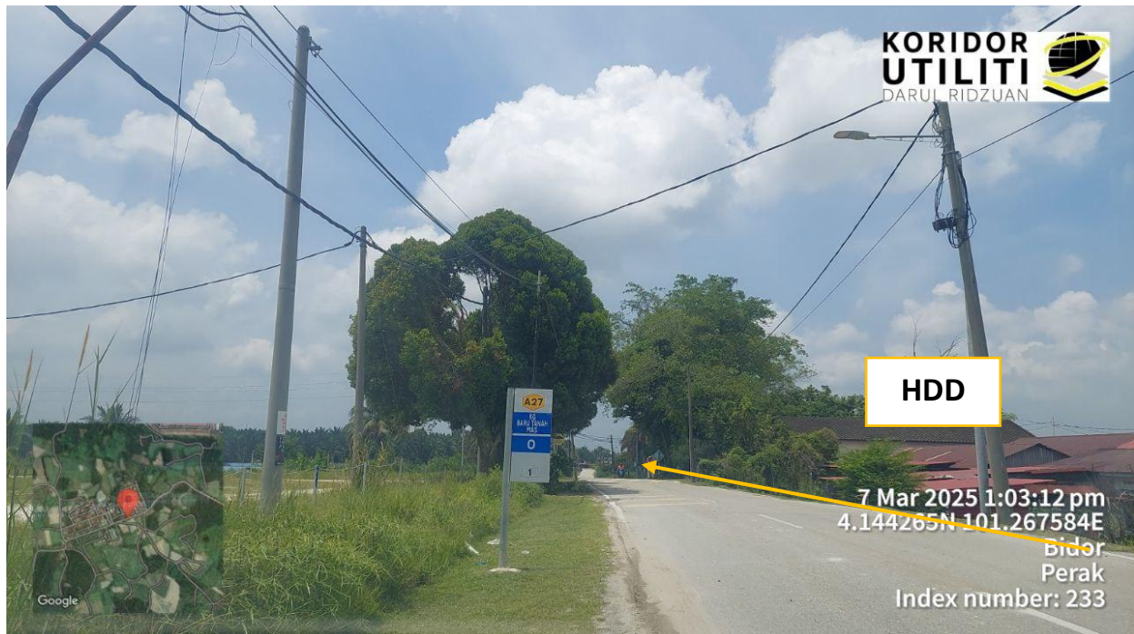
KAEDAH HDD DI JALAN JKR