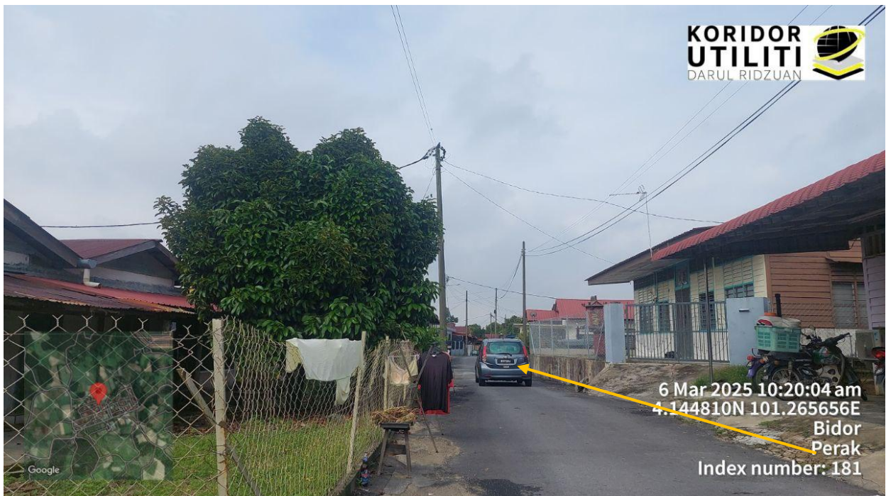
HAJARAN BAGI PEMASANGAN UTILITI

6 Mar 2025 10:14:20 am 4.143327N 101.264143E Jalan Tanpa Nama Bidor Perak Index number: 176