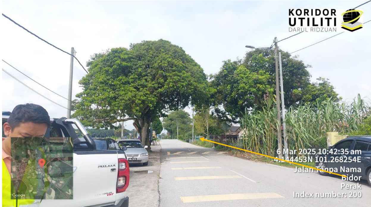
LOKASI MELIBATKAN JALAN JKR A27