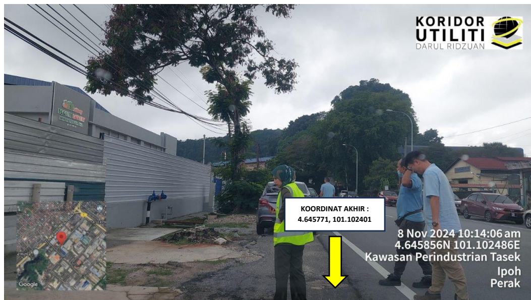
JAJARAN KOREKAN TERBUKA JALAN BERTURAP DI JALAN TASEK AVENUE