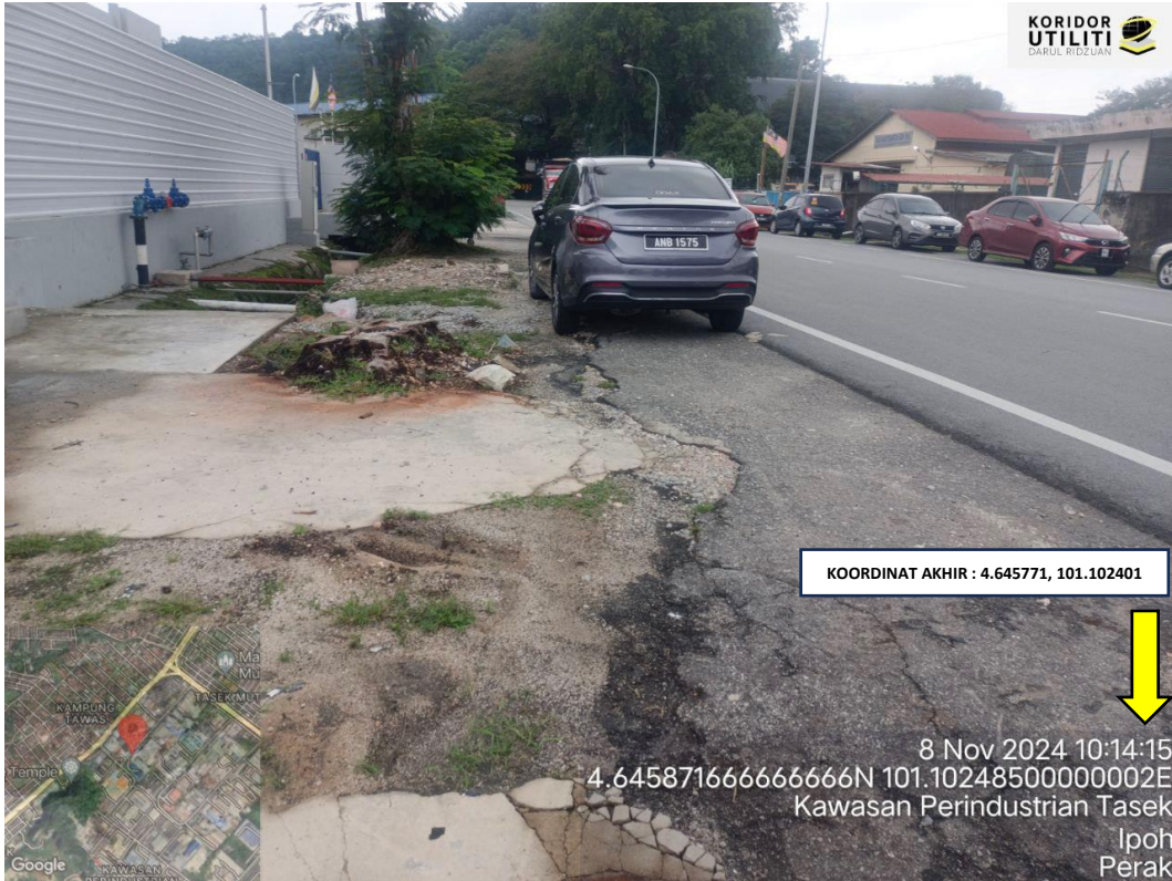
KOORDINAT AKHIR KOREKAN TERBUKA JALAN TASEK AVENUE