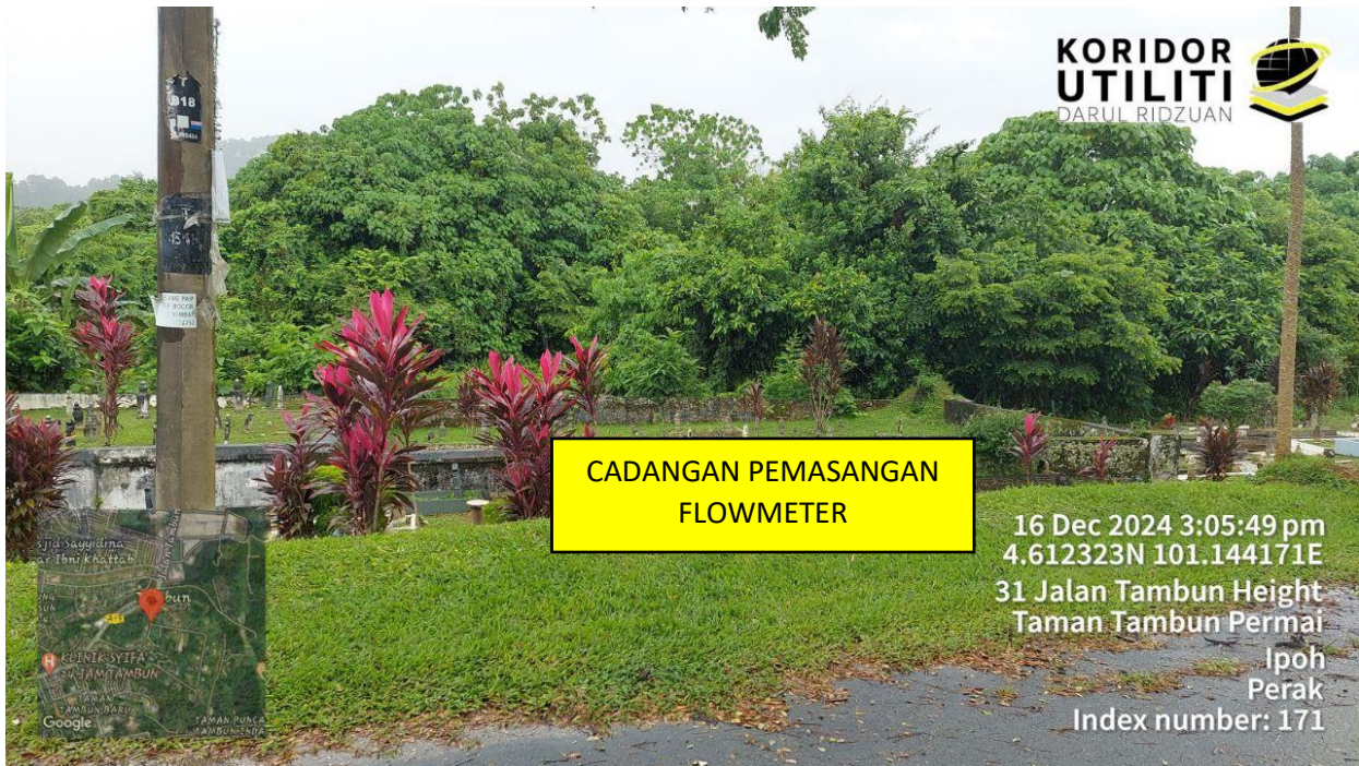
LOKASI DI JALAN TAMBUN