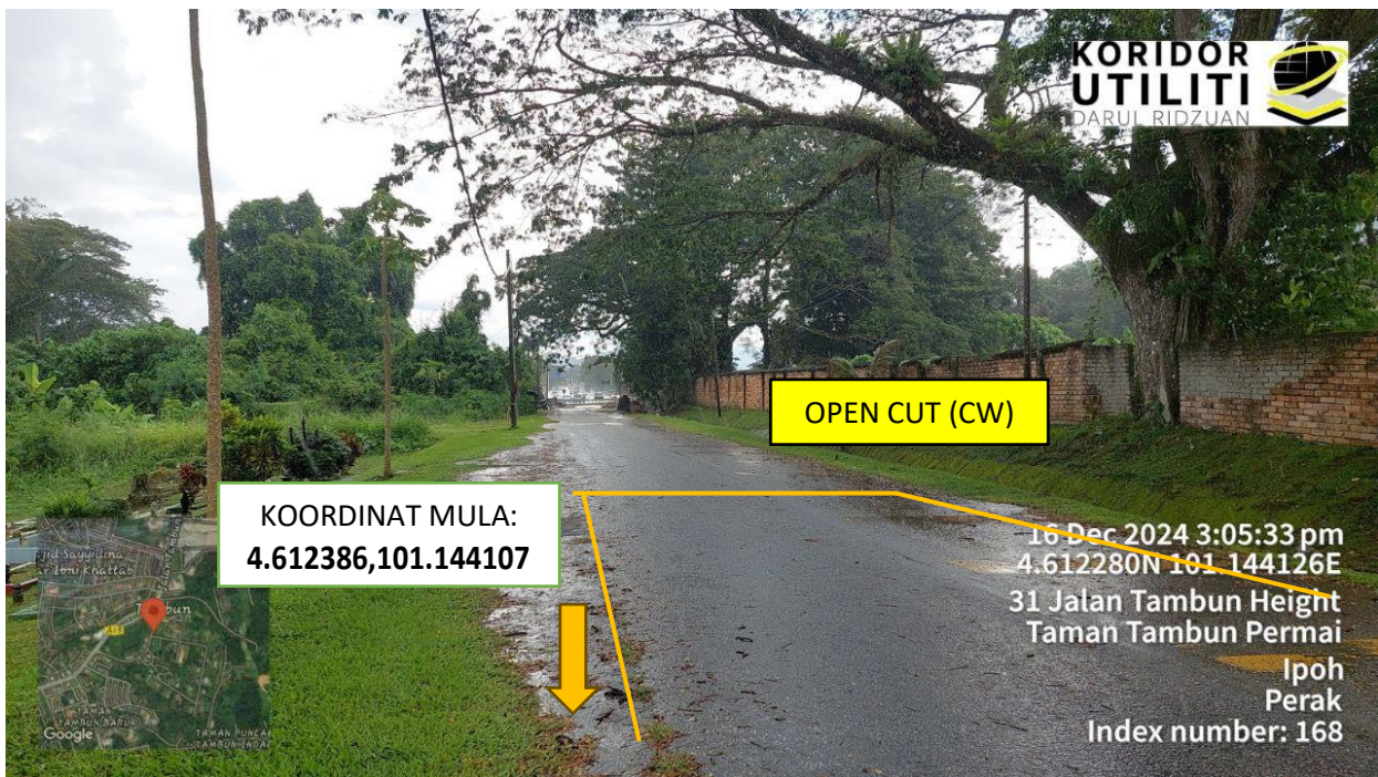
KOREKAN TERBUKA SEPANJANG 30 METER