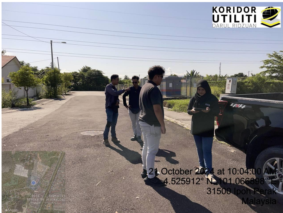
BERSAMA PIHAK PEMOHON