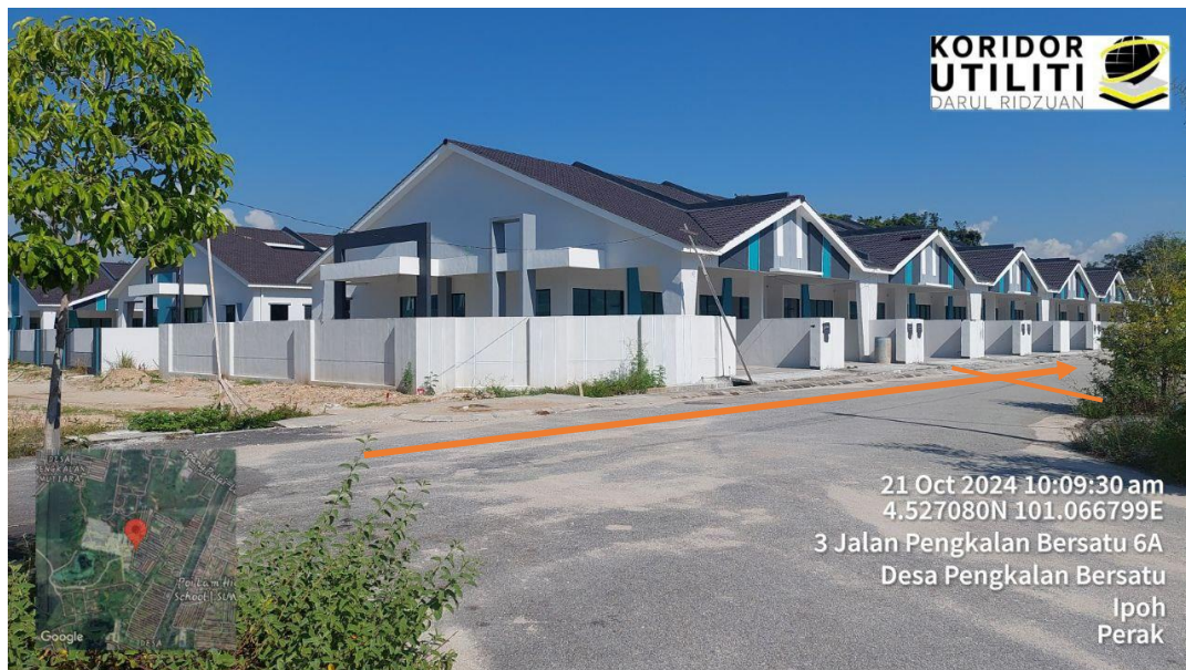
KOREKAN TERBUKA 103 METER