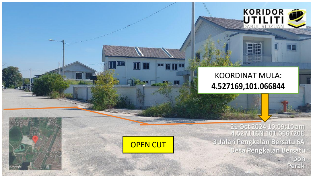
LOKASI DI JALAN PENGKALAN BERSATU 3 SEPANJANG 27 METER