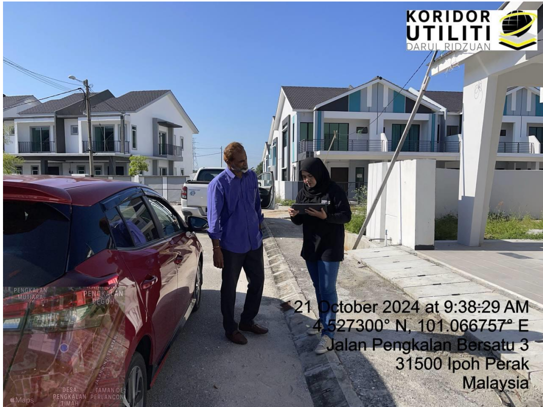
BERSAMA PIHAK MBI