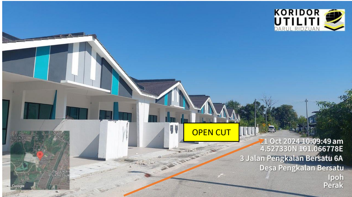
LOKASI DI JALAN PENGKALAN BERSATU 6A