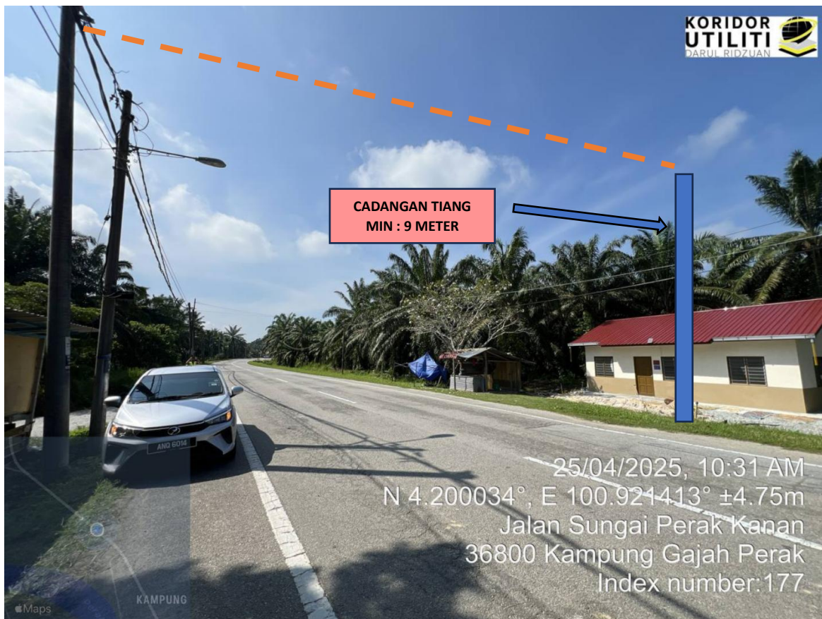
LOKASI KERJA: JALAN KAMPUNG GAJAH-BOTA KANAN-TELUK INTAN