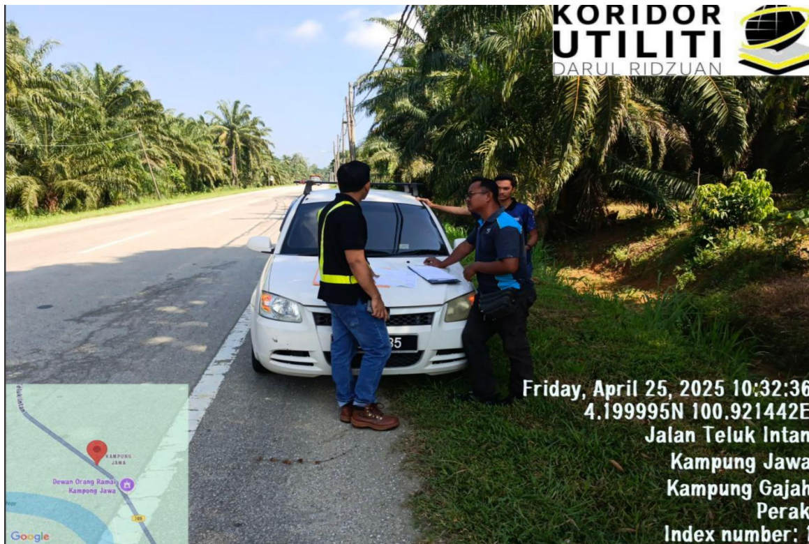
LAWATAN TAPAK AWALAN BERSAMA PEMOHON