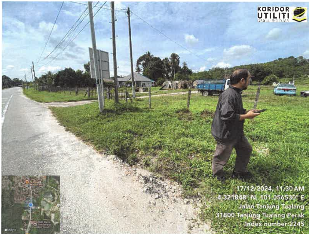
LAWATAN TAPAK AWALAN BERSAMA WAKIL JKR