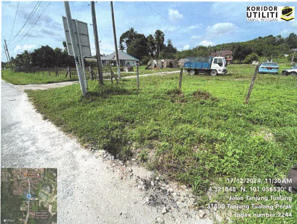
LOKASI CADANGAN KOREKAN TERBUKA BAGI PEMASANGAN PRESSURE REDUCING VALVE (PRV) DI JALAN TANJUNG TUALANG SEPANJANG 5 METER