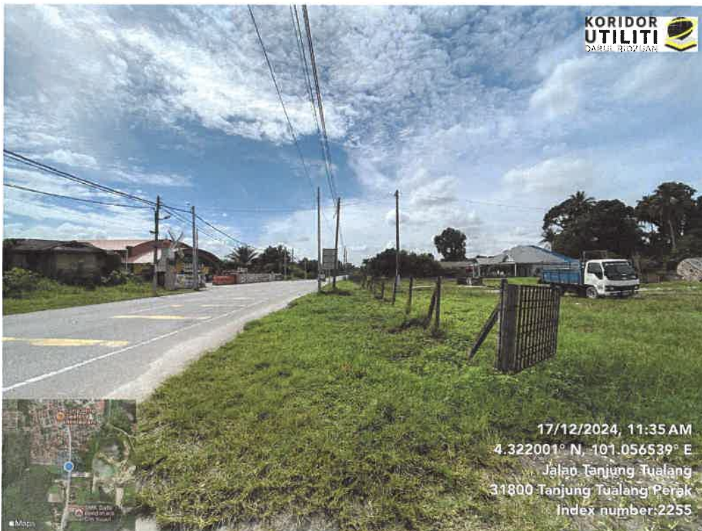
LOKASI CADANGAN KOREKAN TERBUKA BAGI PEMASANGAN PRESSURE REDUCING VALVE (PRV) DI JALAN TANJUNG TUALANG SEPANJANG 5 METER