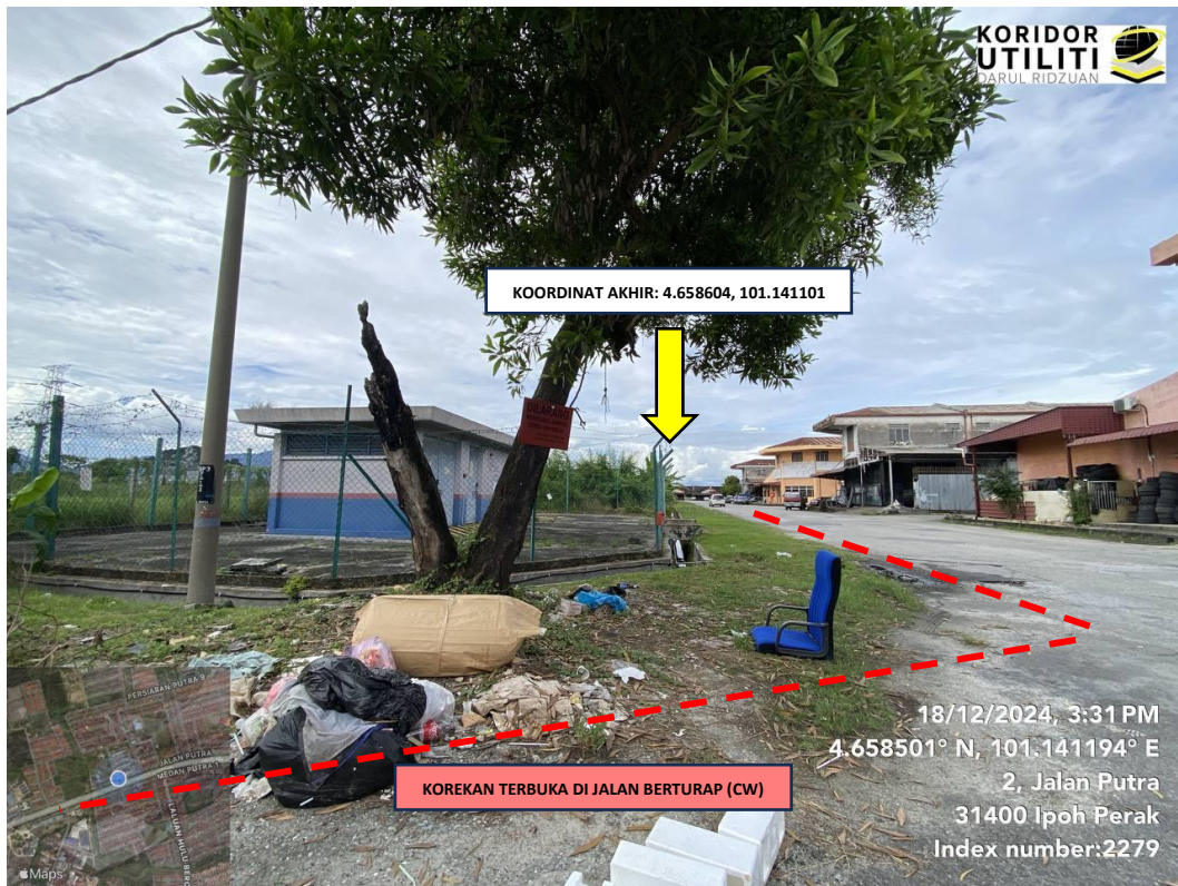
LOKASI KOORDINAT AKHIR KOREKAN TERBUKA DI JALAN PUTRA