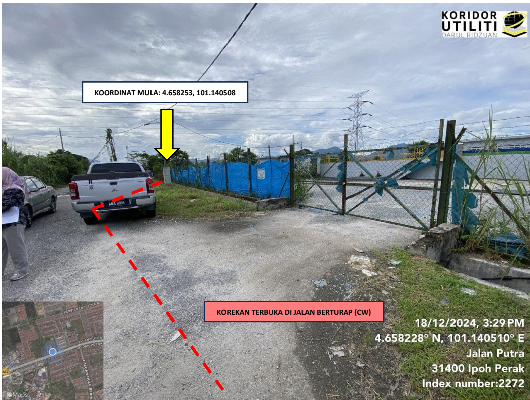
LOKASI KOORDINAT MULA KOREKAN TERBUKA DI JALAN PUTRA