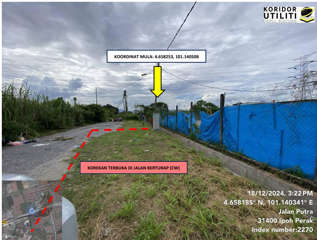
LOKASI KOORDINAT MULA KOREKAN TERBUKA DI JALAN PUTRA