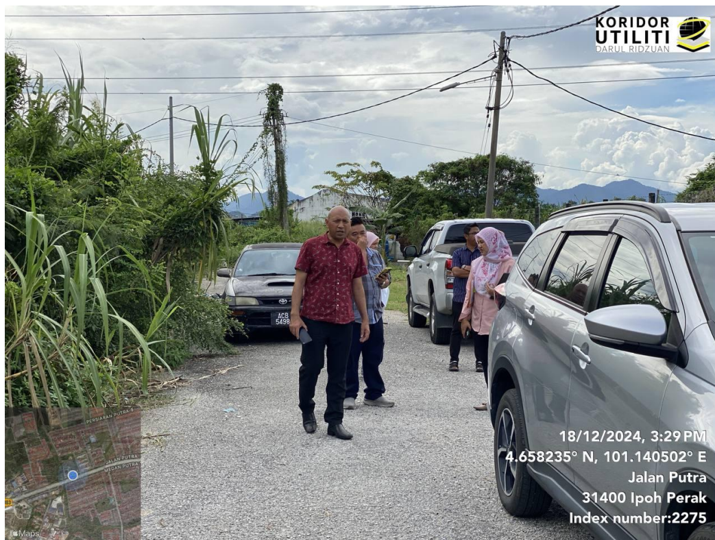
LAWATAN TAPAK AWALAN BERSAMA WAKIL MBI DAN PEMOHON