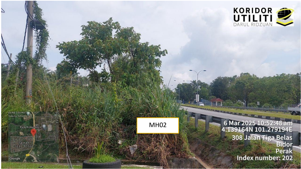
LOKASI DI TAMAN SRI BIDOR