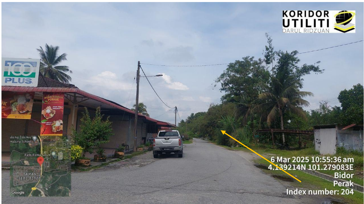
JAJARAN BAGI CADANGAN PEMASANGAN UTILITI