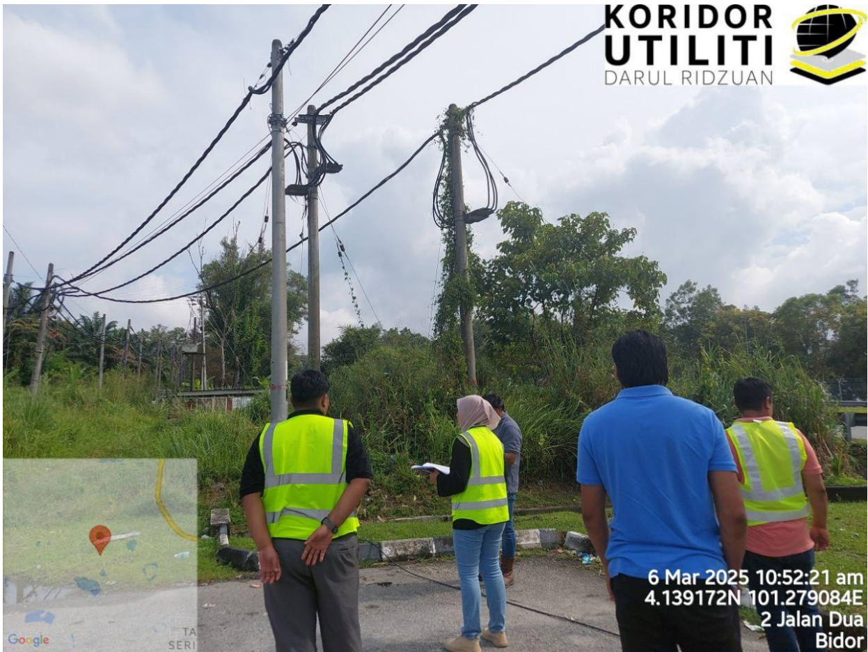
PERBINCANGAN BERSAMA PEMOHON DAN KONTRAKTOR