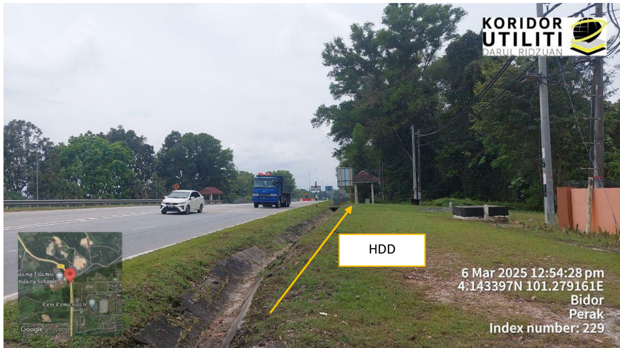
LOKASI DI JALAN BESAR (FT01)