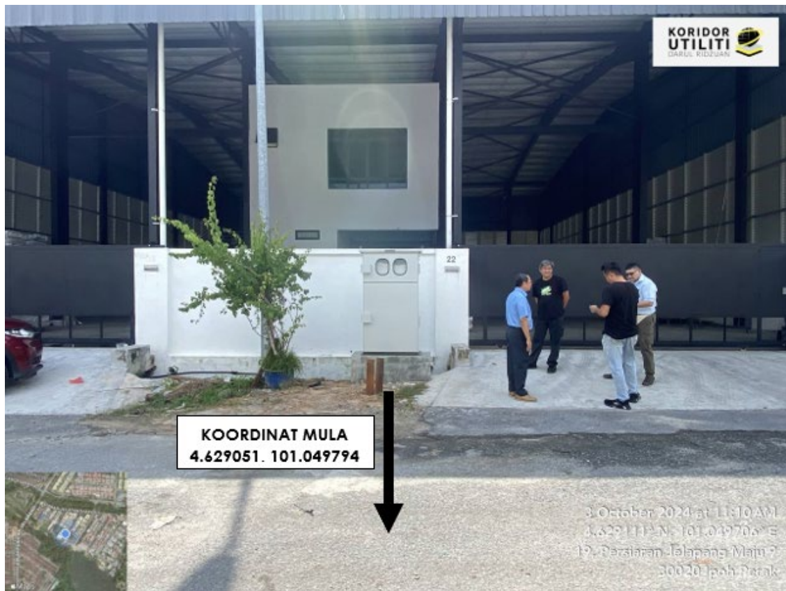
LOKASI DI PERSIARAN JELAPANG MAJU 9