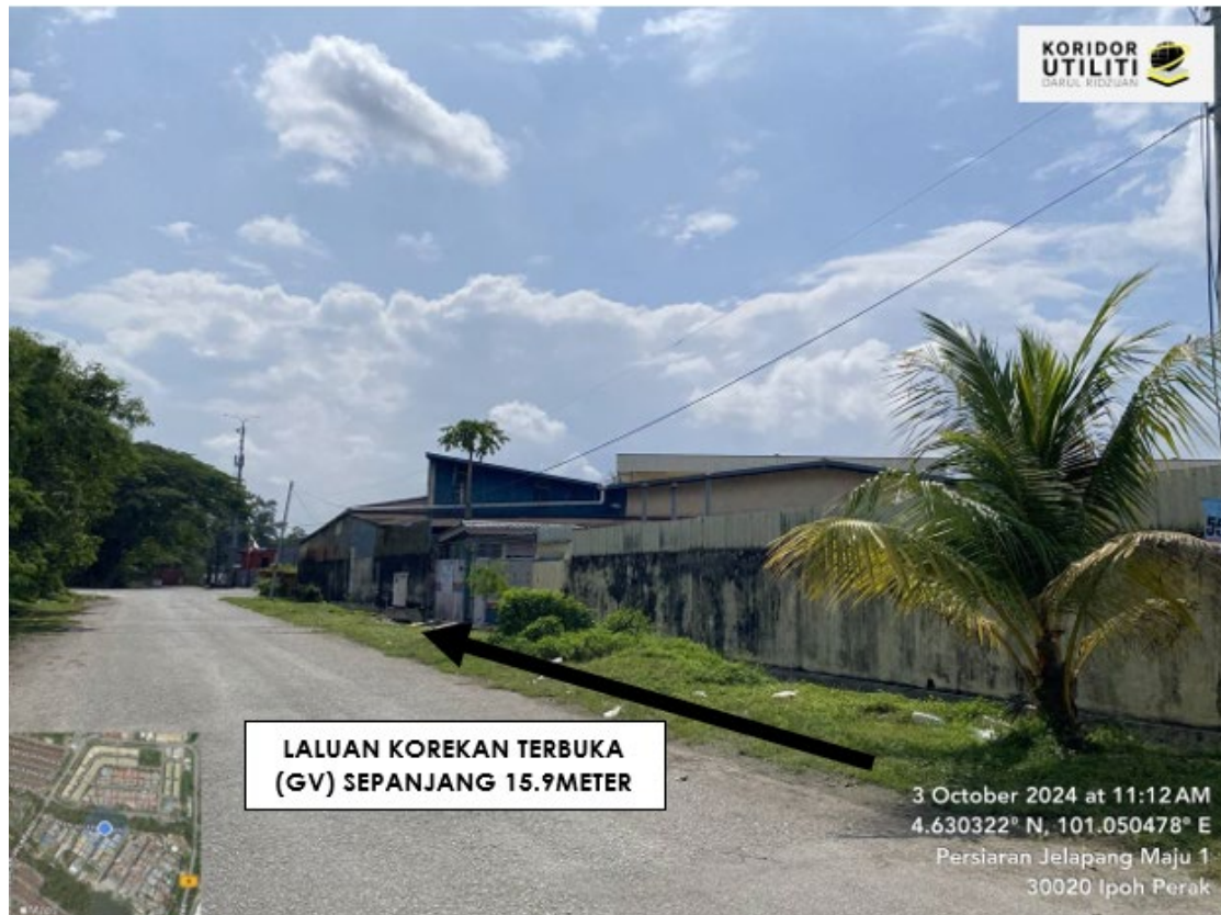
LOKASI DI PERSIARAN JELAPANG MAJU 9