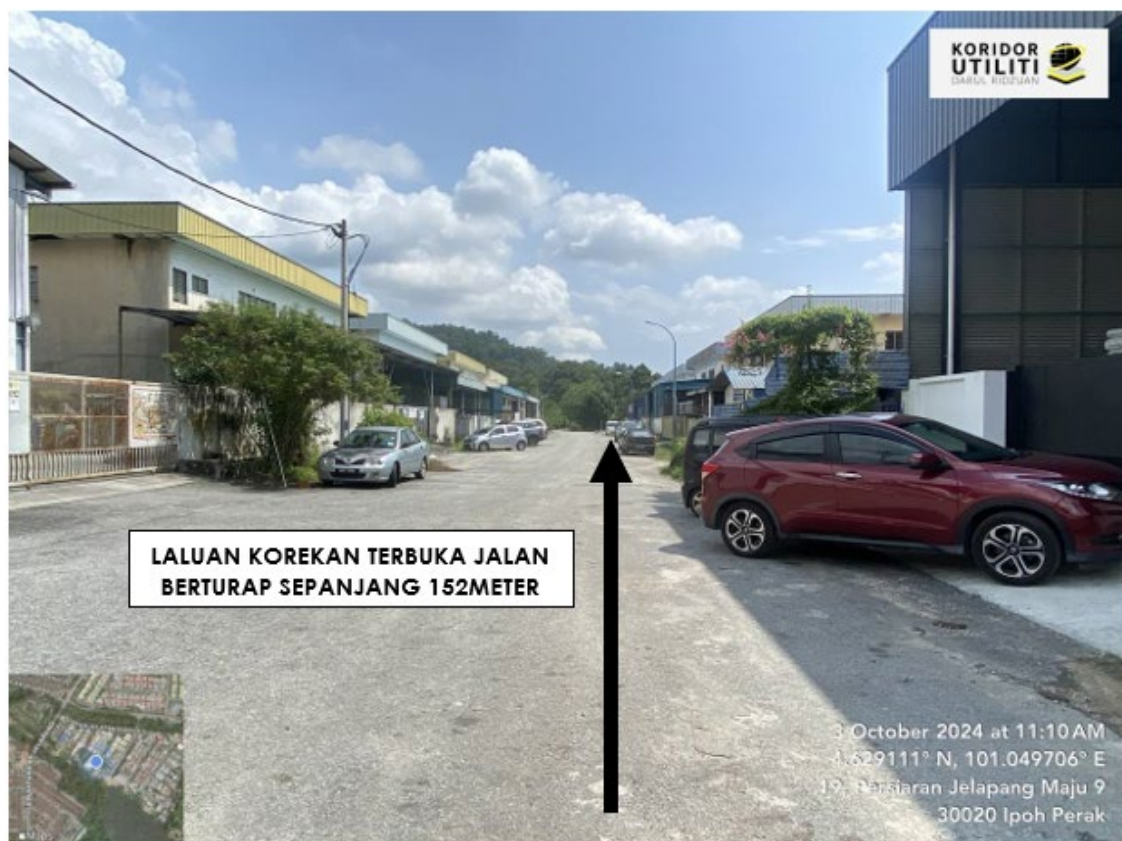
LOKASI DI PERSIARAN JELAPANG MAJU 9