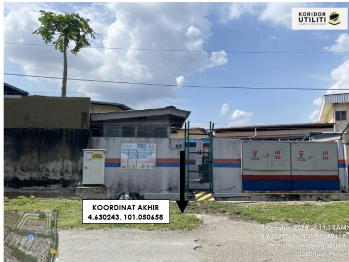
LOKASI DI PERSIARAN JELAPANG MAJU 9