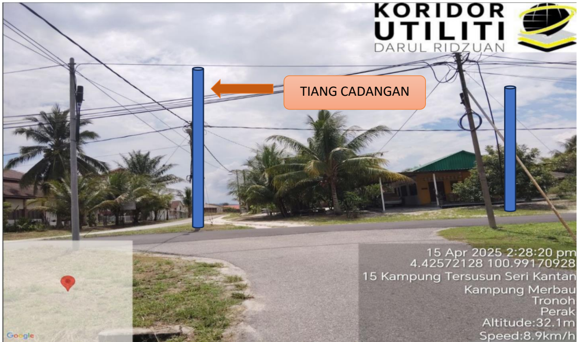
LOKASI JAJARAN TIANG CADANGAN DI LALUAN KAMPUNG TERSUSUN SERI KANTAN