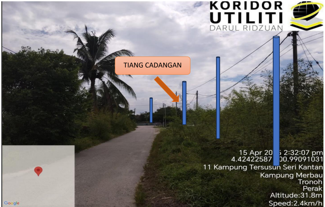
L LOKASI JAJARAN TIANG CADANGAN DI LALUAN SMK TRONOH