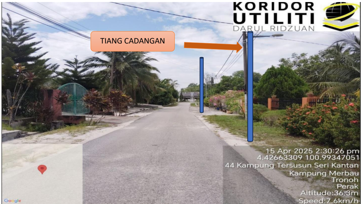
LOKASI JAJARAN TIANG CADANGAN DI LALUAN KAMPUNG TERSUSUN SERI KANTAN