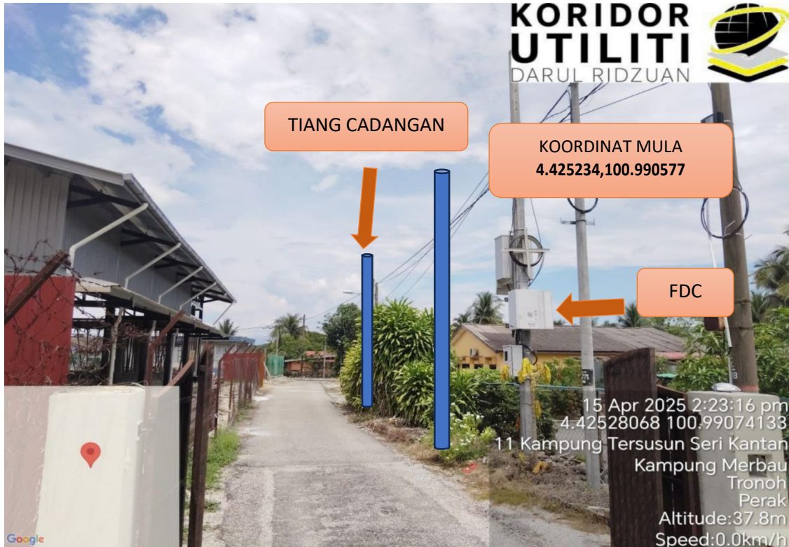
LALUAN SMK TRONOH KOORDINAT MULA 4.425234,100.990577