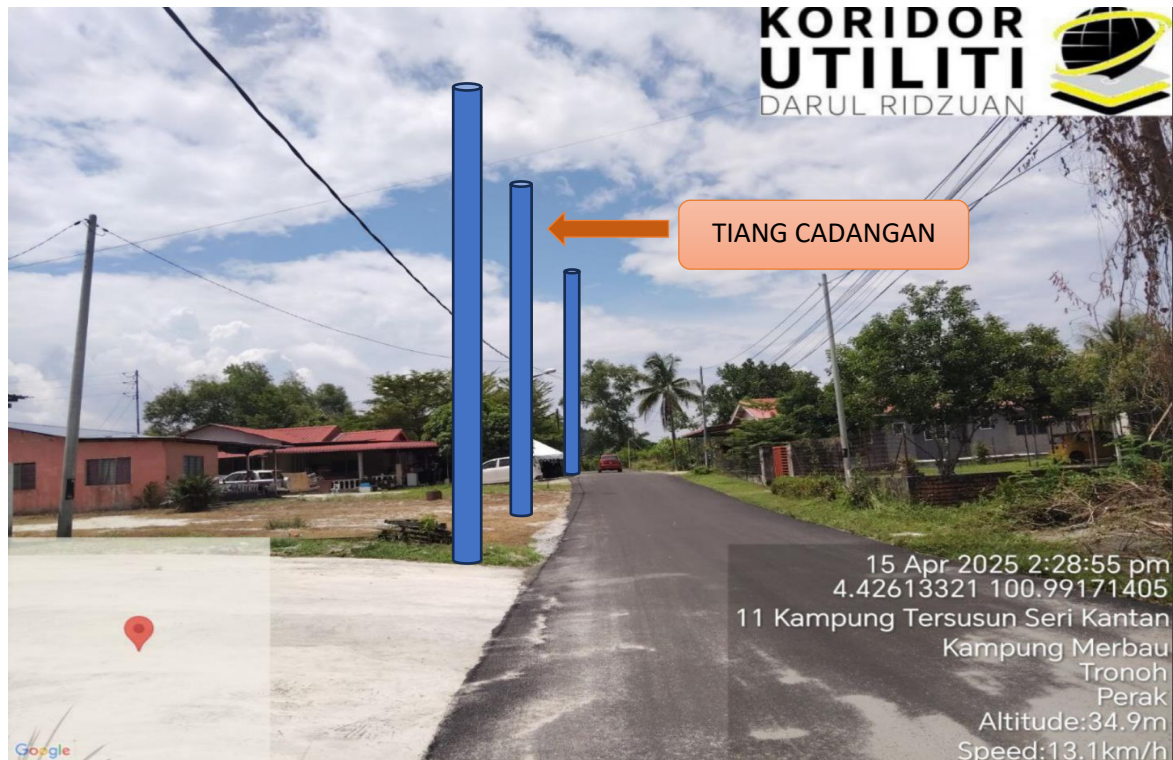
LOKASI JAJARAN TIANG CADANGAN DI LALUAN KAMPUNG TERSUSUN SERI KANTAN