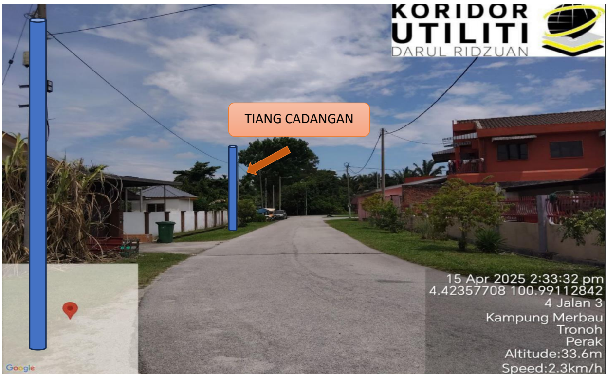
LOKASI JAJARAN TIANG CADANGAN DI JALAN 3