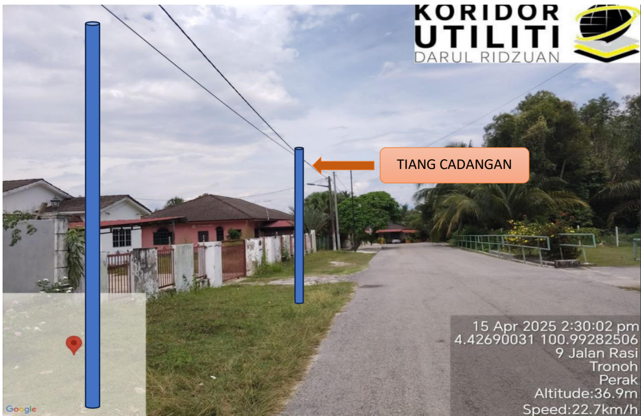
L LOKASI JAJARAN TIANG CADANGAN DI LALUAN KAMPUNG TERSUSUN SERI KANTAN