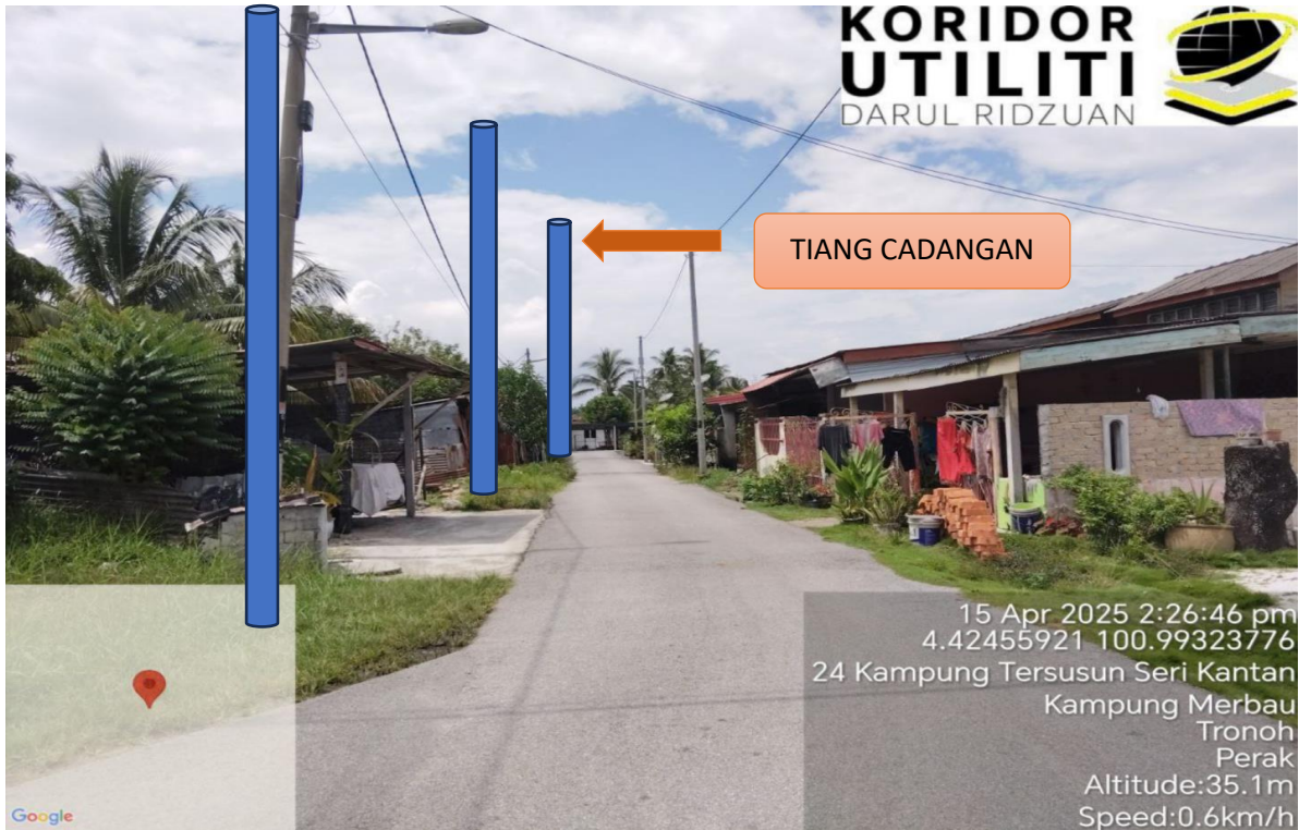
LOKASI JAJARAN TIANG CADANGAN DI LALUAN KAMPUNG TERSUSUN SERI KANTAN