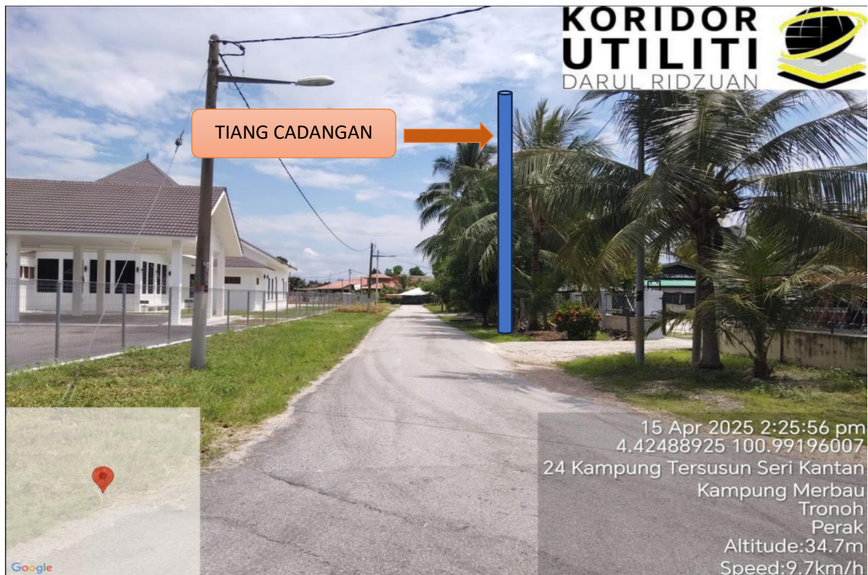
LOKASI JAJARAN TIANG CADANGAN DI LALUAN KAMPUNG TERSUSUN SERI KANTAN