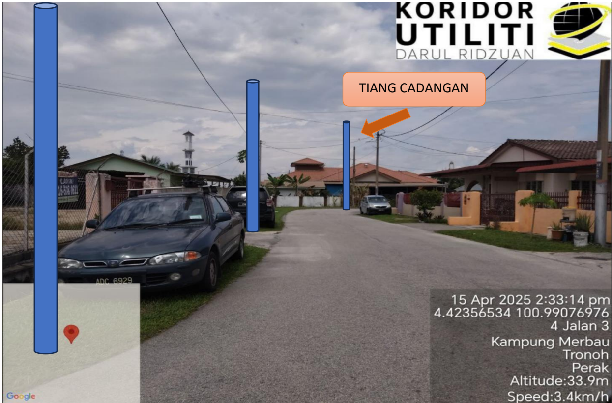
LOKASI JAJARAN TIANG CADANGAN DI JALAN 3