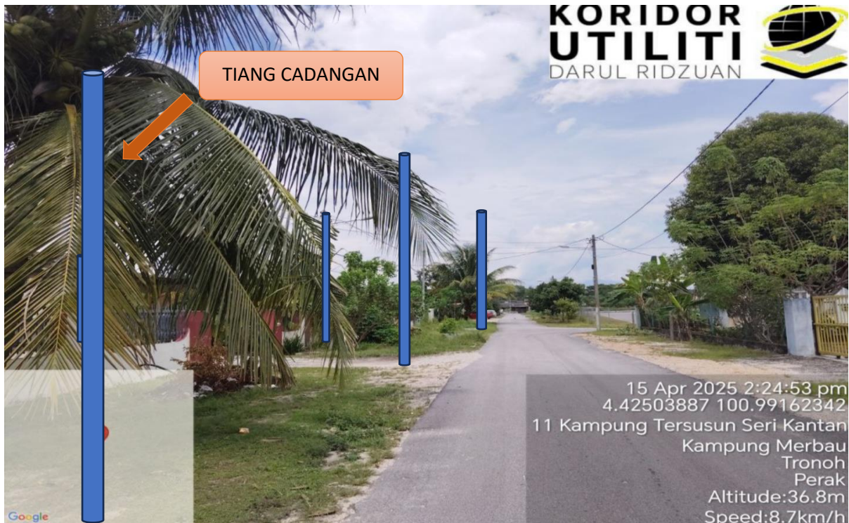
LOKASI JAJARAN TIANG CADANGAN DI LALUAN KAMPUNG TERSUSUN SERI KANTAN