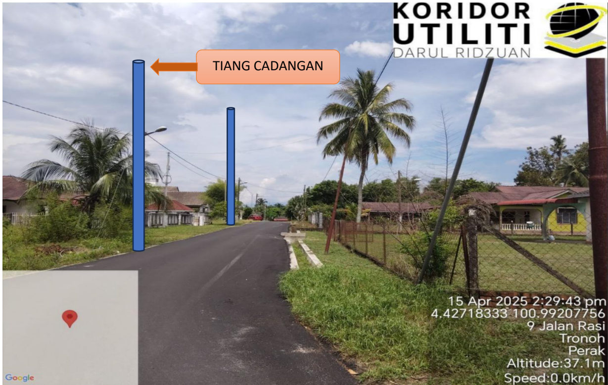
L LOKASI JAJARAN TIANG CADANGAN DI LALUAN KAMPUNG TERSUSUN SERI KANTAN