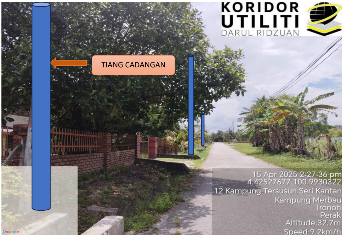
LOKASI JAJARAN TIANG CADANGAN DI LALUAN KAMPUNG TERSUSUN SERI KANTAN