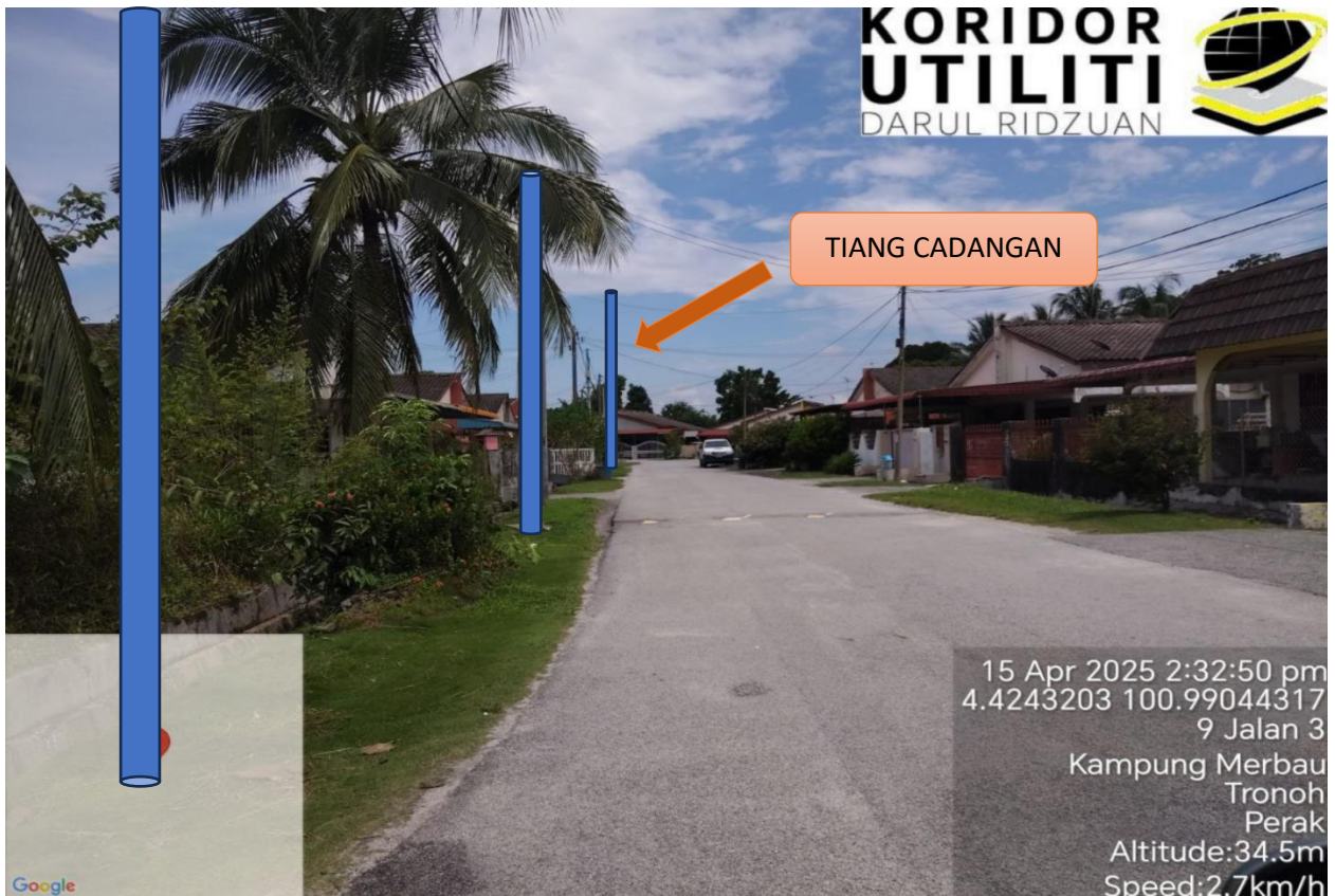
LOKASI JAJARAN TIANG CADANGAN DI JALAN 3