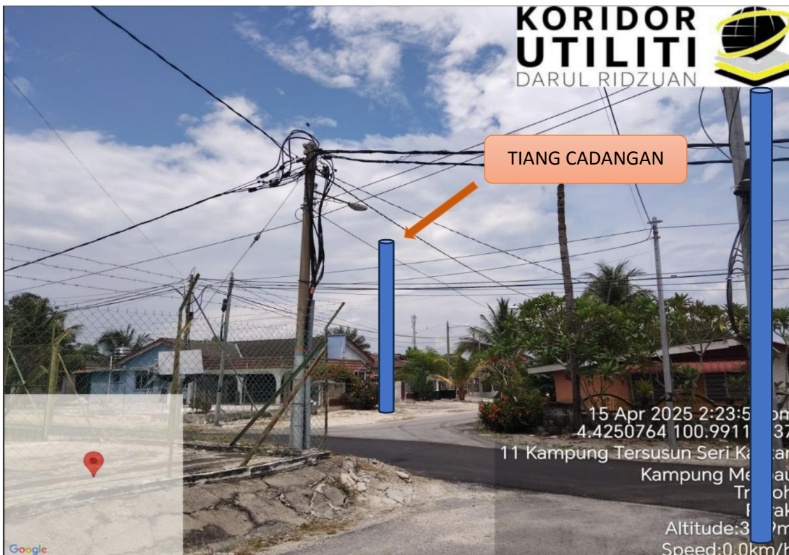
LOKASI JAJARAN TIANG CADANGAN DI LALUAN SMK TRONOH