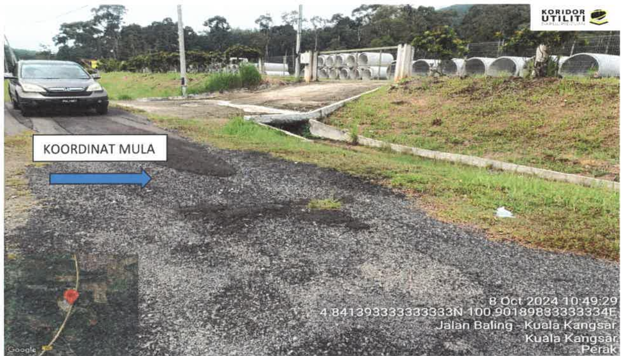
KOORDINAT MULA – JALAN BALING KUALA KANGSAR