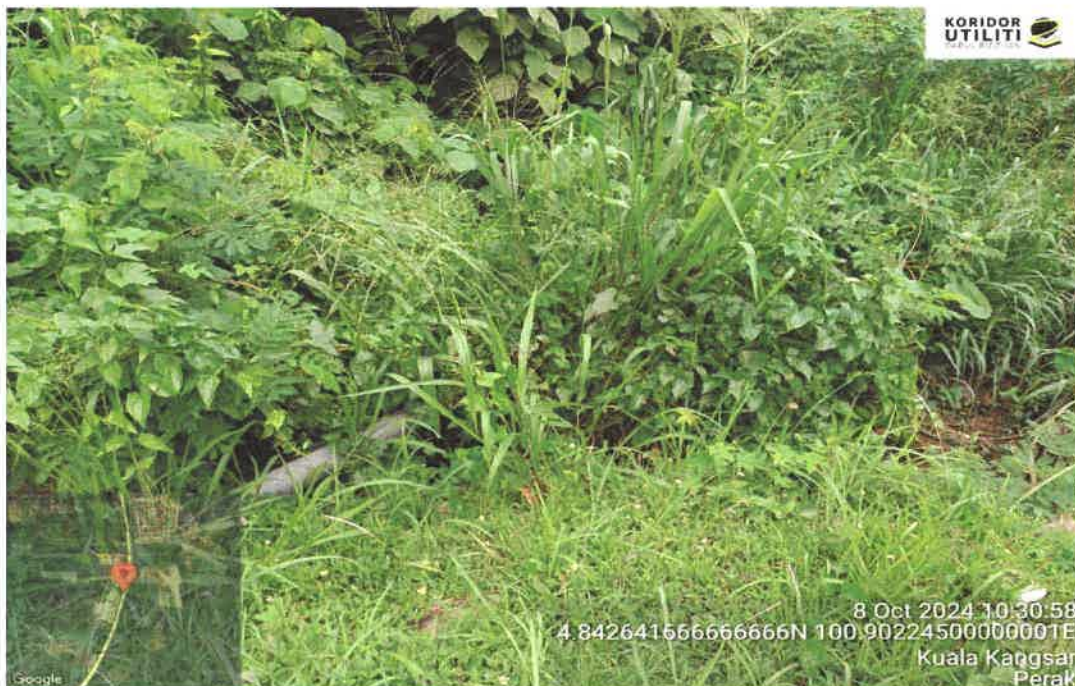
KOORDINAT AKHIR – PAIP LAP