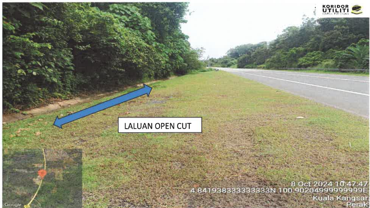
LALUAN OPEN CUT – JALAN BALING KUALA KANGSAR