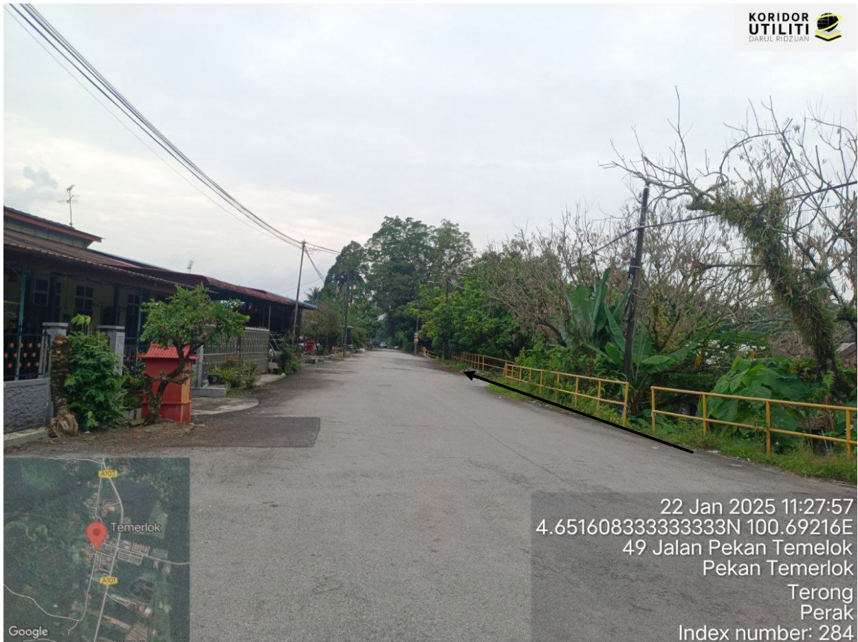
LALUAN PENANAMAN TIANG – JALAN PEKAN TEMERLOK