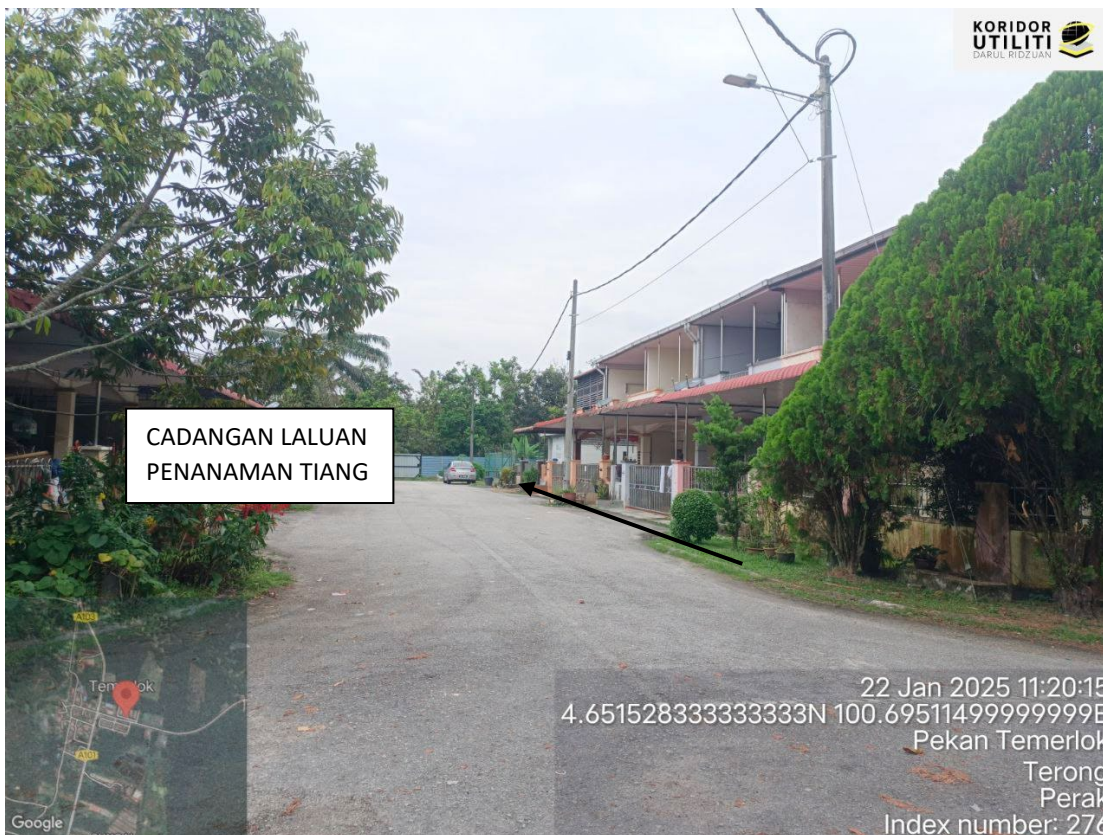
LORONG PERMAI 4 – CADANGAN PENANAMAN TIANG

22 Jan 2025 11:20:52 4.651403333333334N 100.69562666666667E Lorong Permai 1 Pekan Temerlok Terong Perak Index number: 277