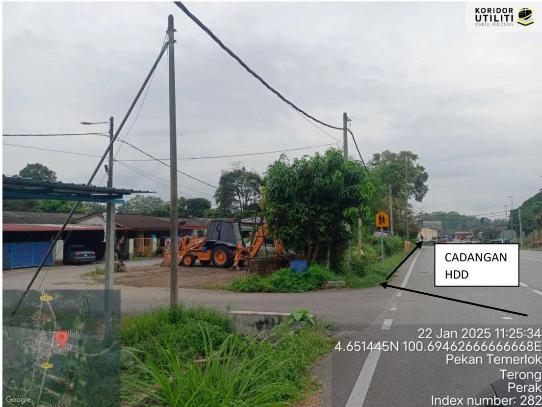
CADANGAN HDD SEPANJANG JALAN JKR