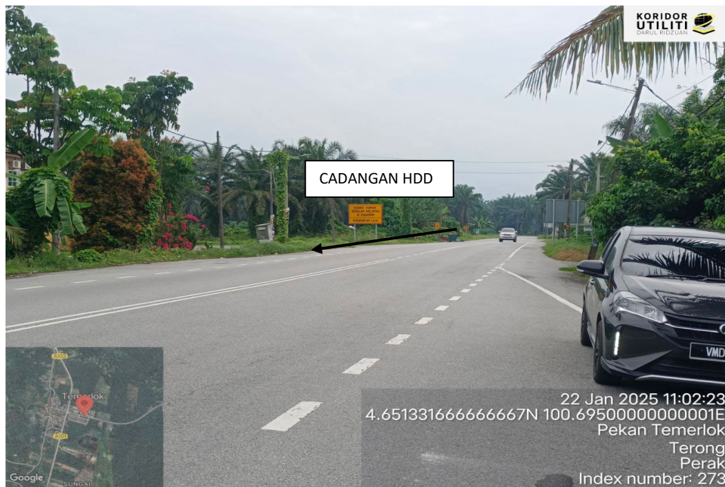
CADANGAN HDD SEPANJANG JALAN JKR