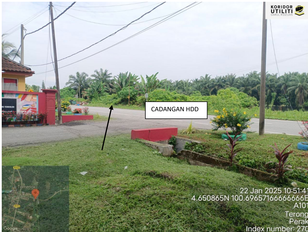
CADANGAN HDD – DI HADAPAN SJKT LADANG TEMERLOK