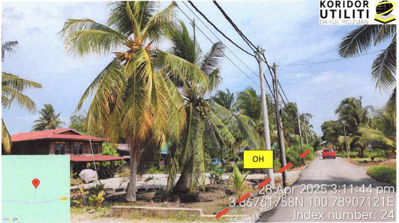
Jalan Kampung Sungai Batang