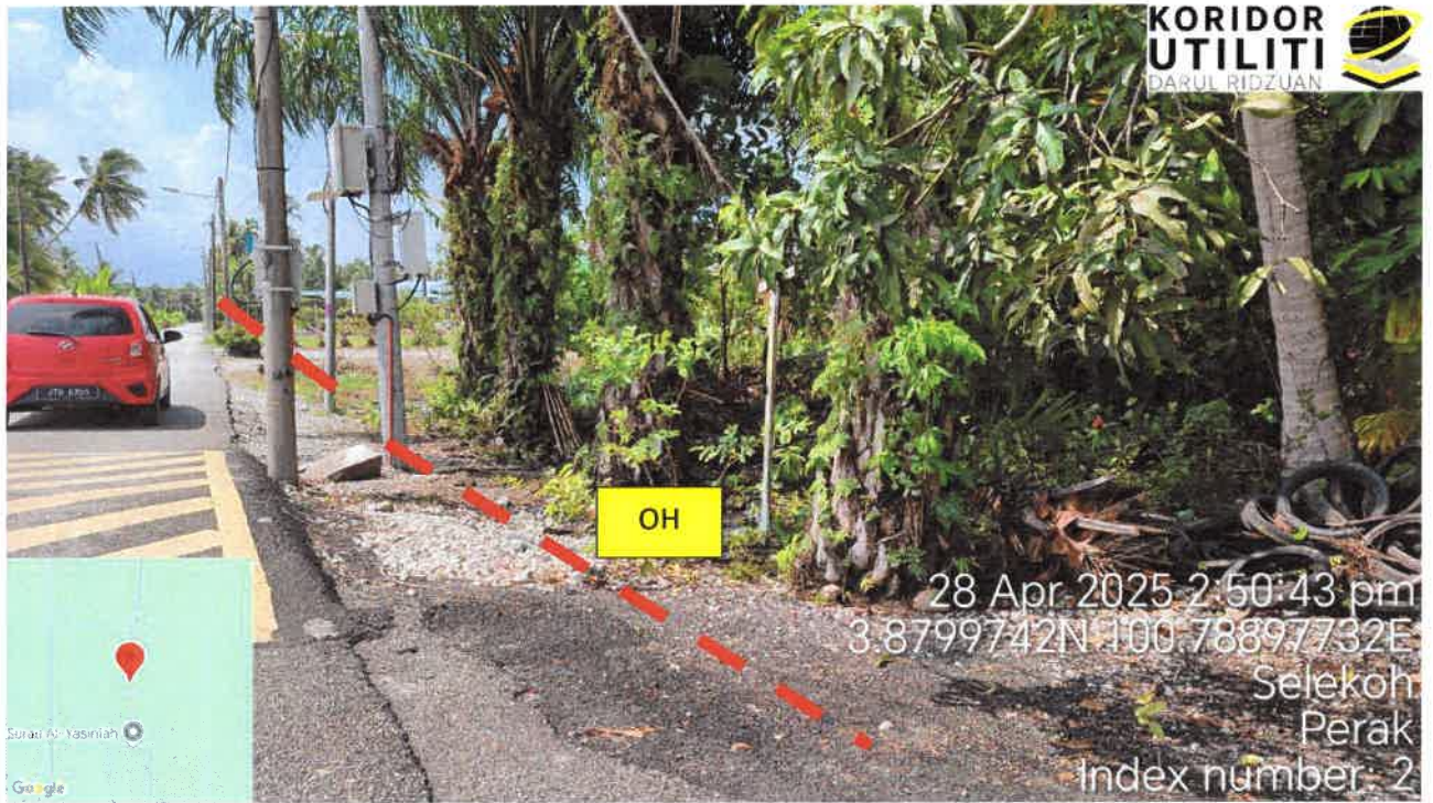
Jalan Kampung Sungai Batang