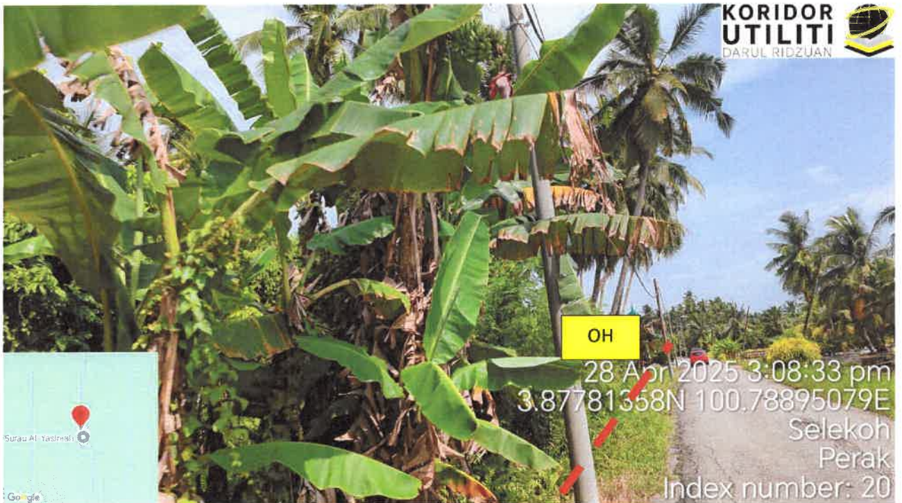
Jalan Kampung Sungai Batang