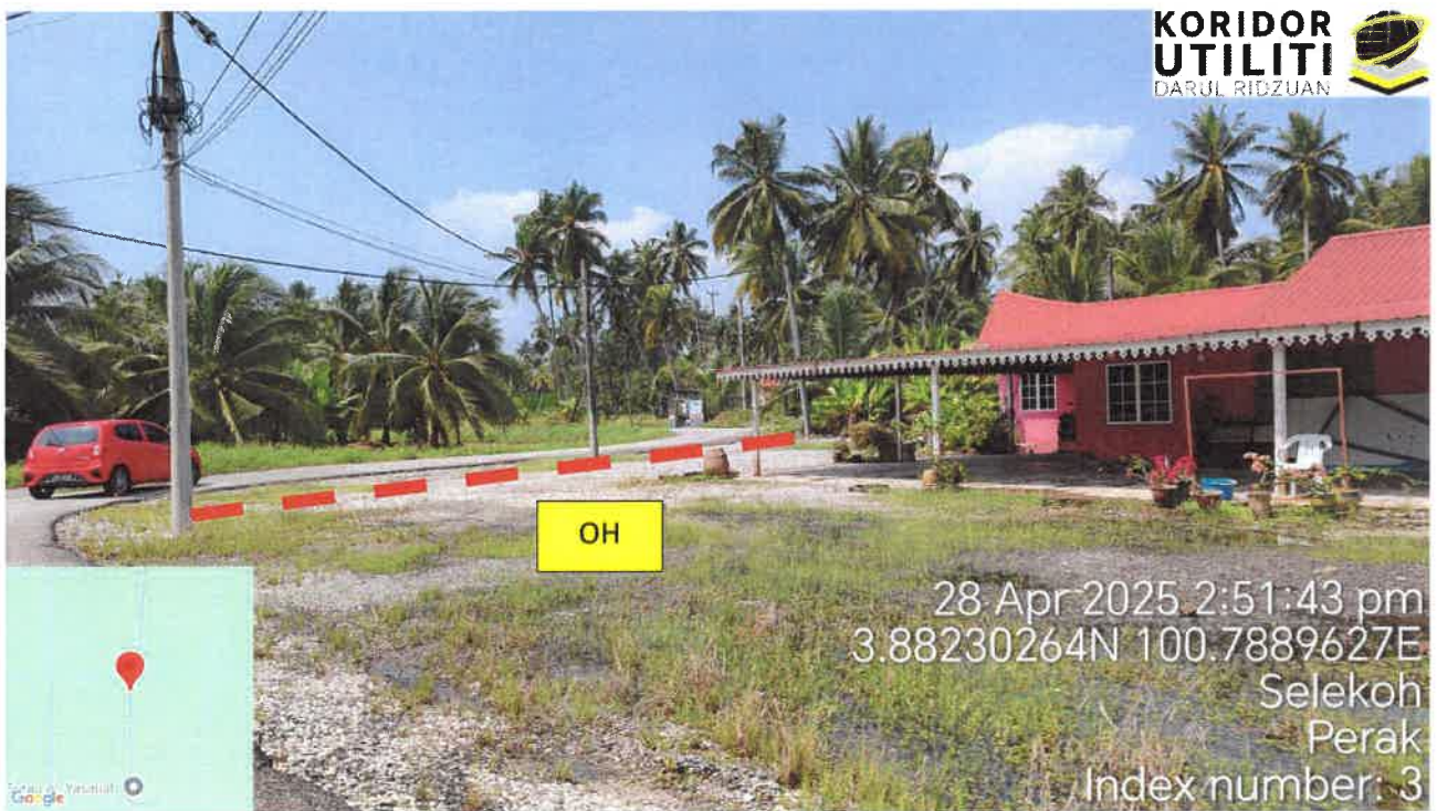
Jalan Kampung Sungai Batang