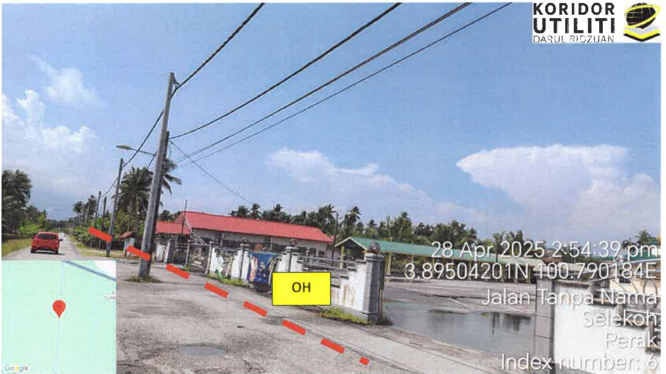
Jalan Kampung Sungai Batang

28 Apr 2025 2:54:39 pm 3.89504201N 100.790184E Jalan Tanpa Nama Selekoh Perak Index number: 6