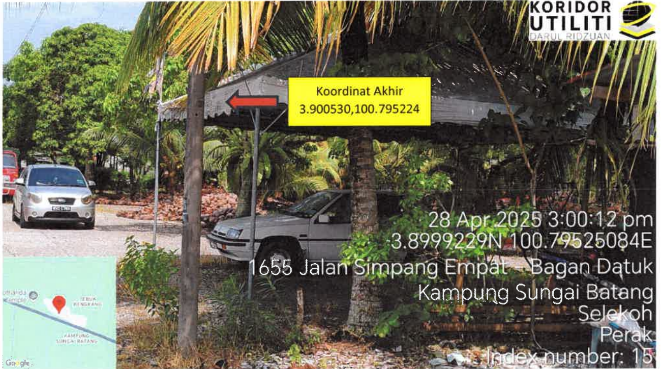
Jalan Kampung Batu 21