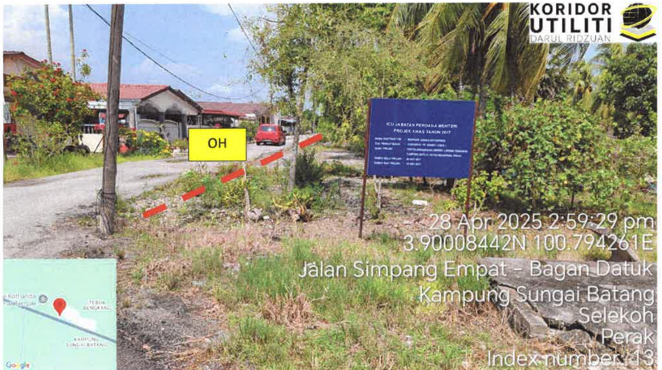
Jalan Kampung Batu 21