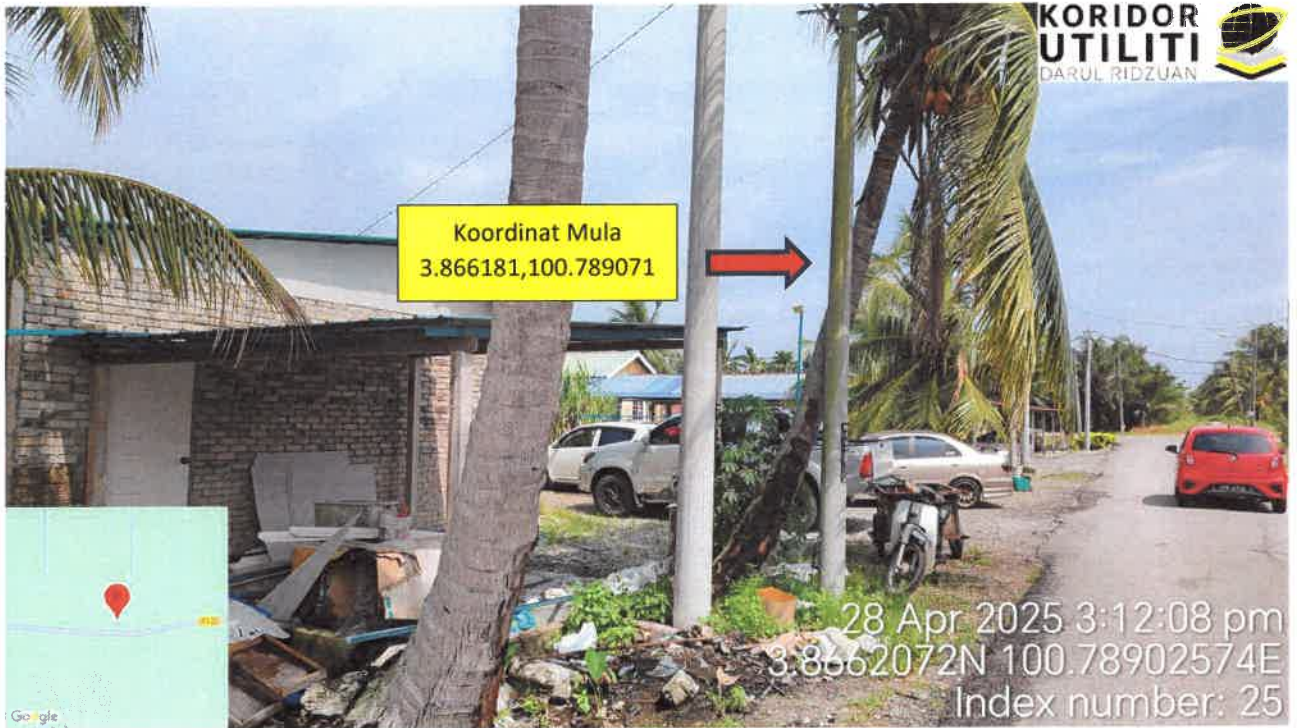
Jalan Kampung Sungai Batang