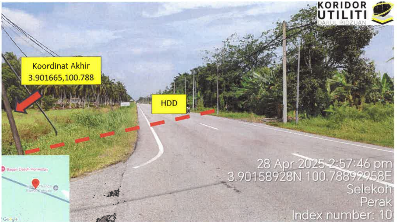
Jalan Hutan Melintang - Bagan Datuk