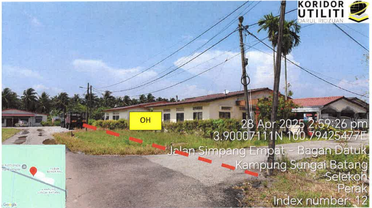
Jalan Kampung Batu 21