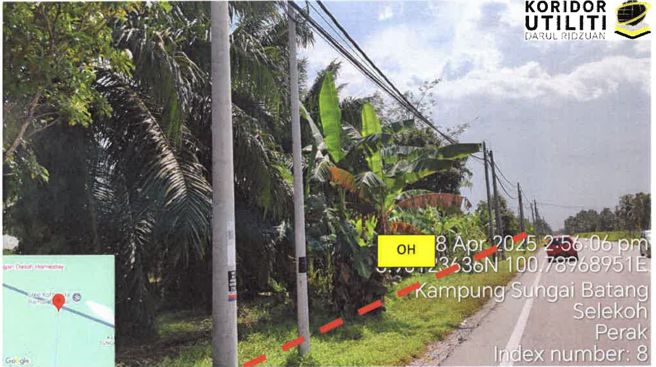
Jalan Hutan Melintang - Bagan Datuk