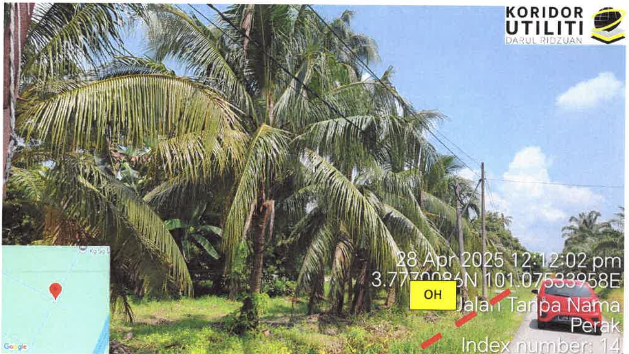
Jalan Kampung Sungai Samak