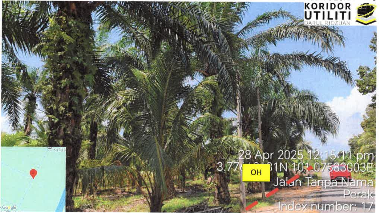
Jalan Kampung Sungai Samak