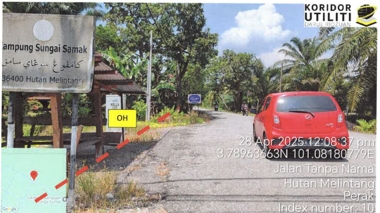
Jalan Kampung Sungai Samak