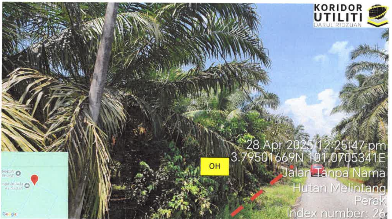
Jalan Haji Tahir