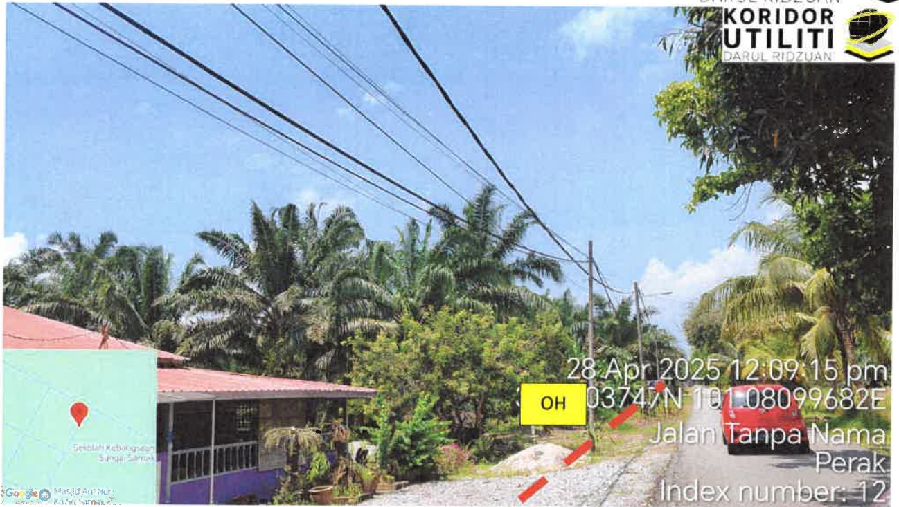
Jalan Kampung Sungai Samak