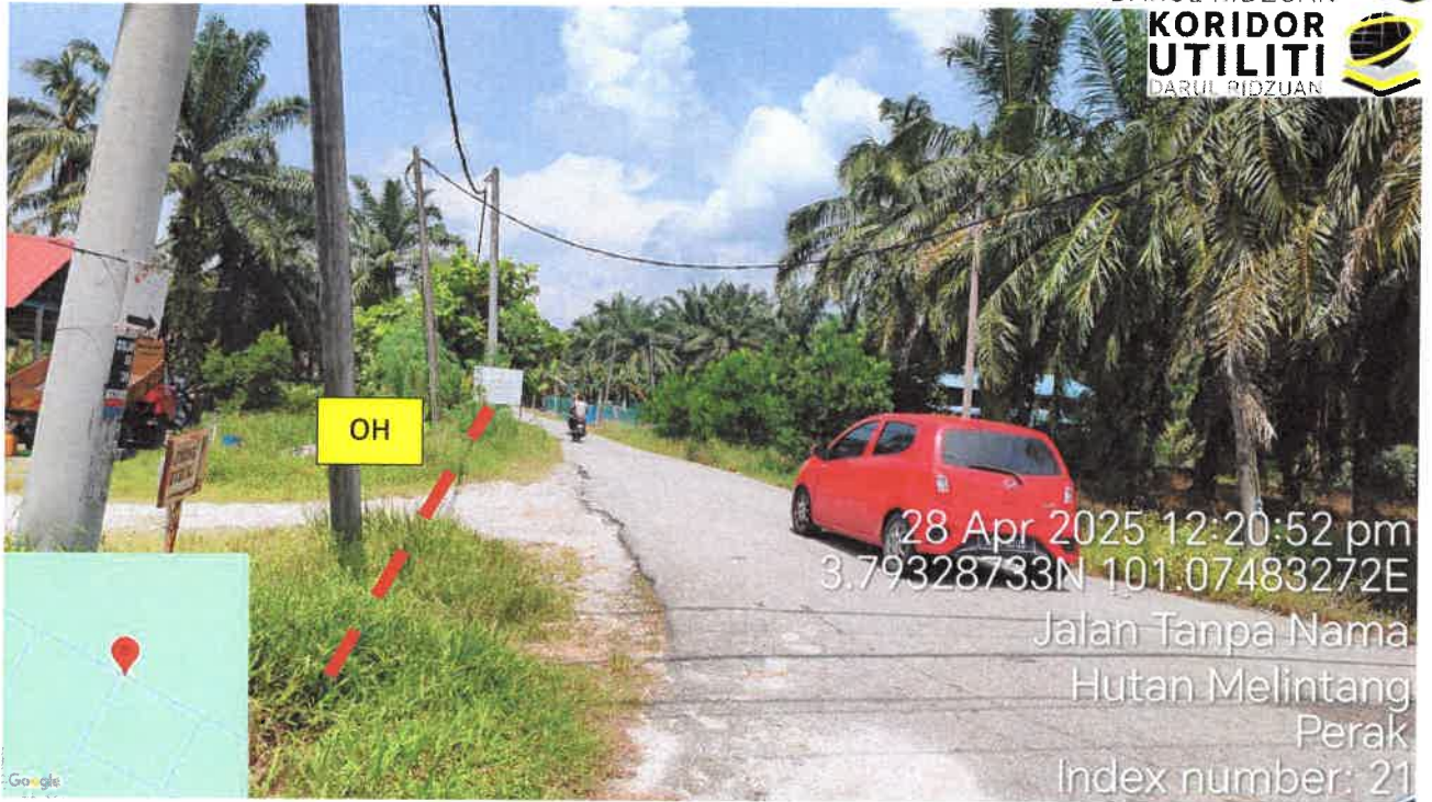
Jalan Kampung Sungai Samak