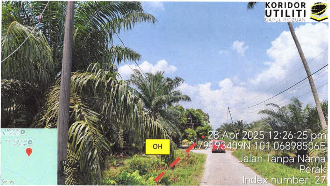
Jalan Haji Tahir