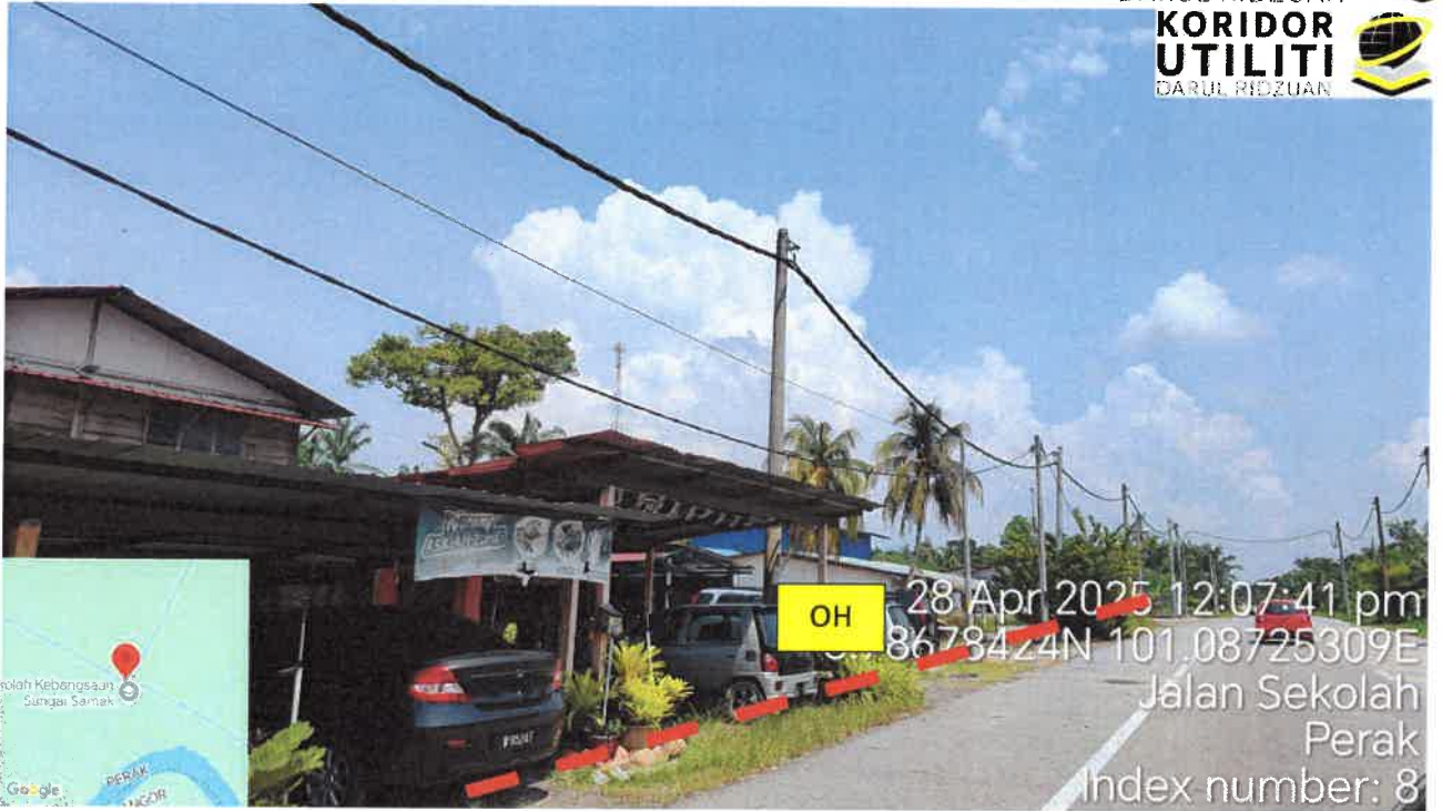
Jalan Kampung Bagan Lalang – Jalan Sungai Manila