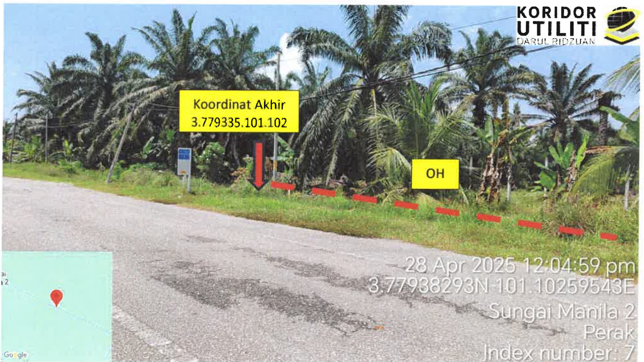
Jalan Kampung Bagan Lalang – Jalan Sungai Manila