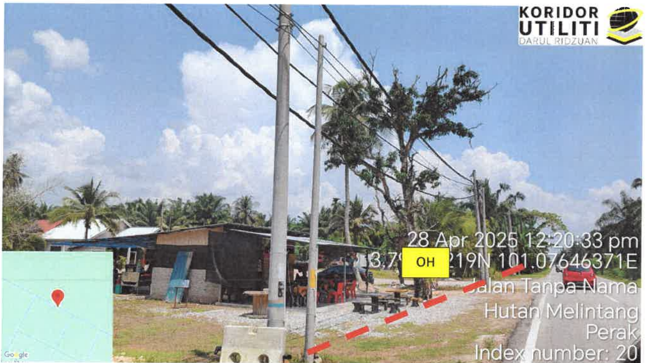
Jalan Kampung Bagan Lalang – Jalan Sungai Manila