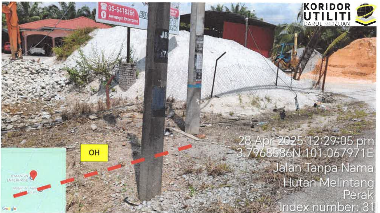
Jalan Kampung Bagan Lalang – Jalan Sungai Manila