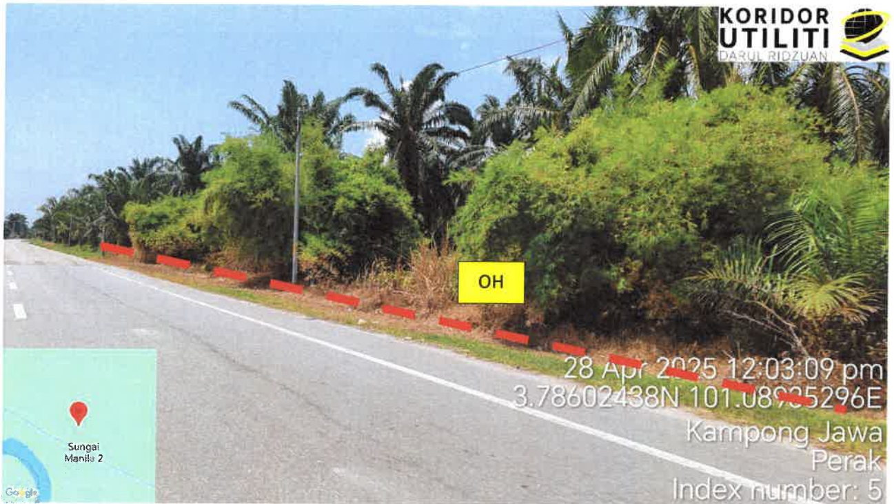
Jalan Kampung Bagan Lalang – Jalan Sungai Manila