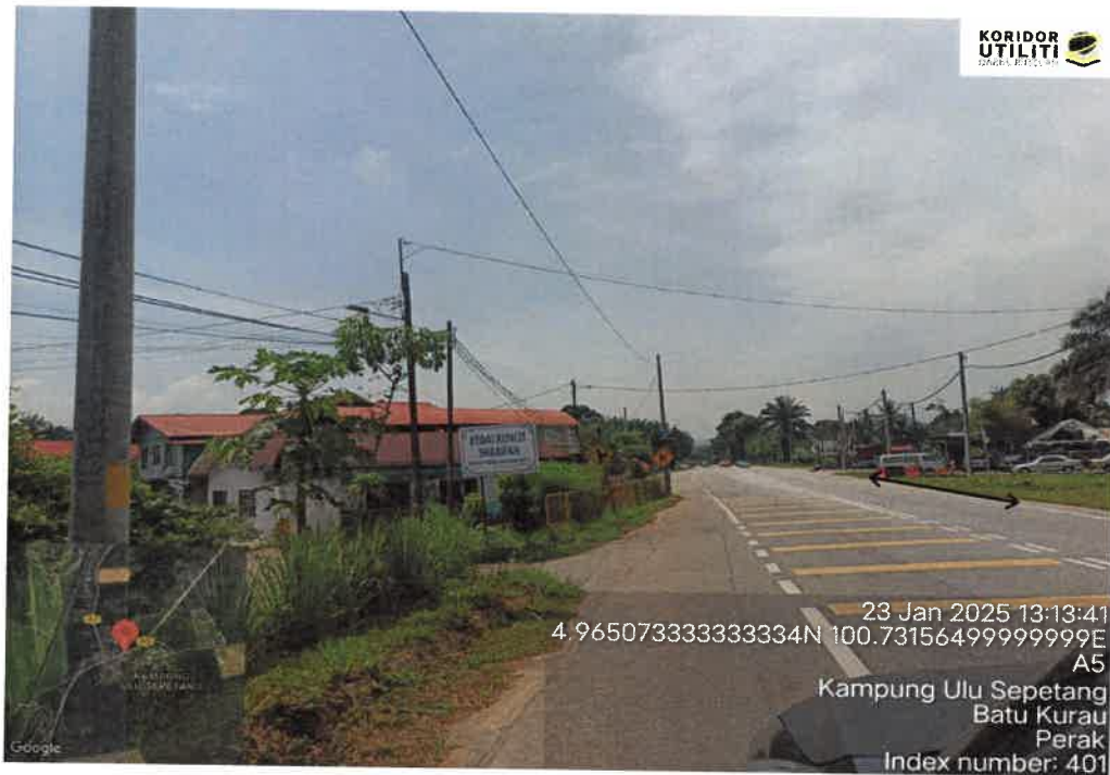
CADANGAN LALUAN METHOD HDD