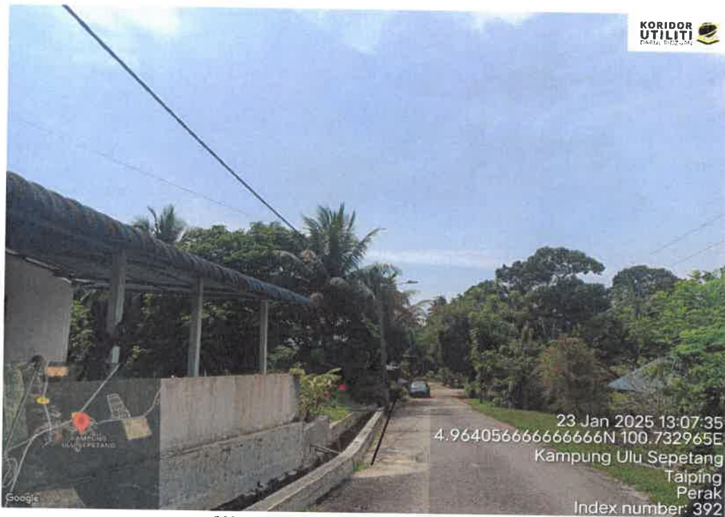
CADANGAN LALUAN – PENANAMAN TIANG

23 Jan 2025 13:07:35 4.9640566666666666N 100.732965E Kampung Ulu Sepetang Taiping Perak Index number: 392