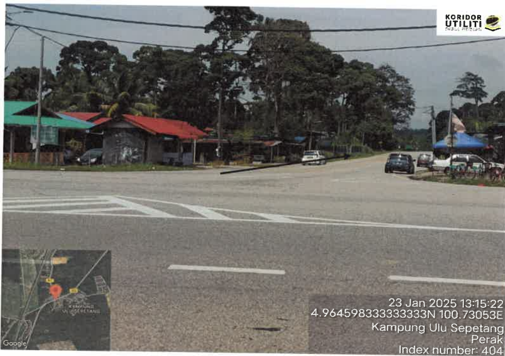
CADANGAN LALUAN HDD