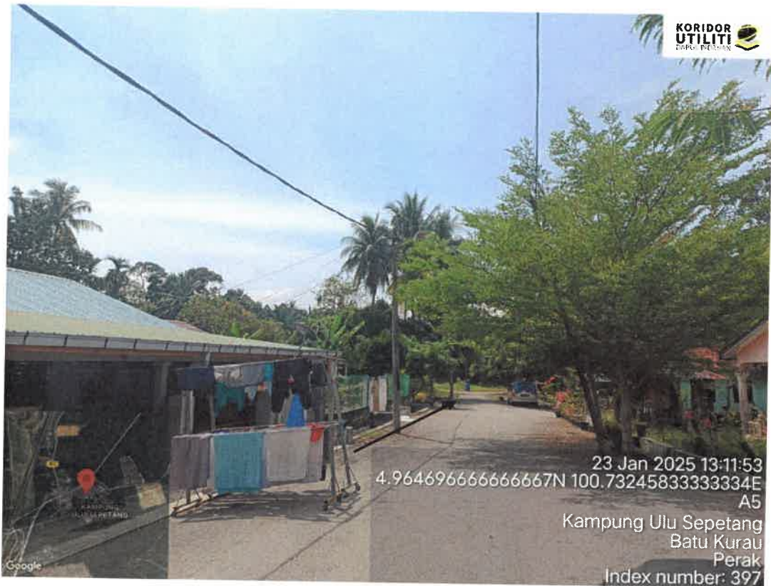
CADANGAN LALUAN – PENANAMAN TIANG

23 Jan 2025 13:11:53 4.964696666666667N 100.73245833333334E A5 Kampung Ulu Sepetang Batu Kurau Perak Index number: 397