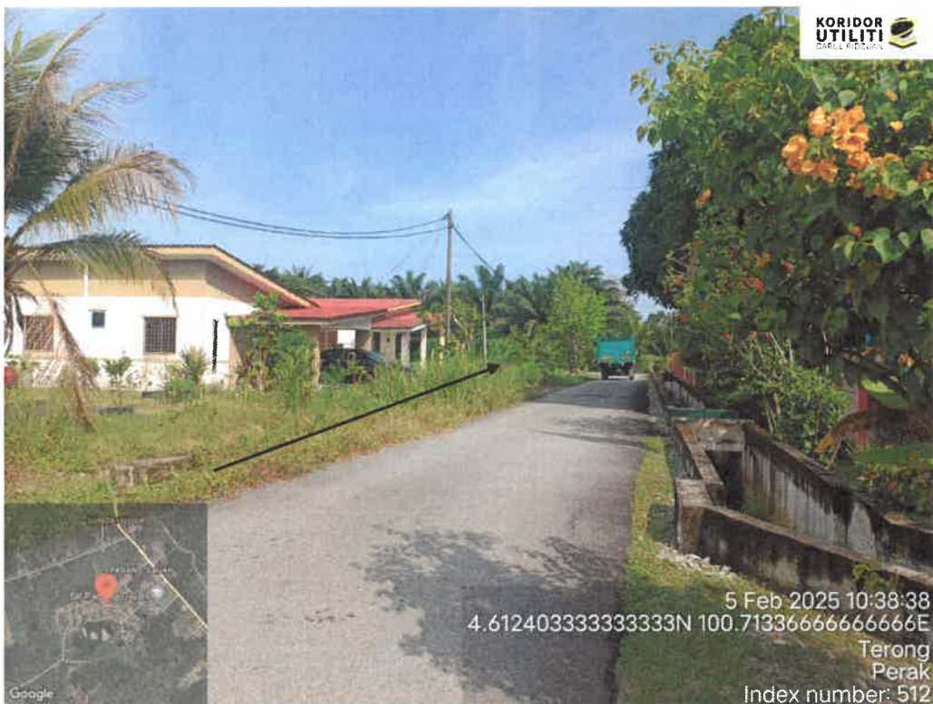
CADANGAN LALUAN PENANAMAN TIANG

5 Feb 2025 10:34:05 4.613655N 100.71606500000001E Jalan Utama Padang Gajah Terong Perak Index number: 506