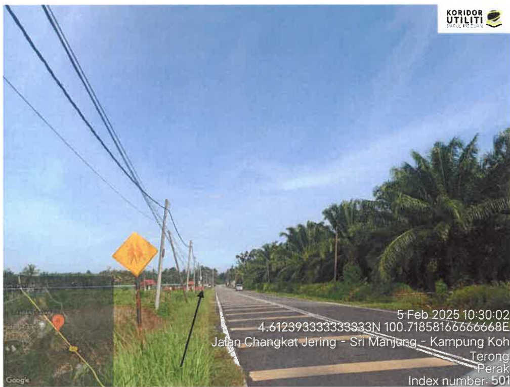
LALUAN CADANGAN PENANAMAN TIANG