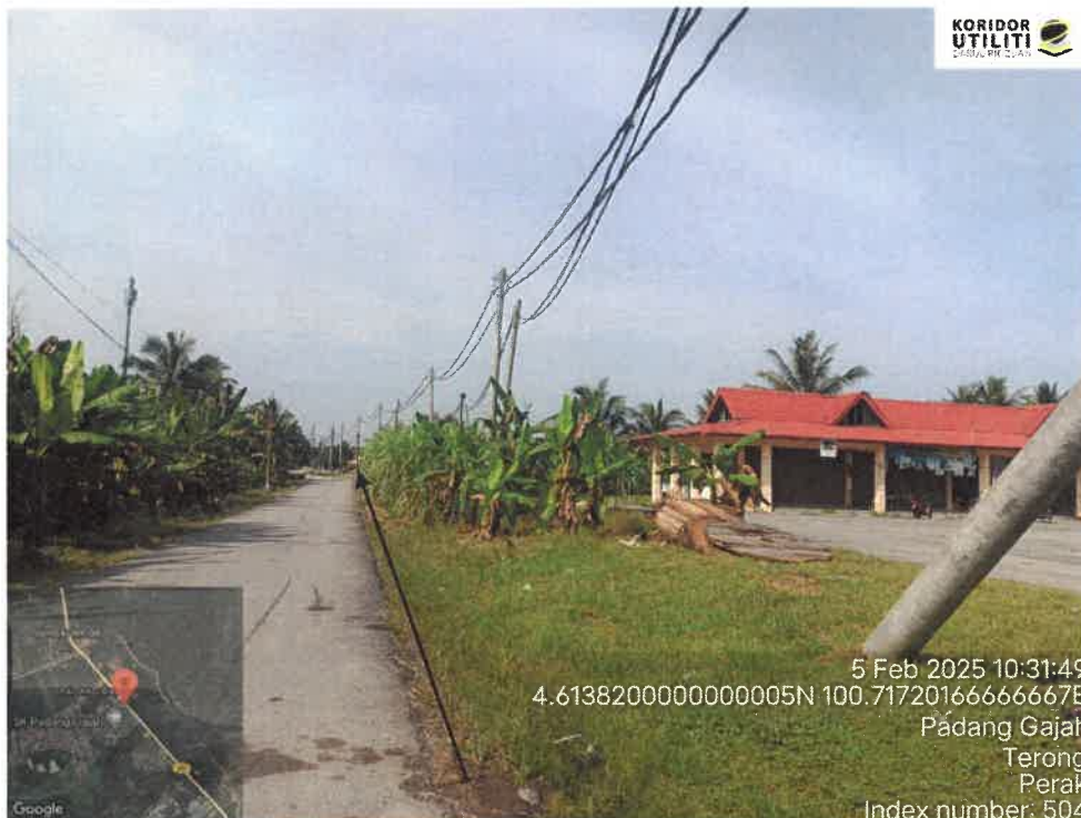
JALAN UTAMA – PEJABAT DAERAH TANAH LMS

5 Feb 2025 10:31:49 4.613820000000005N 100.71720166666667E Padang Gajah Terong Perak Index number: 504