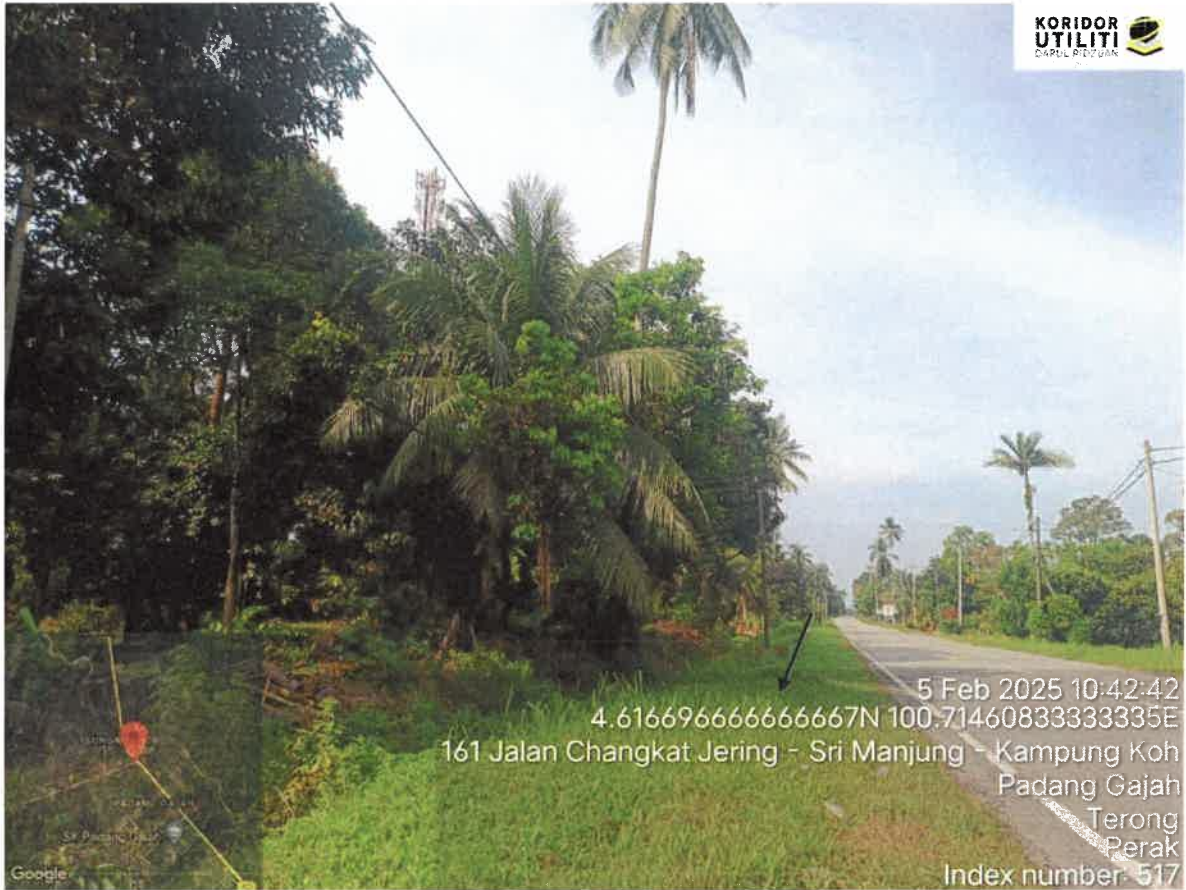
CADANGAN LALUAN PENANAMAN TIANG