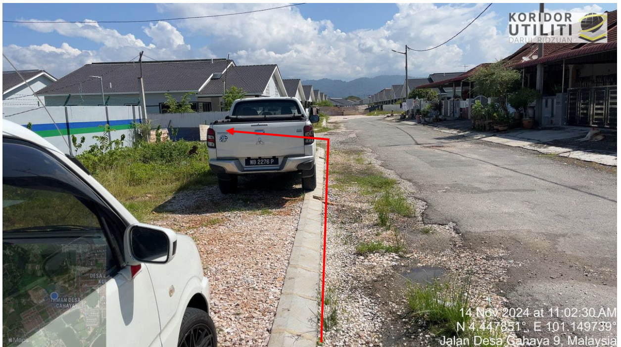
Jalan Desa Cahaya 9