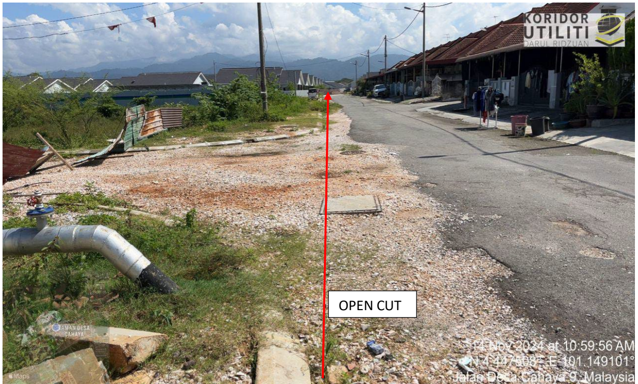
Jalan Desa Cahaya 9