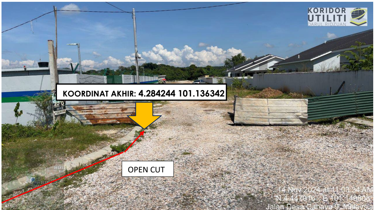
KOORDINAT AKHIR: 4.284244 101.136342