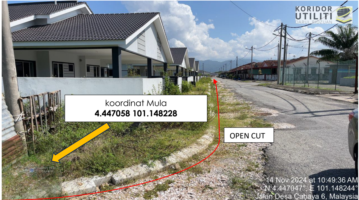
Jalan Desa Cahaya 6