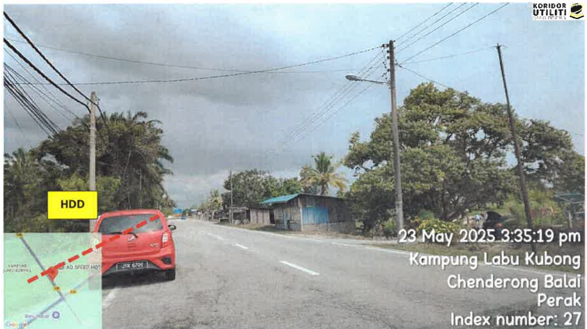
JALAN BOTA KANAN – KG GAJAH – TELUK INTAN (109)