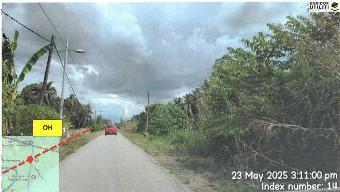
CADANGAN LALUAN PENANAMAN TIANG