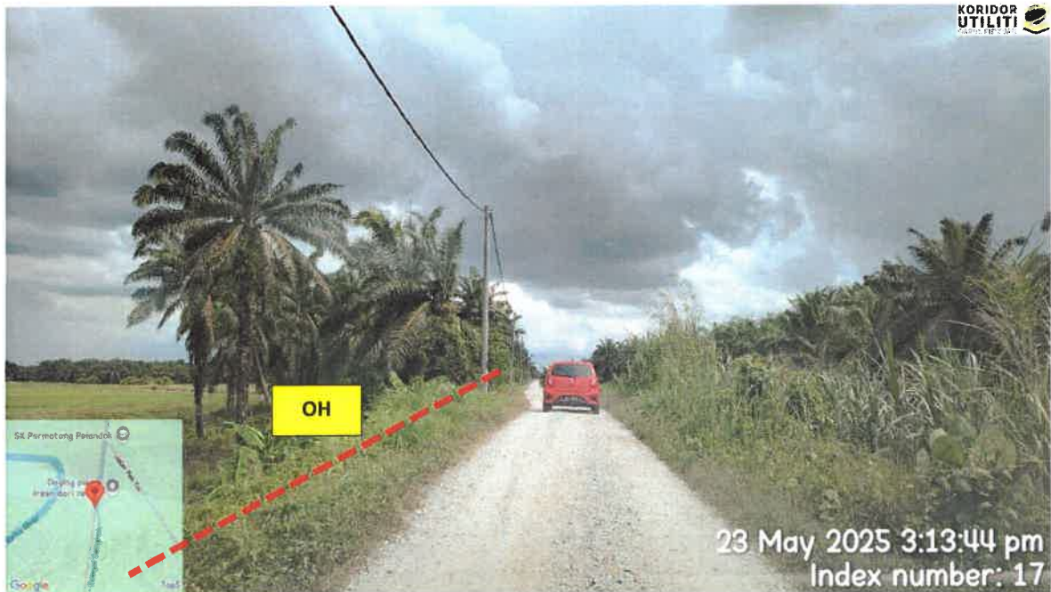
CADANGAN LALUAN PENANAMAN TIANG