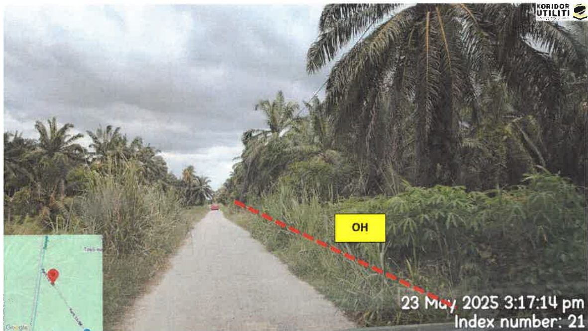
CADANGAN LALUAN PENANAMAN TIANG