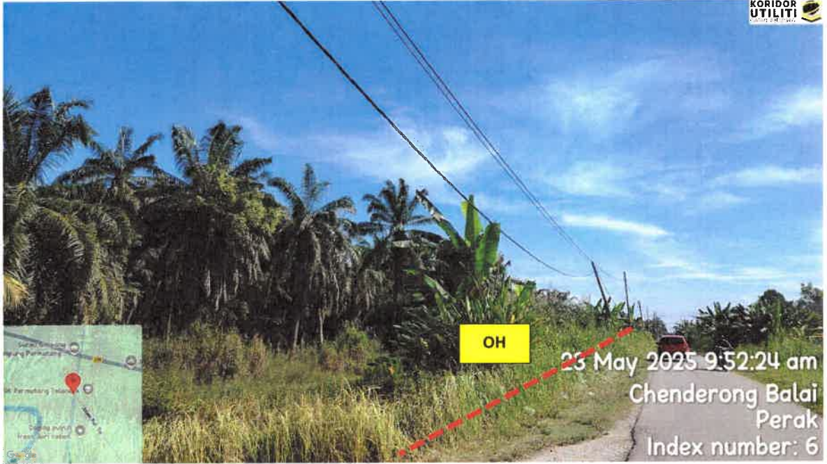
CADANGAN LALUAN PENANAMAN TIANG