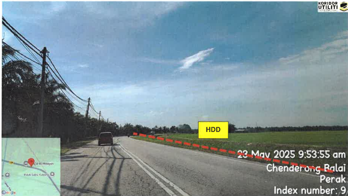
JALAN BOTA KANAN – KG GAJAH – TELUK INTAN (109)