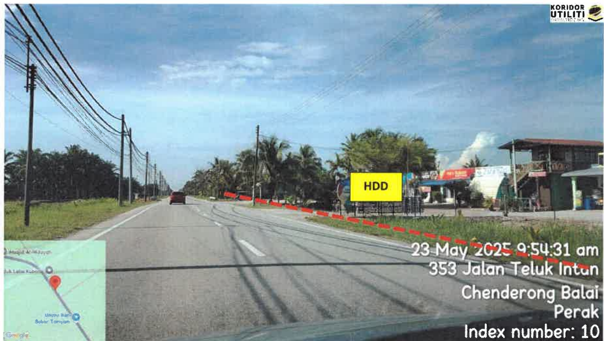
JALAN BOTA KANAN – KG GAJAH – TELUK INTAN (109)