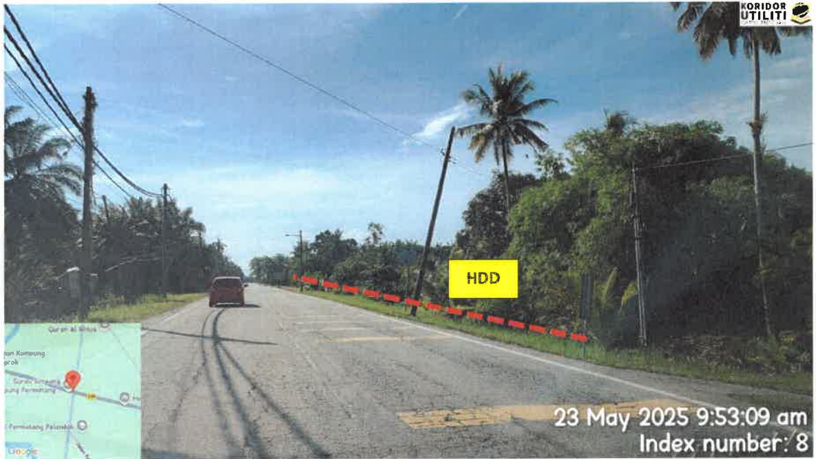
JALAN BOTA KANAN – KG GAJAH – TELUK INTAN (109)