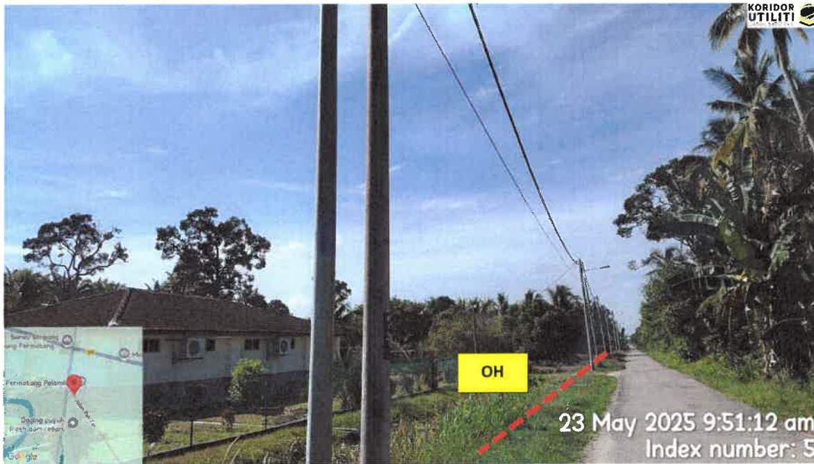
CADANGAN LALUAN PENANAMAN TIANG