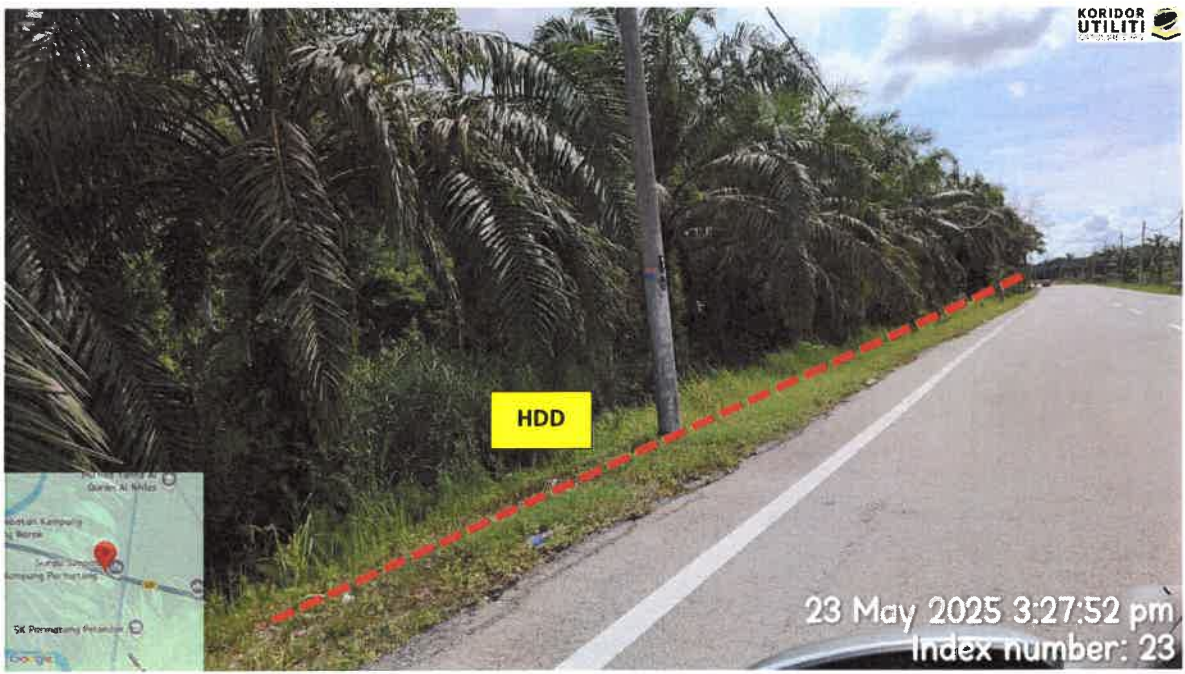
CADANGAN LALUAN BAGI KERJA HDD