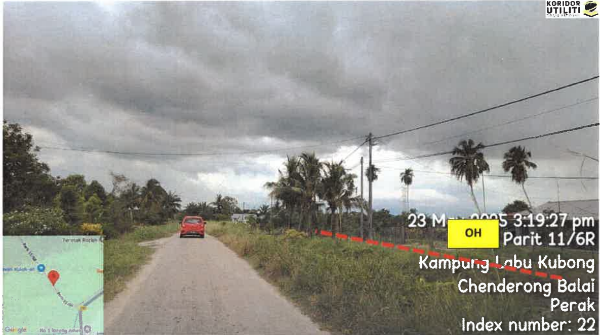
CADANGAN LALUAN PENANAMAN TIANG