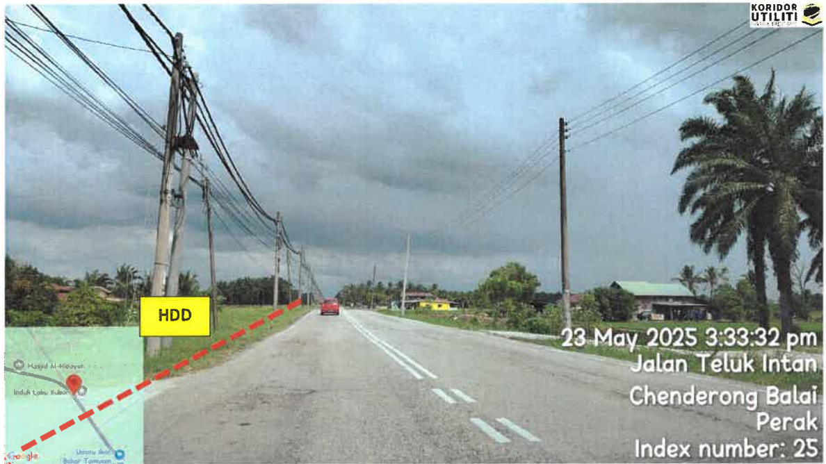
CADANGAN LALUAN BAGI KERJA HDD