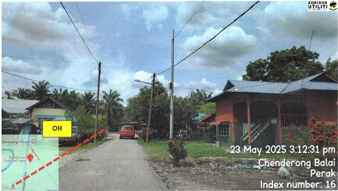
CADANGAN LALUAN PENANAMAN TIANG