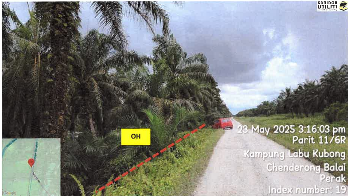
CADANGAN LALUAN PENANAMAN TIANG