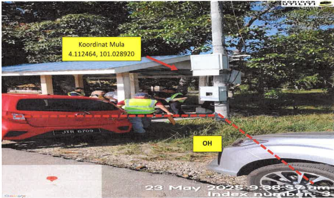
CADANGAN LALUAN PENANAMAN TIANG