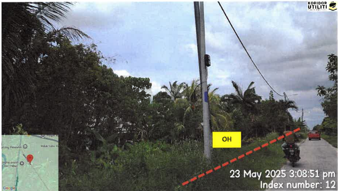
CADANGAN LALUAN PENANAMAN TIANG