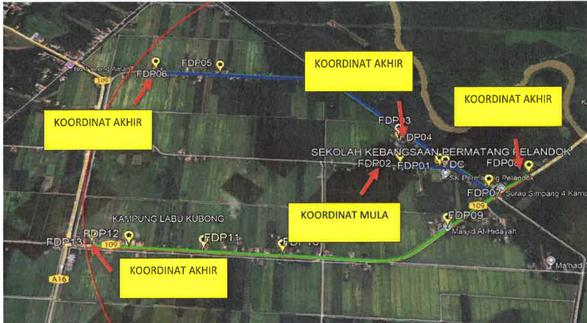
Jumlah Jarak: 6581-Meter

Koordinat Mula: 4.112464, 101.028920 Koordinat Akhir: 4.109364, 101.028948 Koordinat Akhir: 4.117015, 101.26171 Koordinat Akhir: 4.099494, 101.046878 Koordinat Akhir: 4.092513, 101.033783