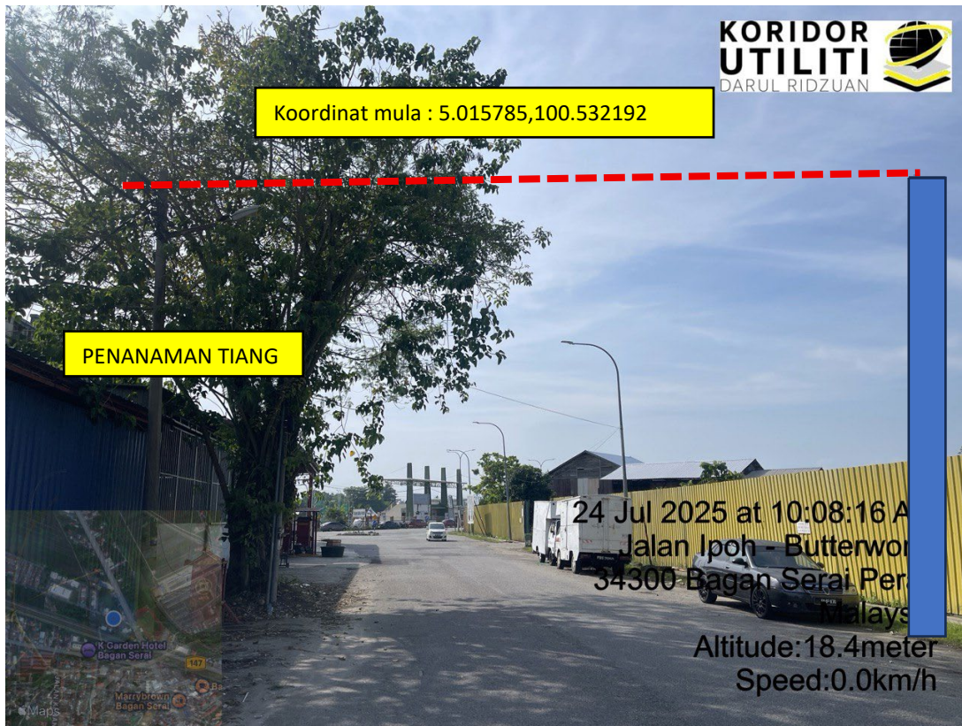
LOKASI DI JALAN SERAI MUDA 7