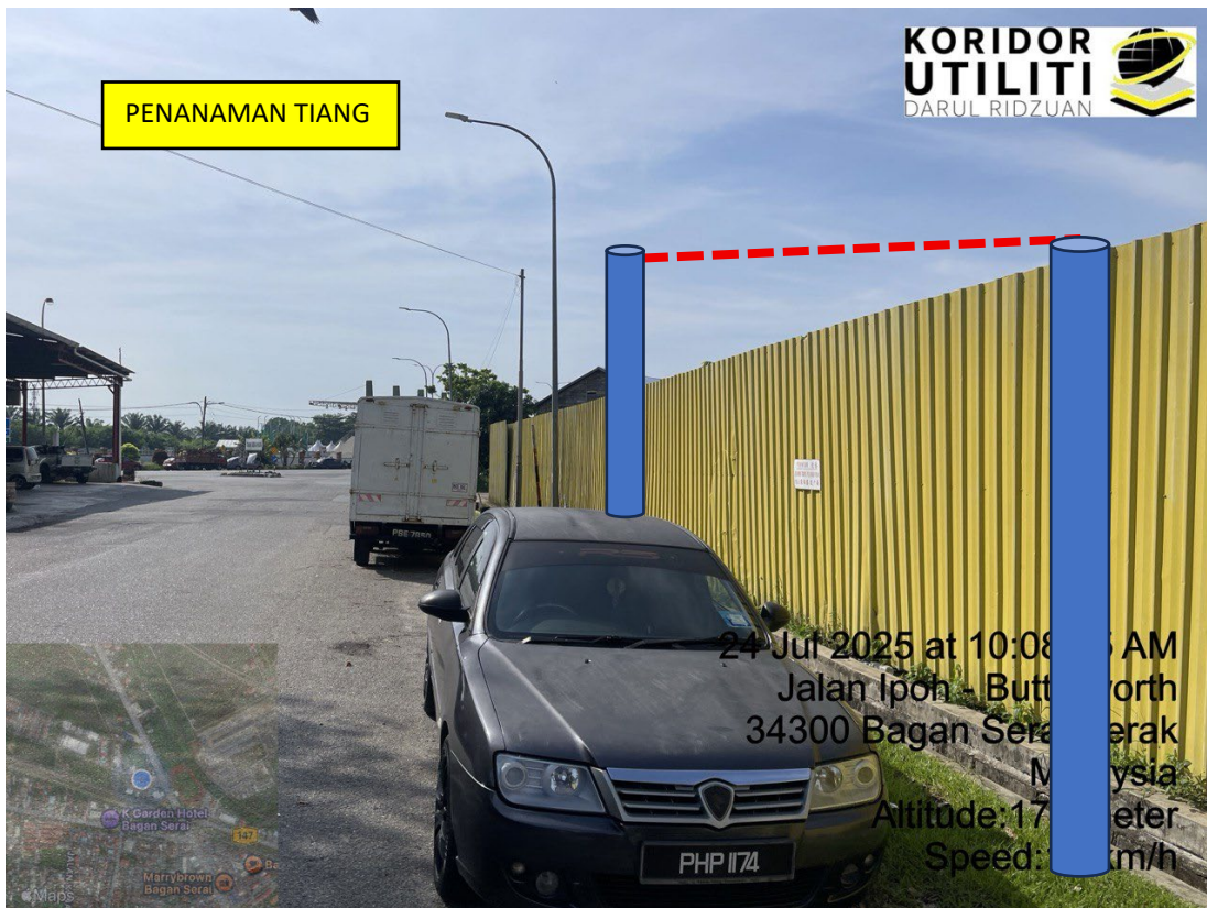
LOKASI DI JALAN SERAI MUDA 7