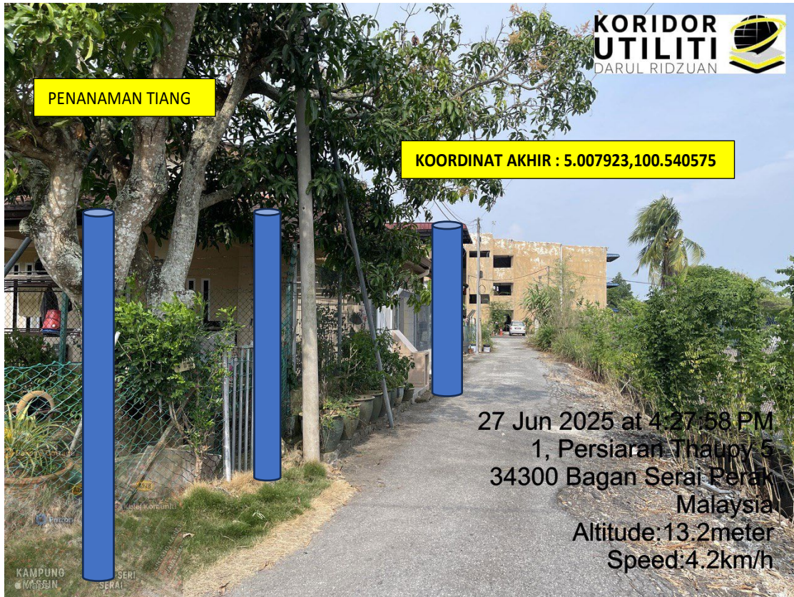
LOKASI DI JALAN BALIK KE PUSAT BANDAR