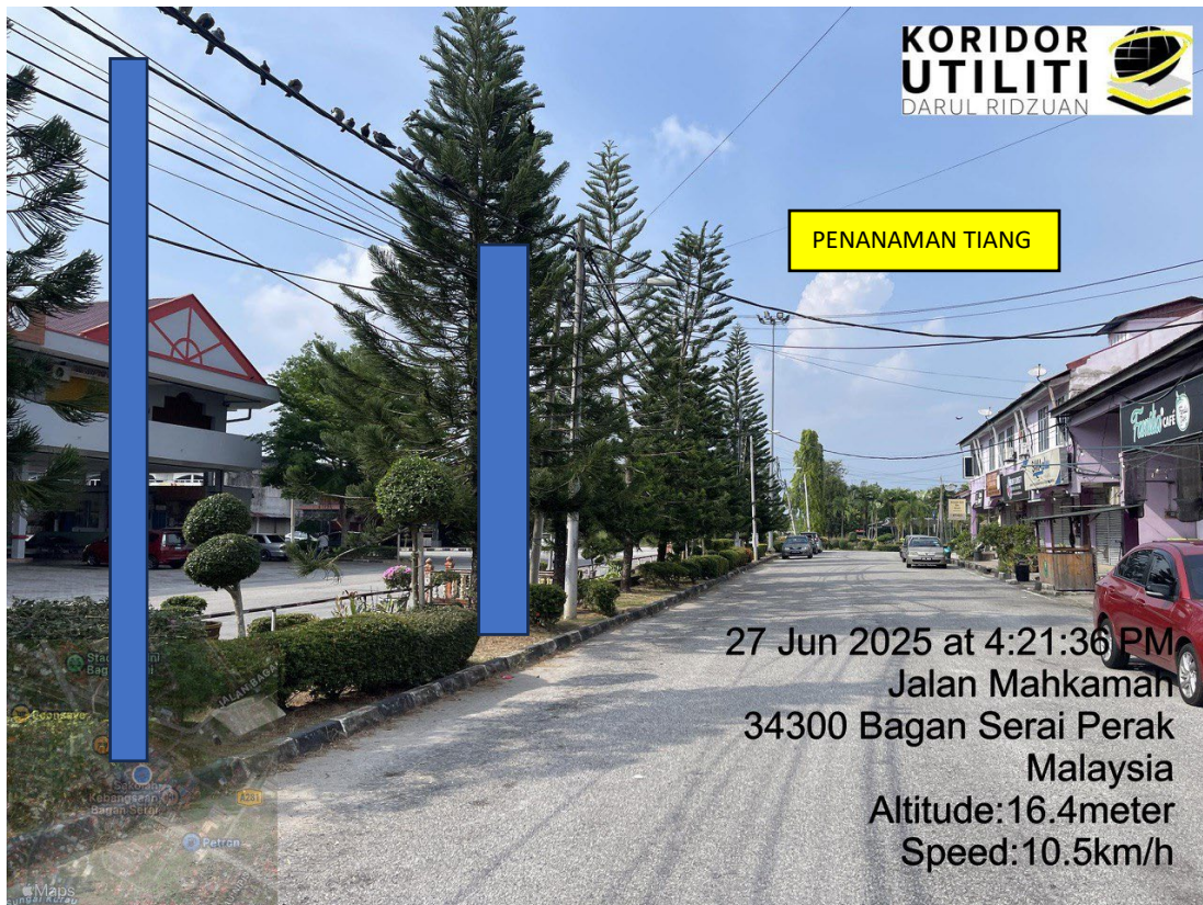
LOKASI DI JALAN BALIK KE PUSAT BANDAR