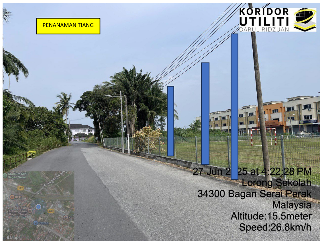
LOKASI DI JALAN BALIK KE PUSAT BANDAR