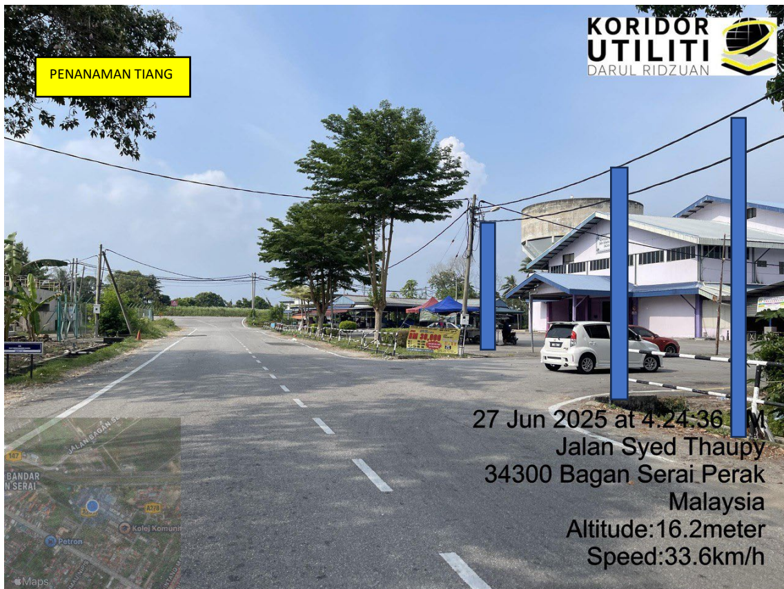
LOKASI DI JALAN RAJA SYED TAUPY BAGAN SERAI