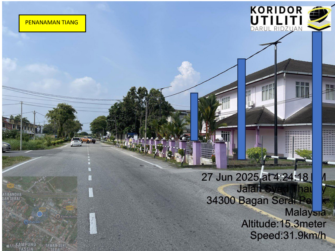
LOKASI DI JALAN RAJA SYED TAUPY BAGAN SERAI