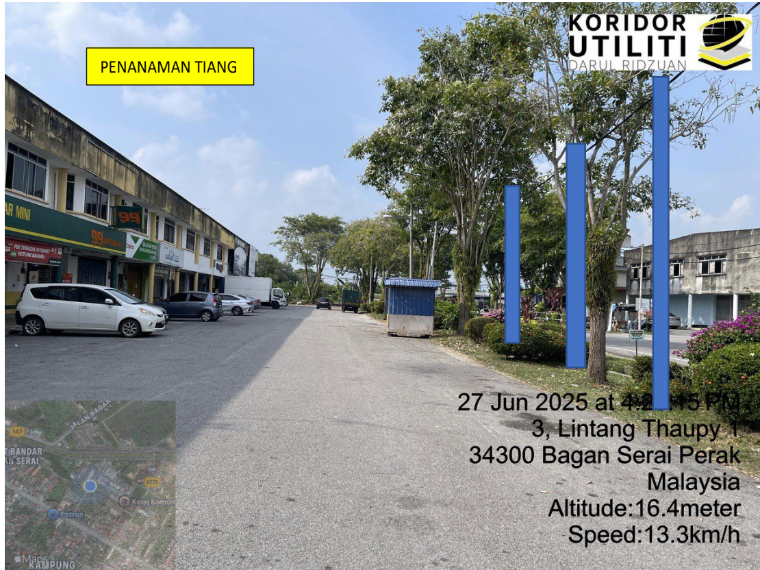
LOKASI DI JALAN RAJA SYED TAUPY