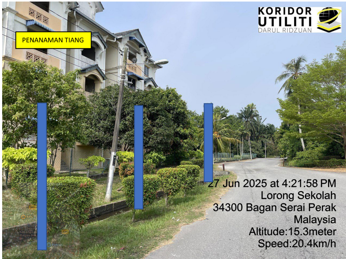
LOKASI DI JALAN BALIK KE PUSAT BANDAR