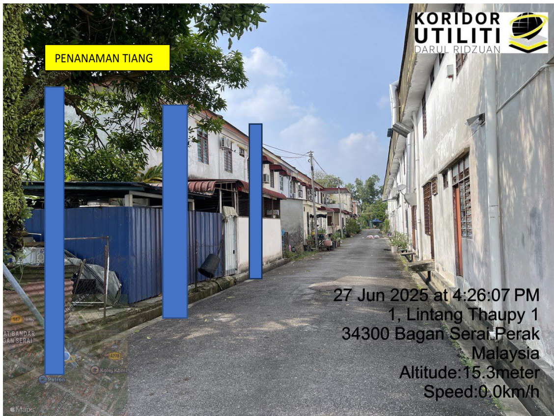
LOKASI DI JALAN TAMAN TAUPY