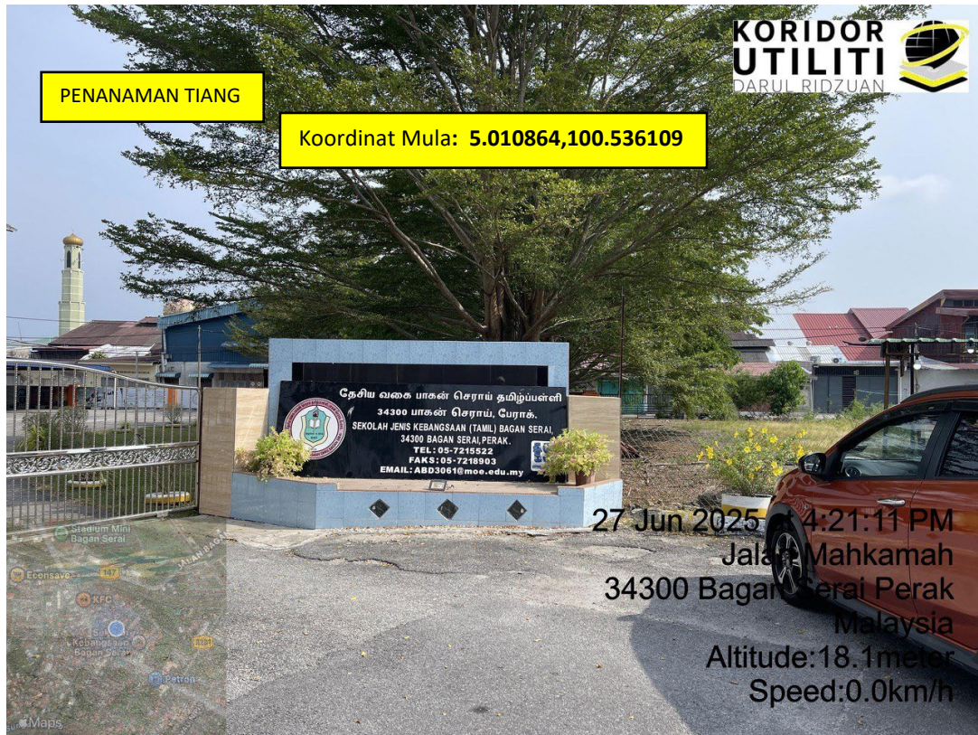
LOKASI DI JALAN BALIK KE PUSAT BANDAR