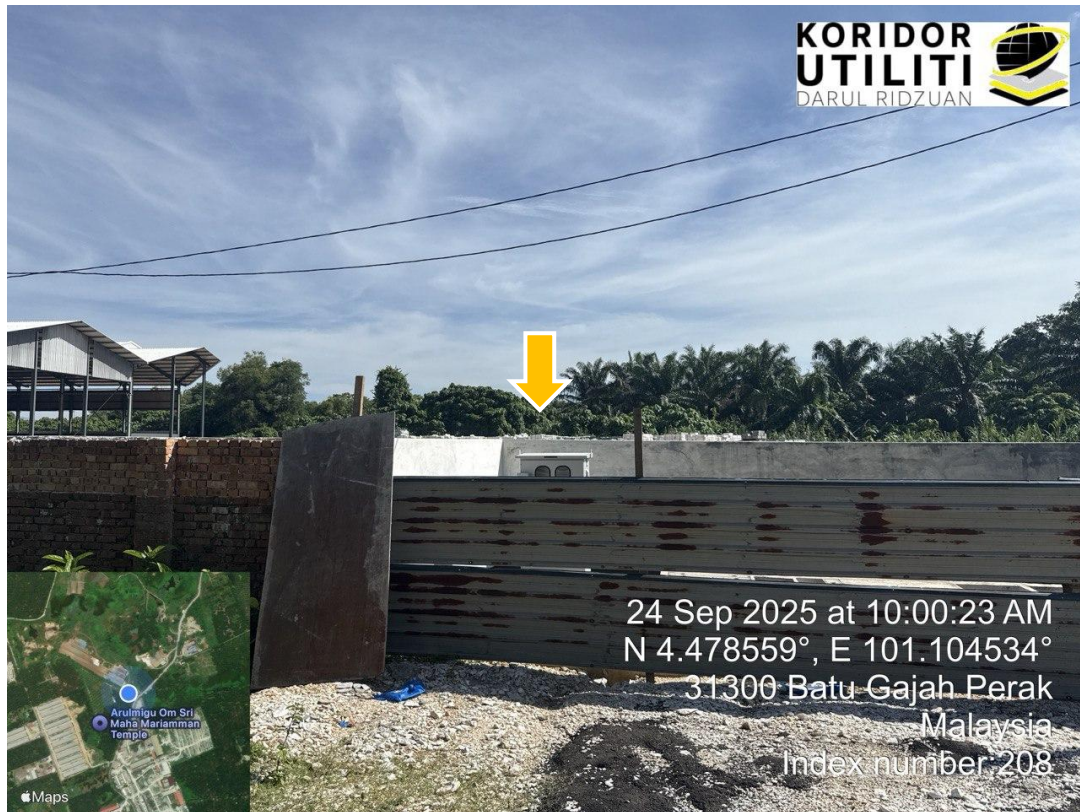
PROPOSED COMPACT SUB