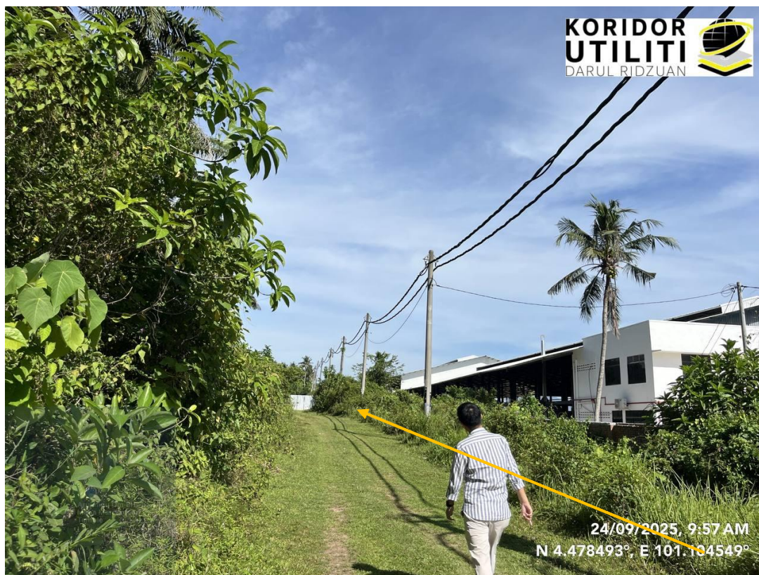
KOREKAN TERBUKA DI JALAN TIDAK BERTURAP