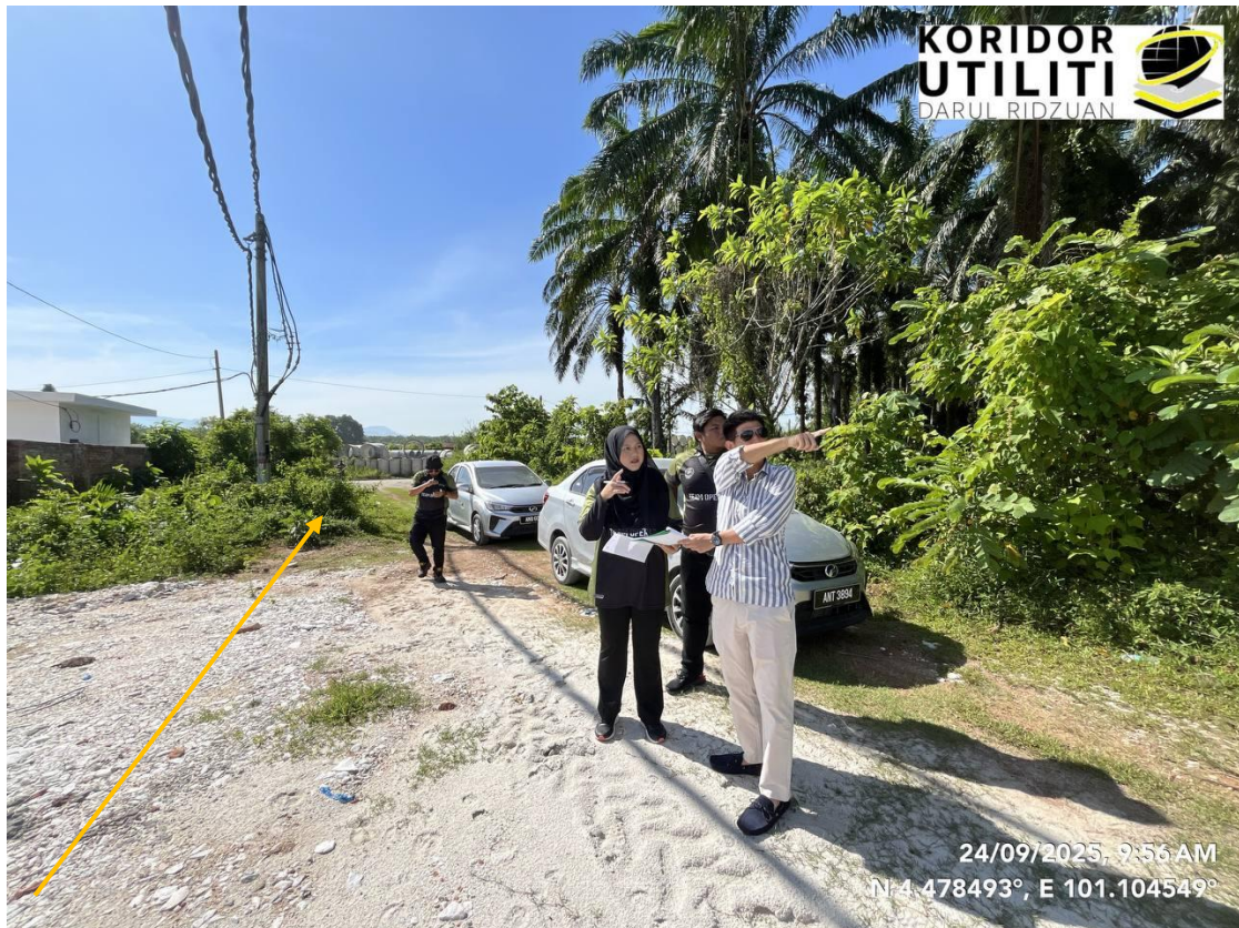
PEMERIKSAAN TAPAK BERSAMA PEMOHON