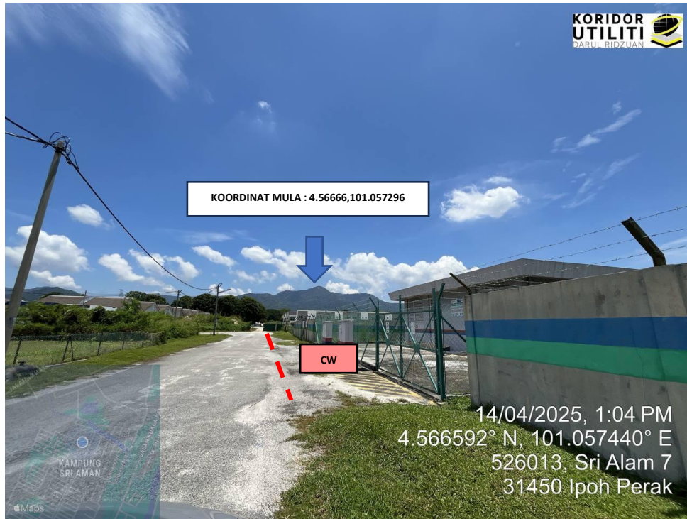
LOKASI KOORDINAT MULA KOREKAN TERBUKA DI SRI AMAN 7