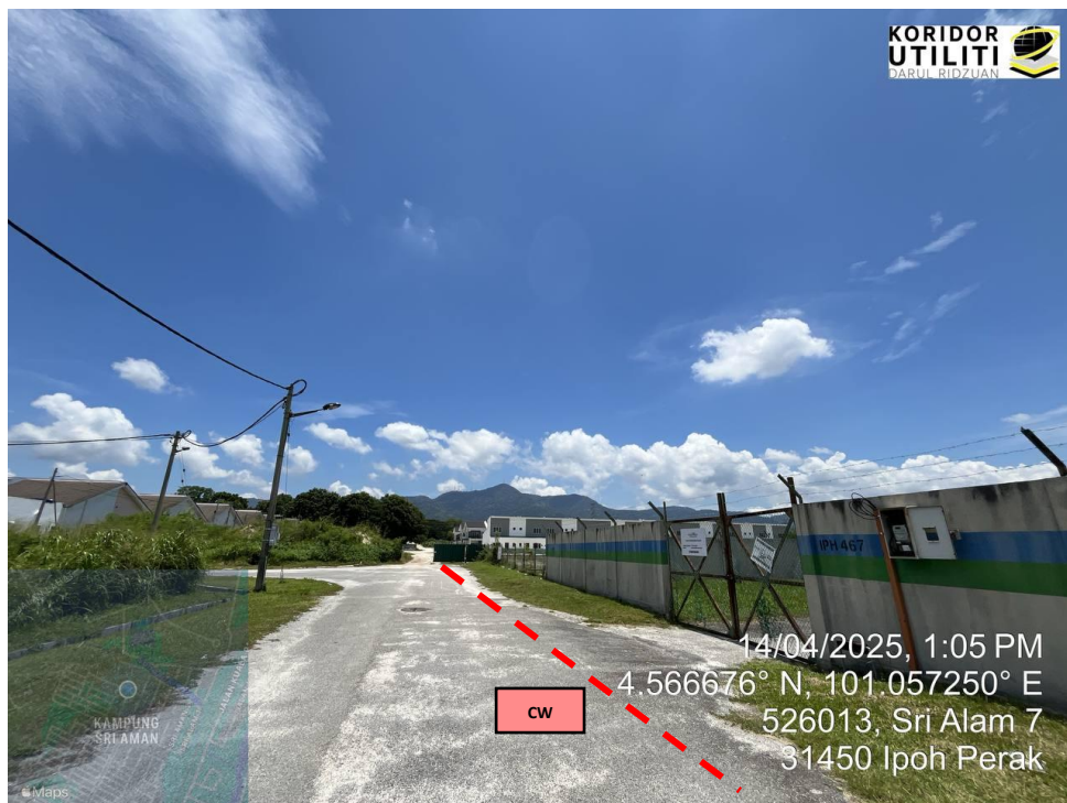
AJARAN KOREKAN TERBUKA DI SRI AMAN 7