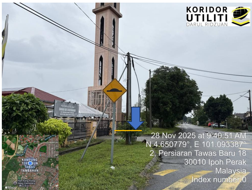
KOORDINAT AKHIR – CADANGAN MANHOLE BARU MAXIS ANGGARAN 7 METER MICROTRENCHING