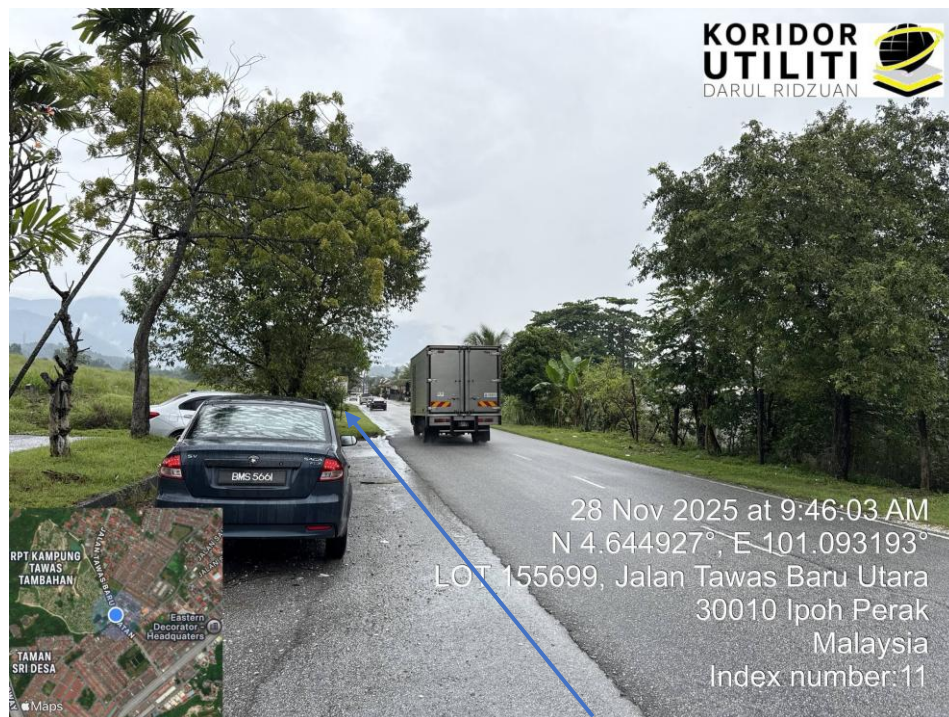
JAJARAN BAGI KERJA HDD