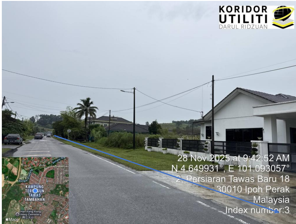
AJARAN PEMASANGAN UTILITI – KAEDAH HDD