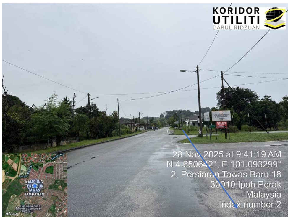
AJARAN PEMASANGAN UTILITI – KAEDAH HDD