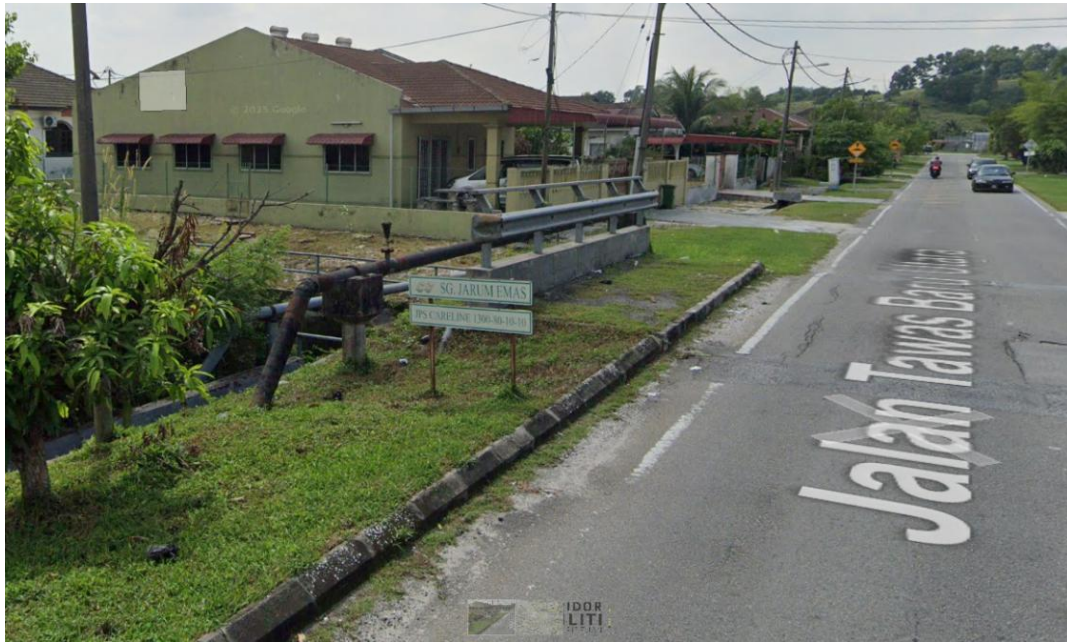
KAEDAH HDD DI SUNGAI JARUM EMAS – JPS KINTA