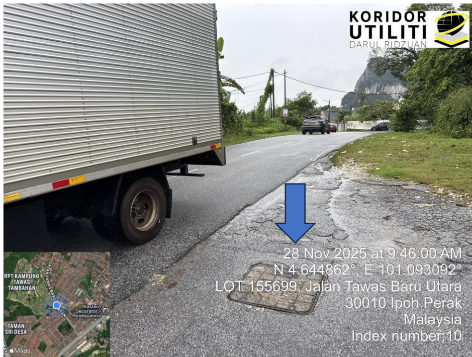
MANHOLE MAXIS SEDIA ADA – KOORDINAT MULA