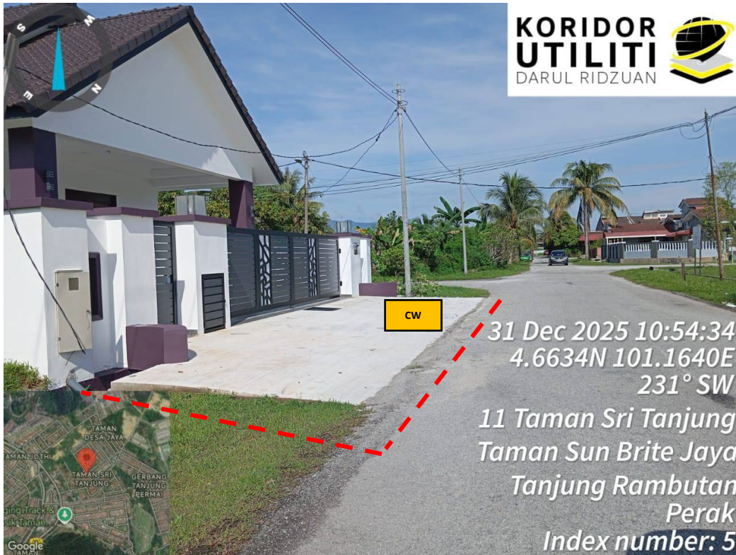
JAJARAN KOREKAN TERBUKA DI TAMAN SRI TANJUNG