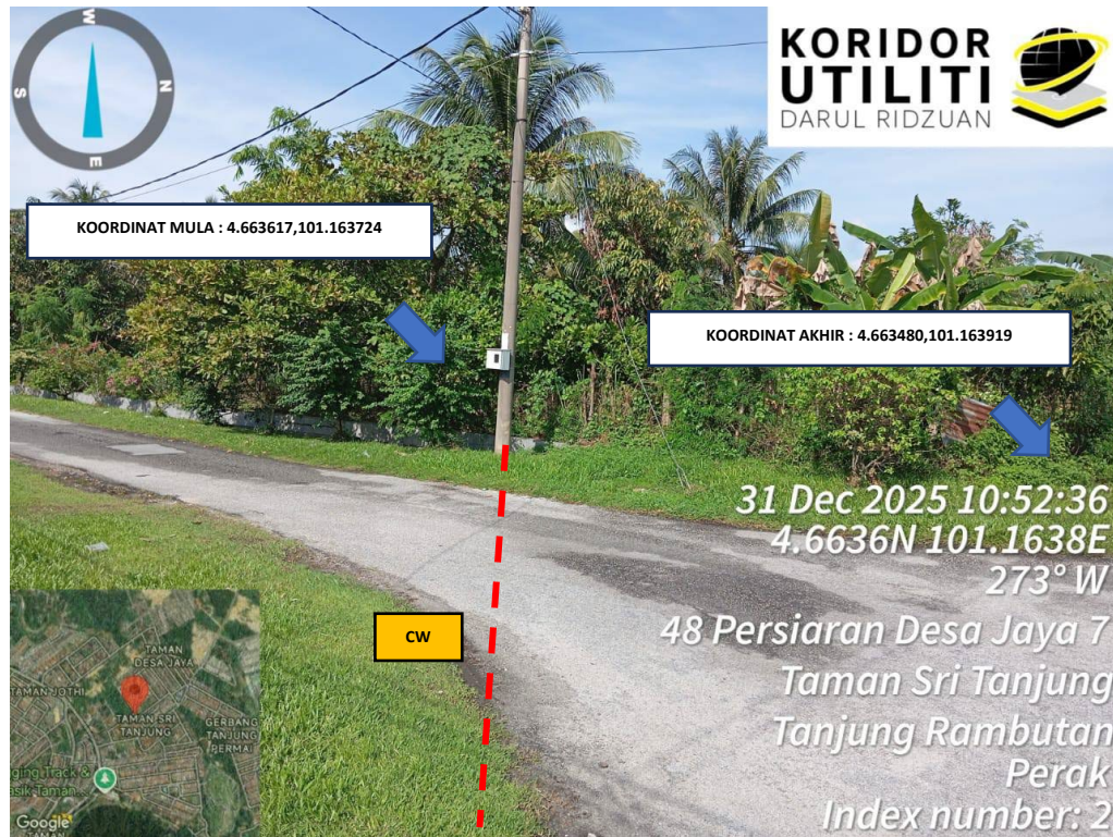
LOKASI KOORDINAT MULA KOREKAN TERBUKA DI TAMAN SRI TANJUNG