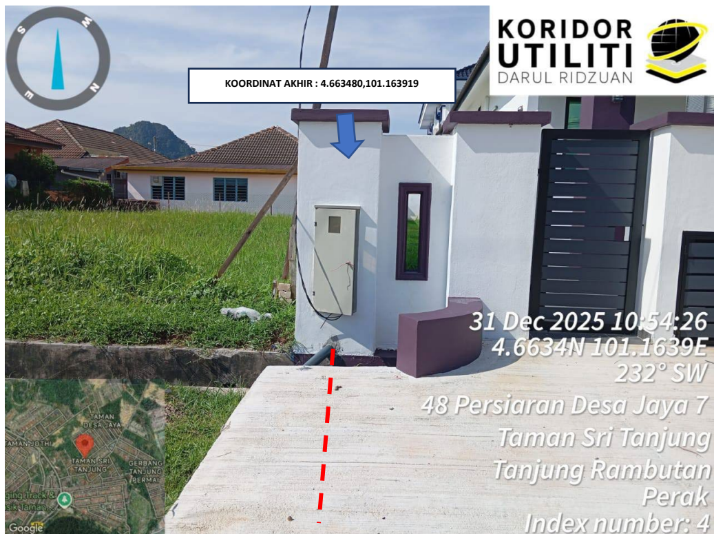
LOKASI KOORDINAT AKHIR KOREKAN TERBUKA DI TAMAN SRI TANJUNG