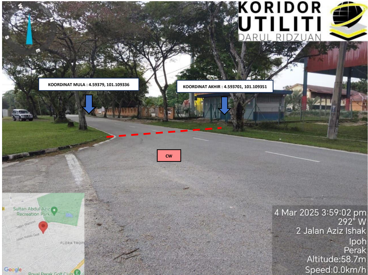
LOKASI KOORDINAT MULA DAN AKHIR KOREKAN TERBUKA DI JALAN KELAB GOLF