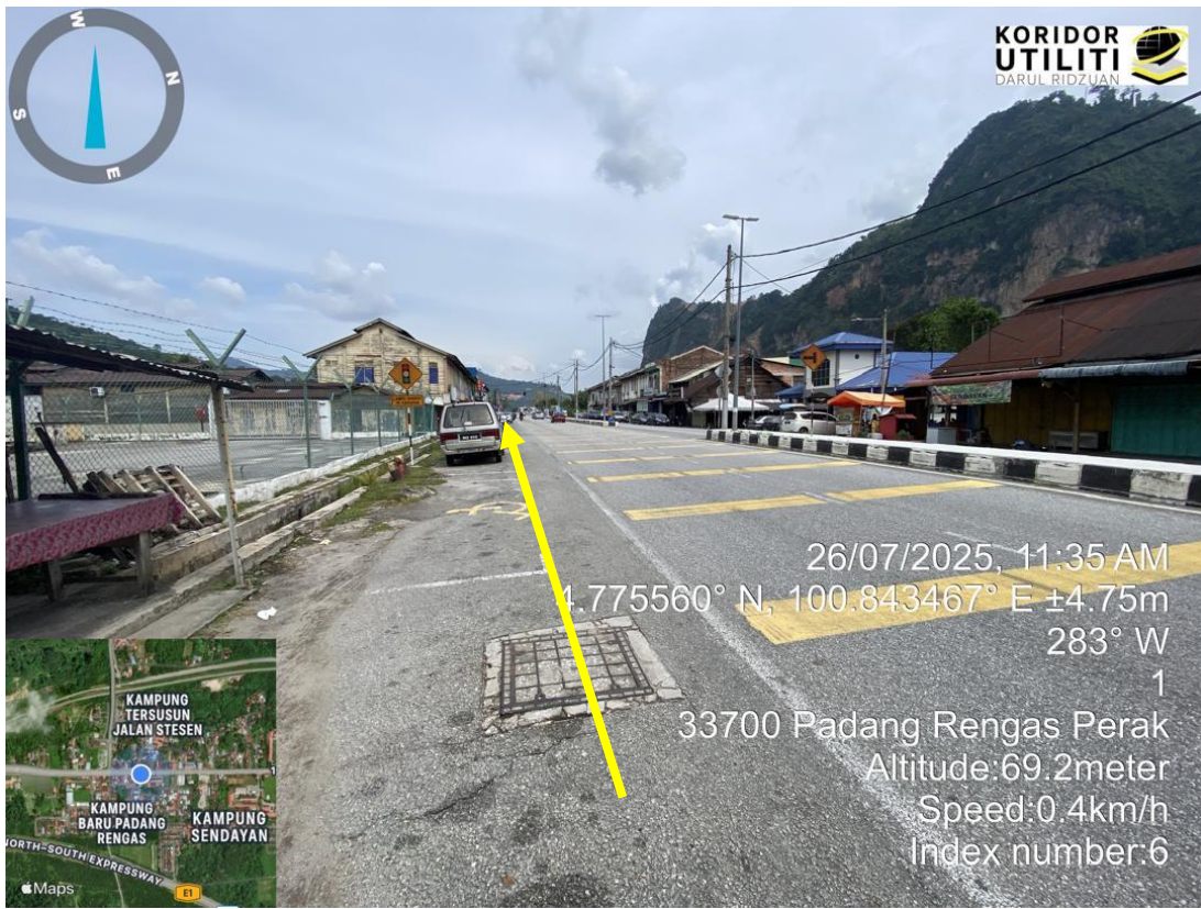
CADANGAN HDD DAN CABLE PULLING