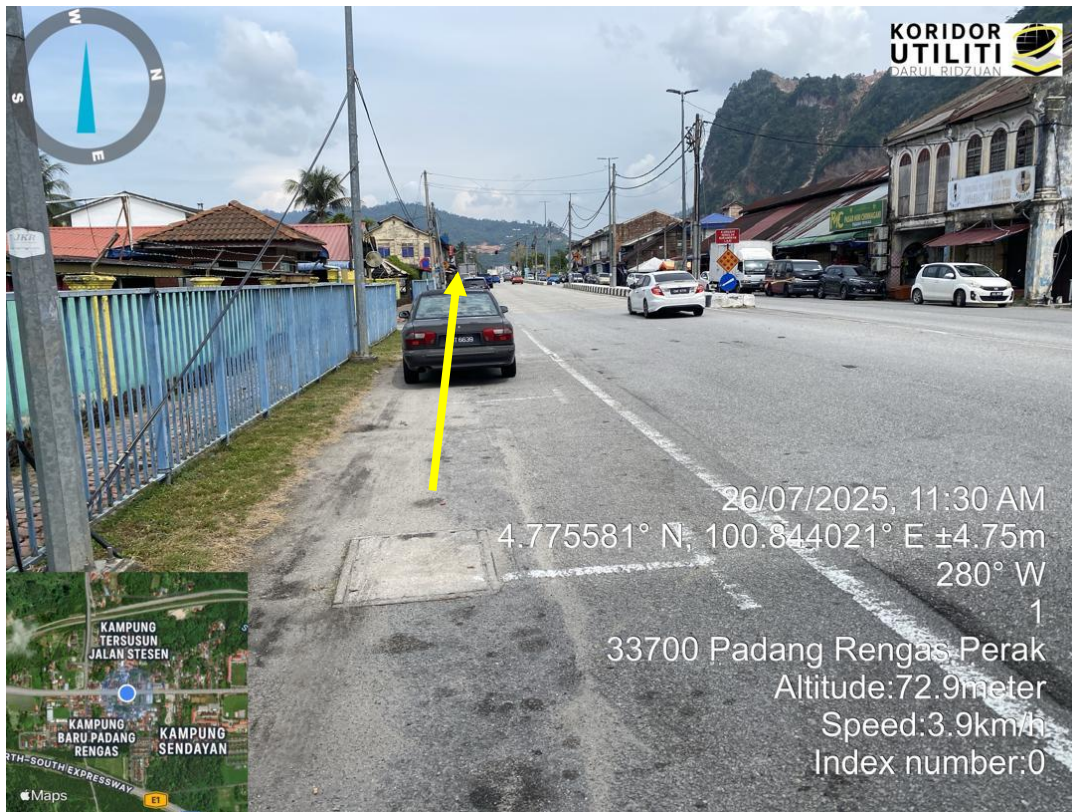
KOORDINAT MULA – TERDAPAT MANHOLE SEDIA ADA MENGGUNAKAN KAEDAH HDD DAN CABLE PULLING DI JALAN JKR