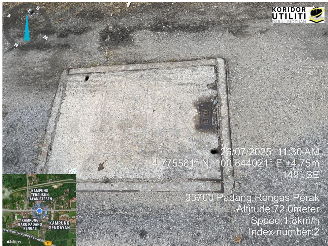
MANHOLE SEDIA ADA DALAM KEADAAN BAIK