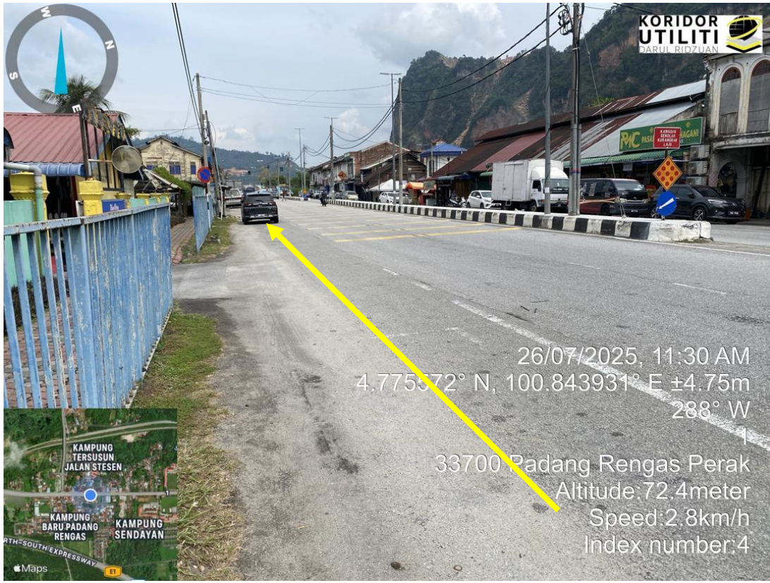
CADANGAN HDD DAN CABLE PULLING