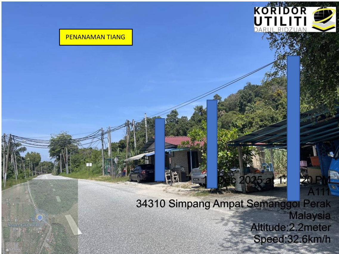
LOKASI DI JALAN SEMANGGOL – CHANGKAT LOBAK