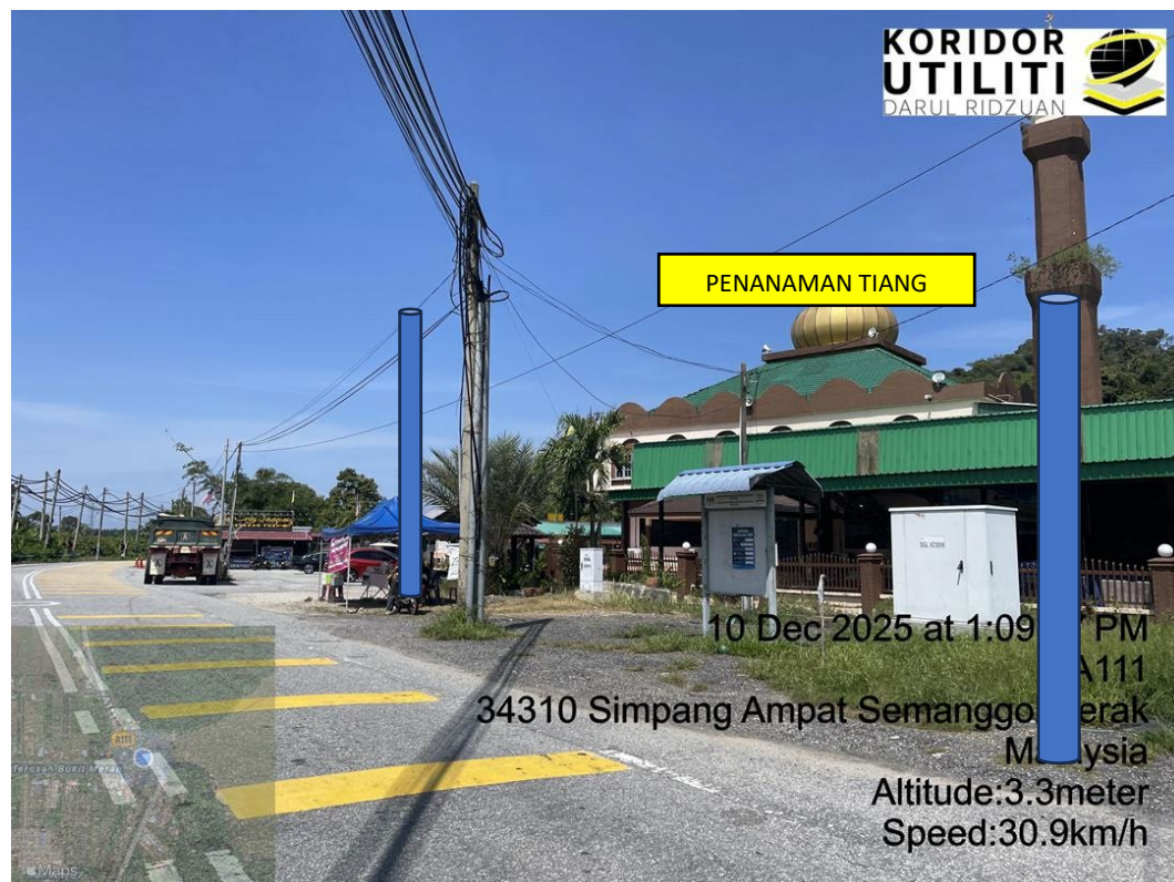
LOKASI DI JALAN SEMANGGOL – CHANGKAT LOBAK