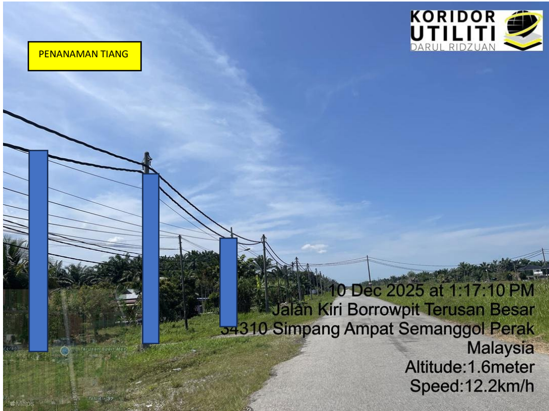
LOKASI DI JALAN KIRI BORROWPIT TERUSAN BESAR