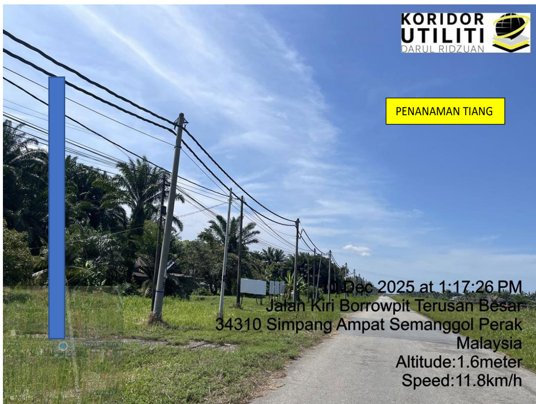
LOKASI DI JALAN KIRI BORROWPIT TERUSAN BESAR