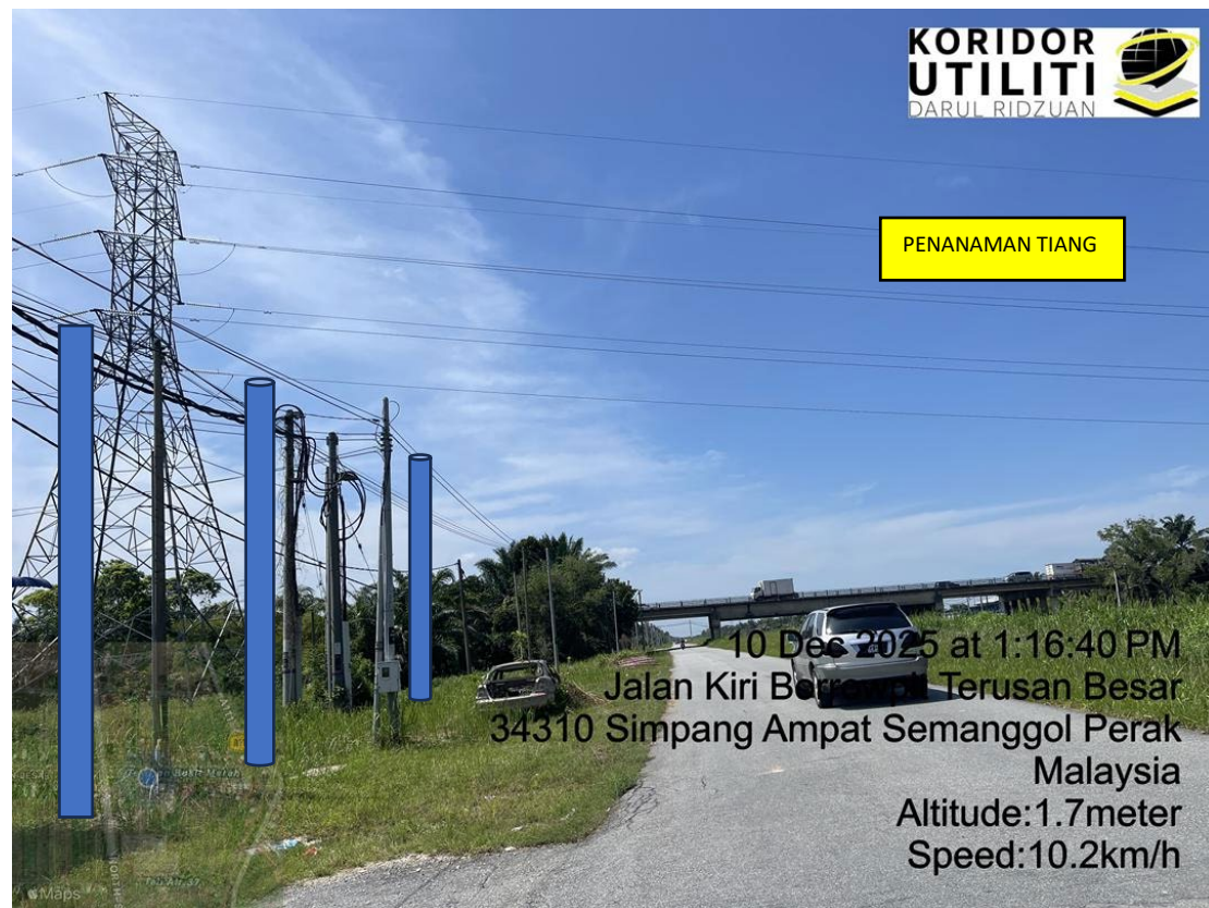
LOKASI DI JALAN KIRI BORROWPIT TERUSAN BESAR