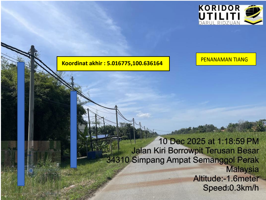
LOKASI DI JALAN KIRI BORROWPIT TERUSAN BESAR