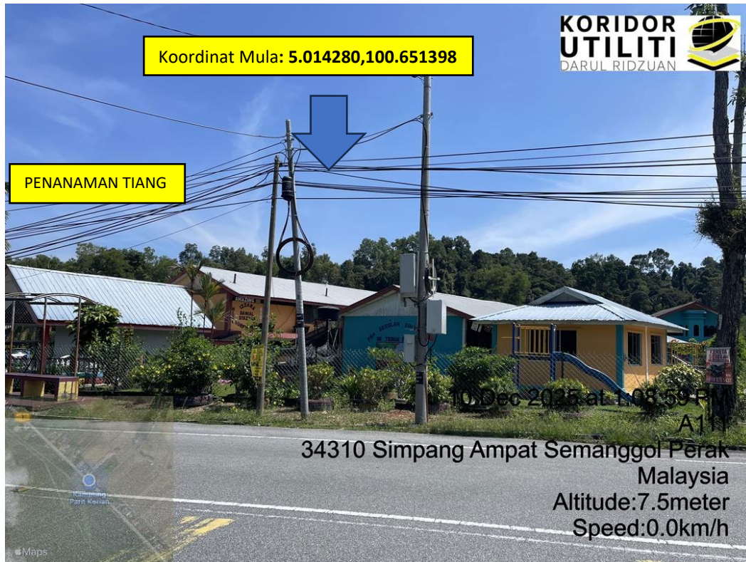
LOKASI Di JALAN SEMANGGOL- CHANGKAT LOBAK