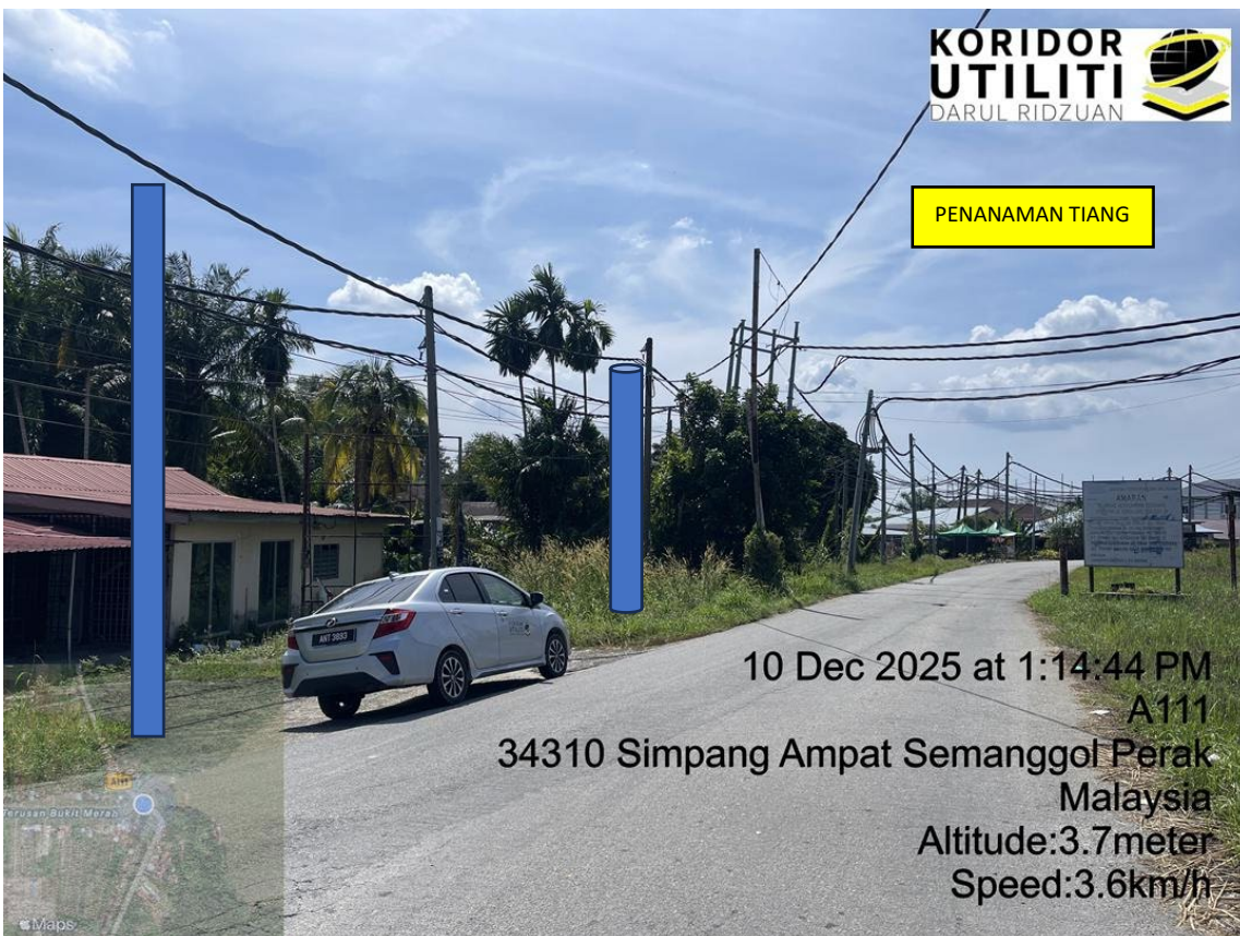
LOKASI DI JALAN KIRI BORROWPIT TERUSAN BESAR