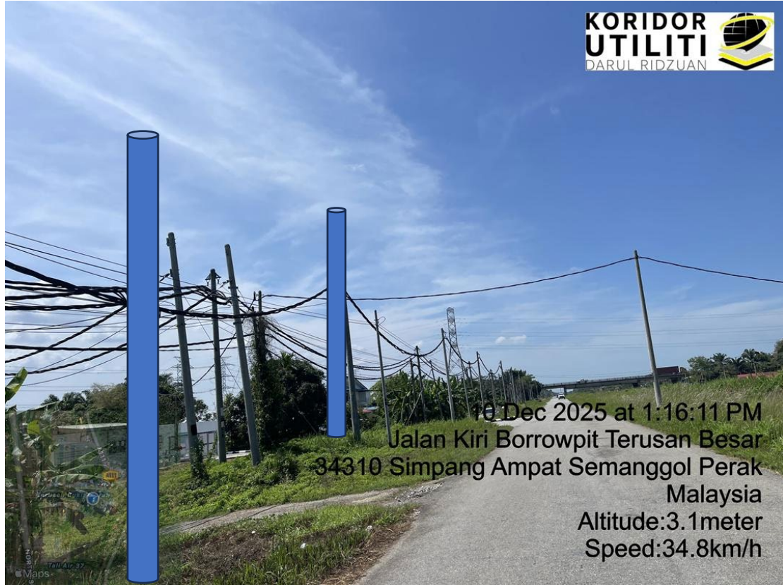
LOKASI DI JALAN KIRI BORROWPIT TERUSAN BESAR