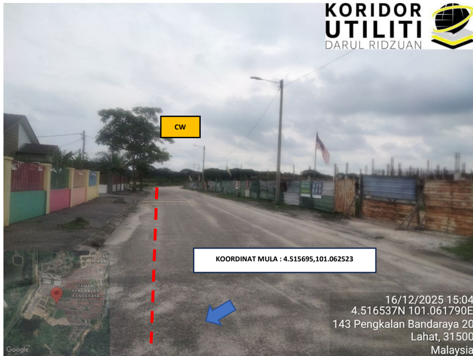
LOKASI KOORDINAT MULA KOREKAN TERBUKA DI JALAN PENGKALAN BANDARAYA 21