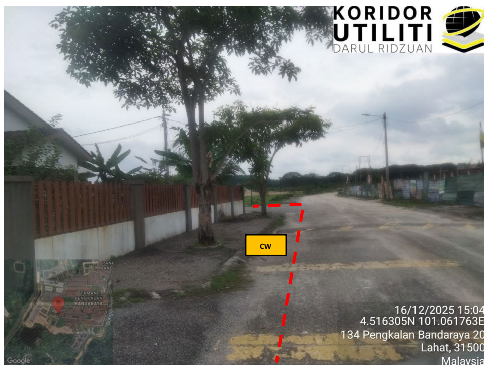
JAJARAN KOREKAN TERBUKA DI JALAN PENGKALAN BANDARAYA 21