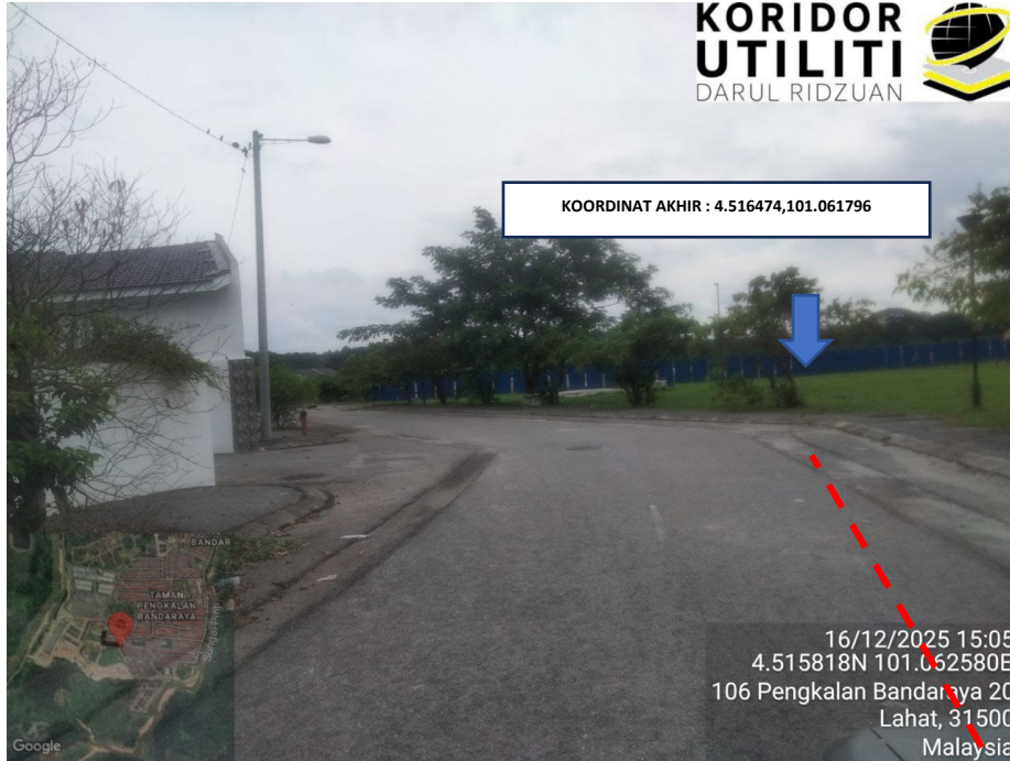
LOKASI KOORDINAT AKHIR KOREKAN TERBUKA DI JALAN PENGKALAN BANDARAYA 21