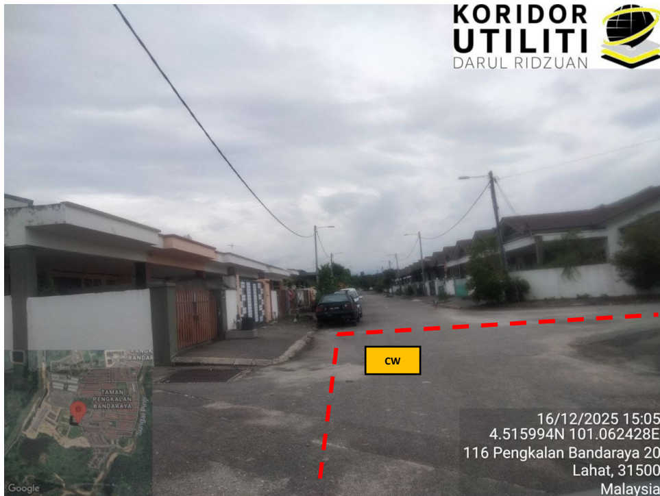
JAJARAN KOREKAN TERBUKA DI JALAN PENGKALAN BANDARAYA 21