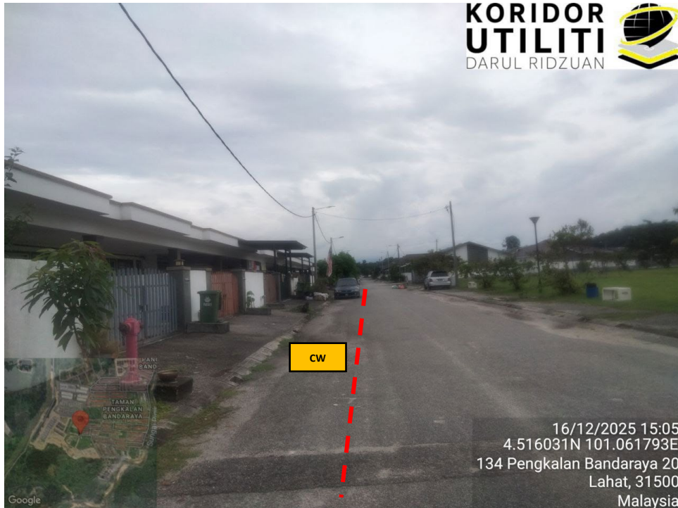
JAJARAN KOREKAN TERBUKA DI JALAN PENGKALAN BANDARAYA 21