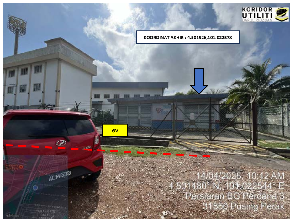
LOKASI KOORDINAT AKHIR KOREKAN TERBUKA DI PERSIARAN BG PERDANA 3