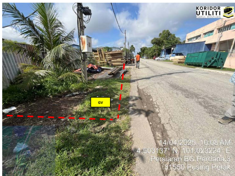
AJARAN KOREKAN TERBUKA DI PERSIARAN BG PERDANA 3