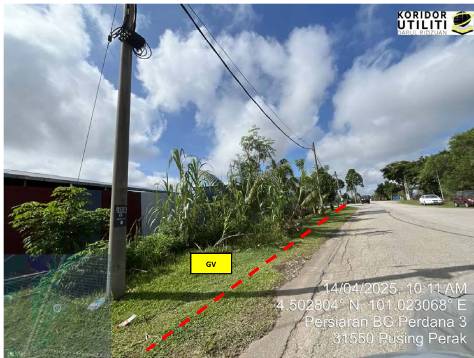
AJARAN KOREKAN TERBUKA DI PERSIARAN BG PERDANA 3