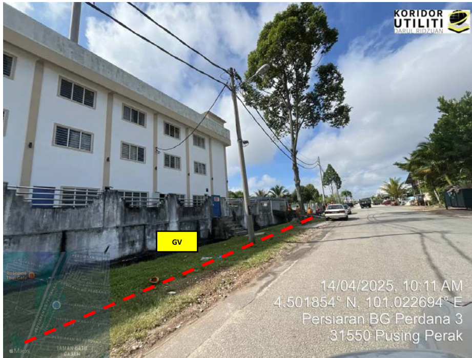
AJARAN KOREKAN TERBUKA DI PERSIARAN BG PERDANA 3