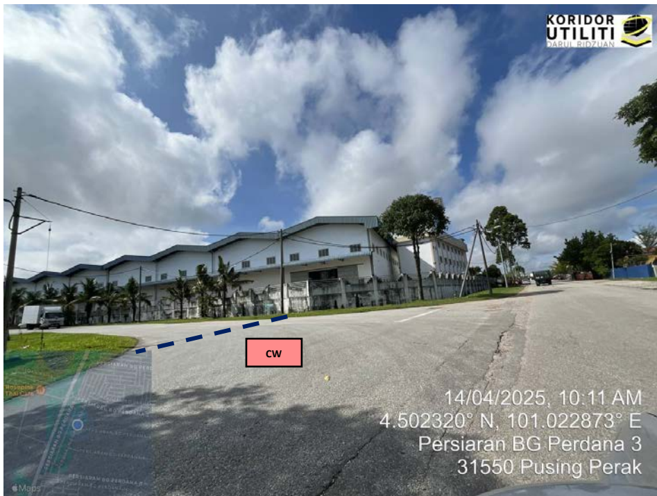
AJARAN KOREKAN TERBUKA DI PERSIARAN BG PERDANA 3