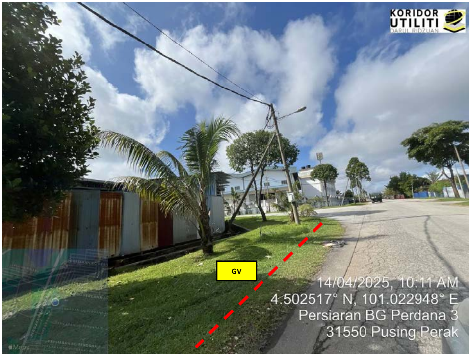
AJARAN KOREKAN TERBUKA DI PERSIARAN BG PERDANA 3