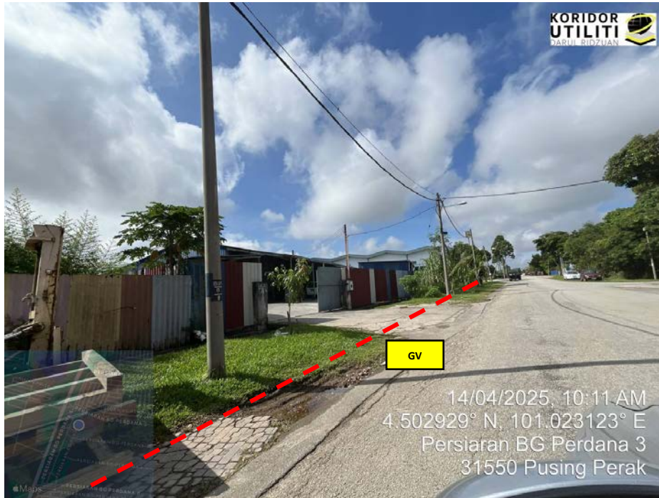
AJARAN KOREKAN TERBUKA DI PERSIARAN BG PERDANA 3