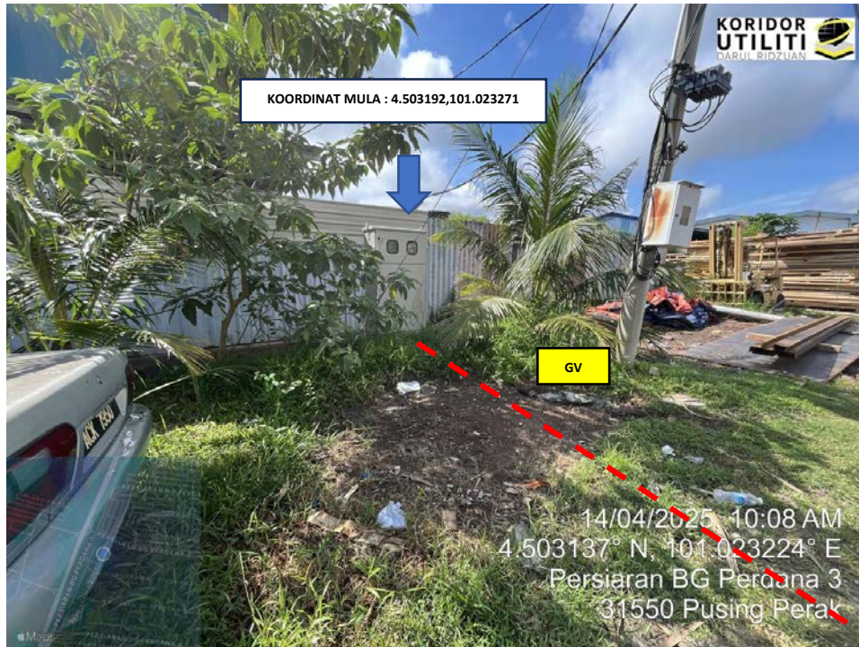
LOKASI KOORDINAT MULA KOREKAN TERBUKA DI PERSIARAN BG PERDANA 3