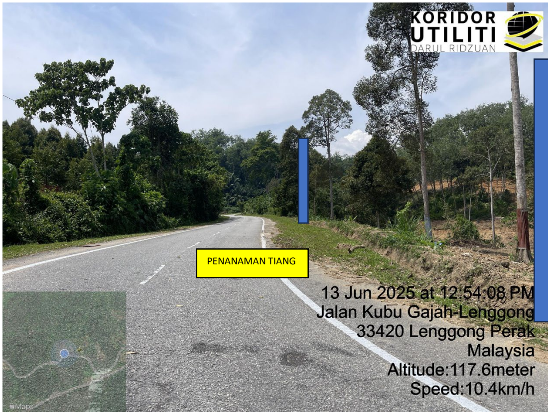
LOKASI DI JALAN KUBU GAJAH - LENGGONG