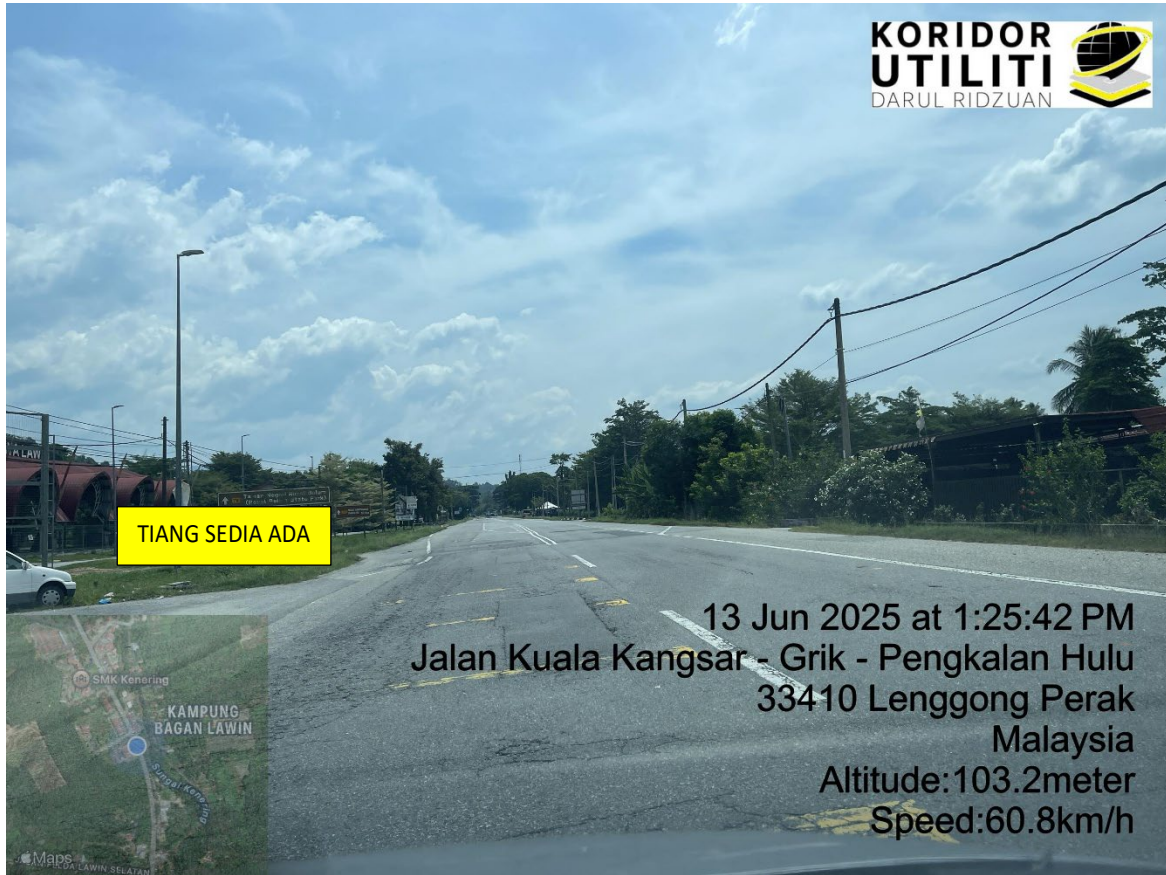
LOKASI DI JALAN KUALA KANGSAR – GRIK – PENGKALAN HULU