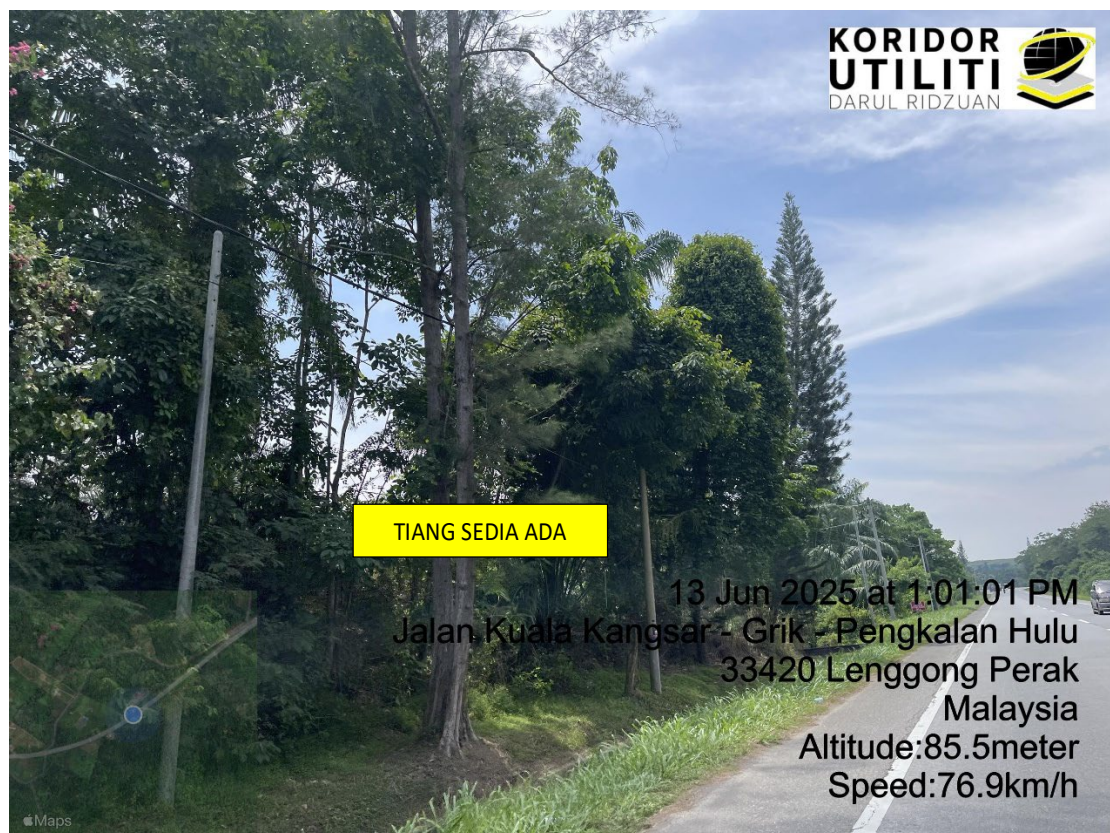
LOKASI DI JALAN KUALA KANGSAR – GRIK – PENGKALAN HULU