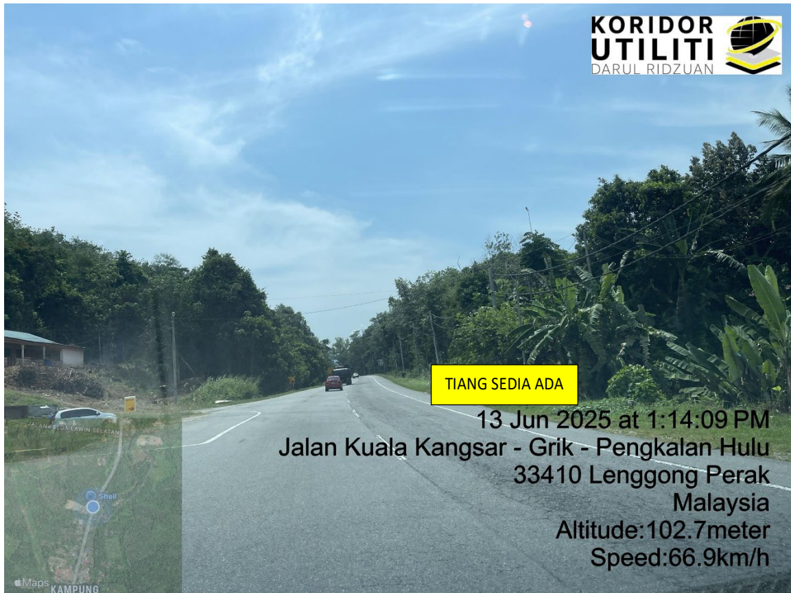
LOKASI DI JALAN KUALA KANGSAR – GRIK – PENGKALAN HULU