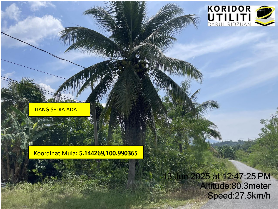
LOKASI DI JALAN GUA BADAK