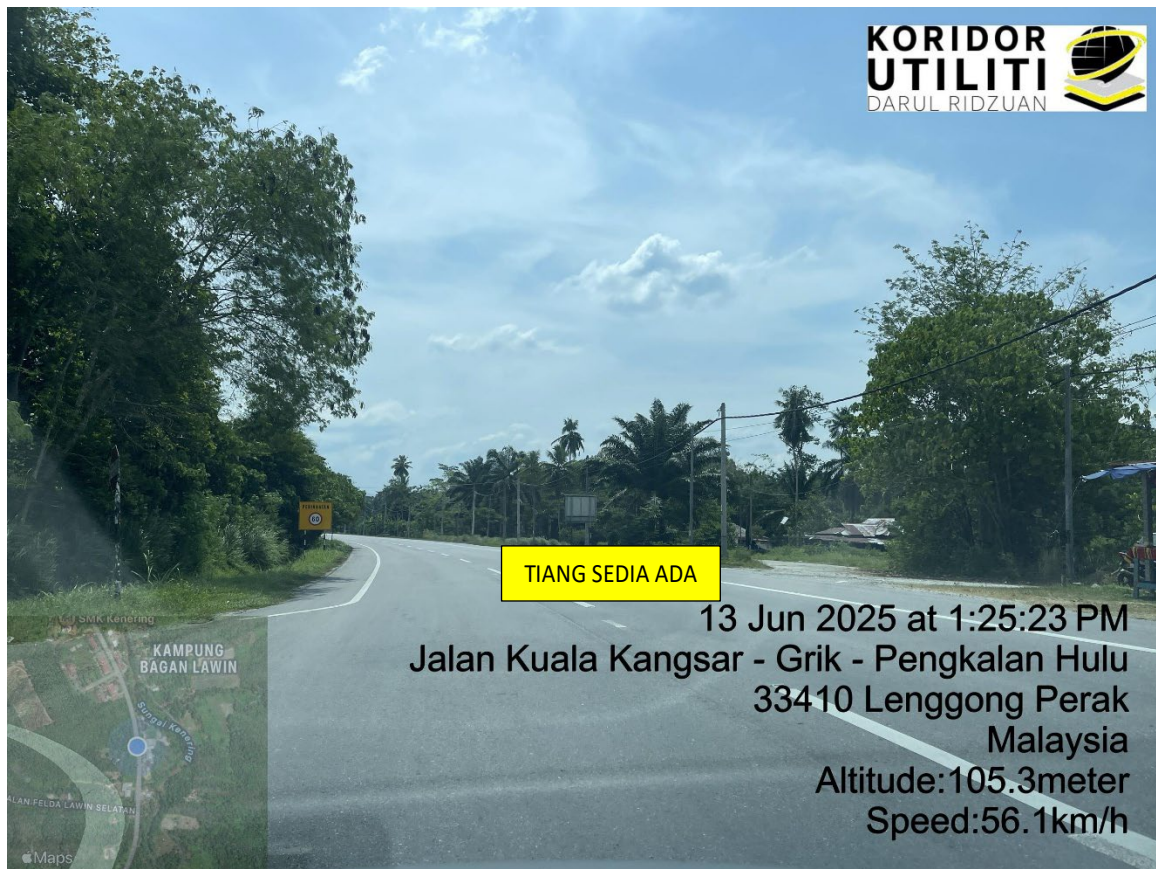
LOKASI DI JALAN KUALA KANGSAR – GRIK – PENGKALAN HULU