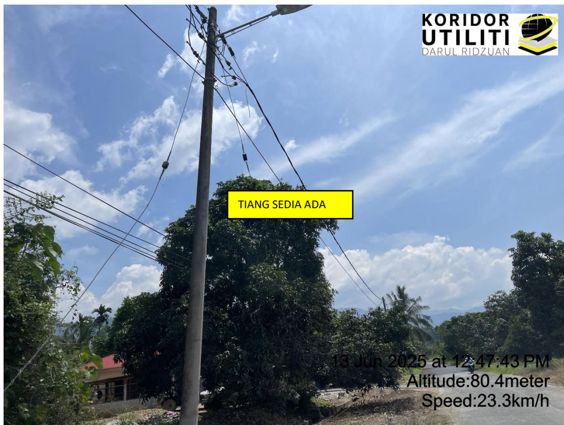
LOKASI DI JALAN GUA BADAK