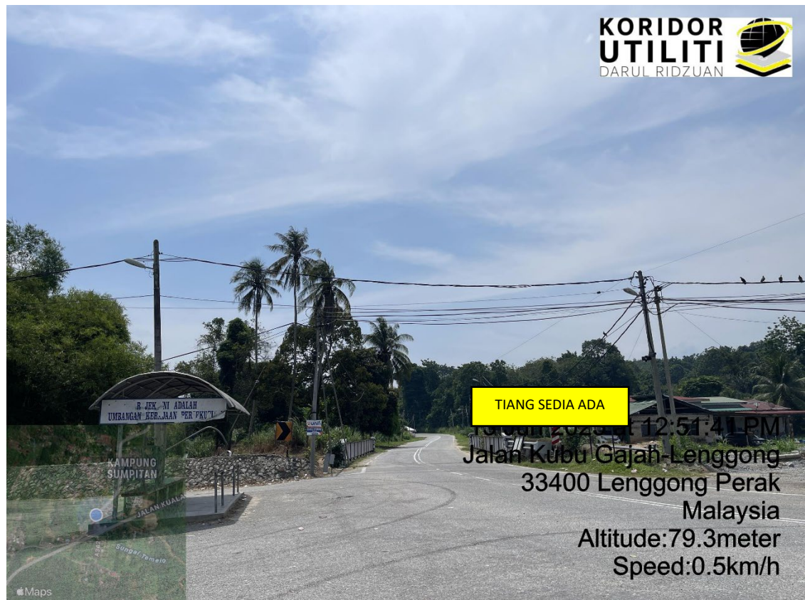
LOKASI DI JALAN SUMPITAN