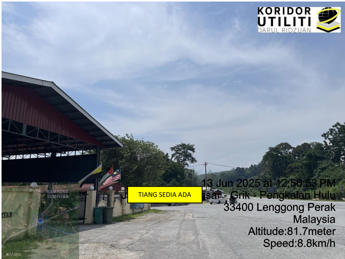
LOKASI DI JALAN SUMPITAN