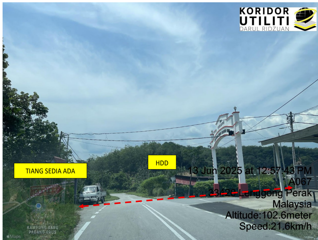
LOKASI DI JALAN PADANG GRUS (A067)