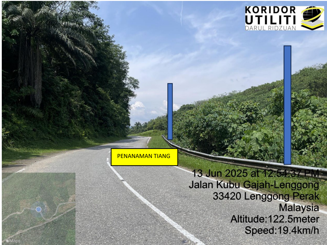
LOKASI DI JALAN KUBU GAJAH - LENGGONG