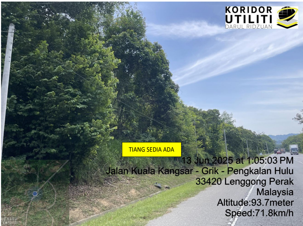
LOKASI DI JALAN KUALA KANGSAR – GRIK – PENGKALAN HULU