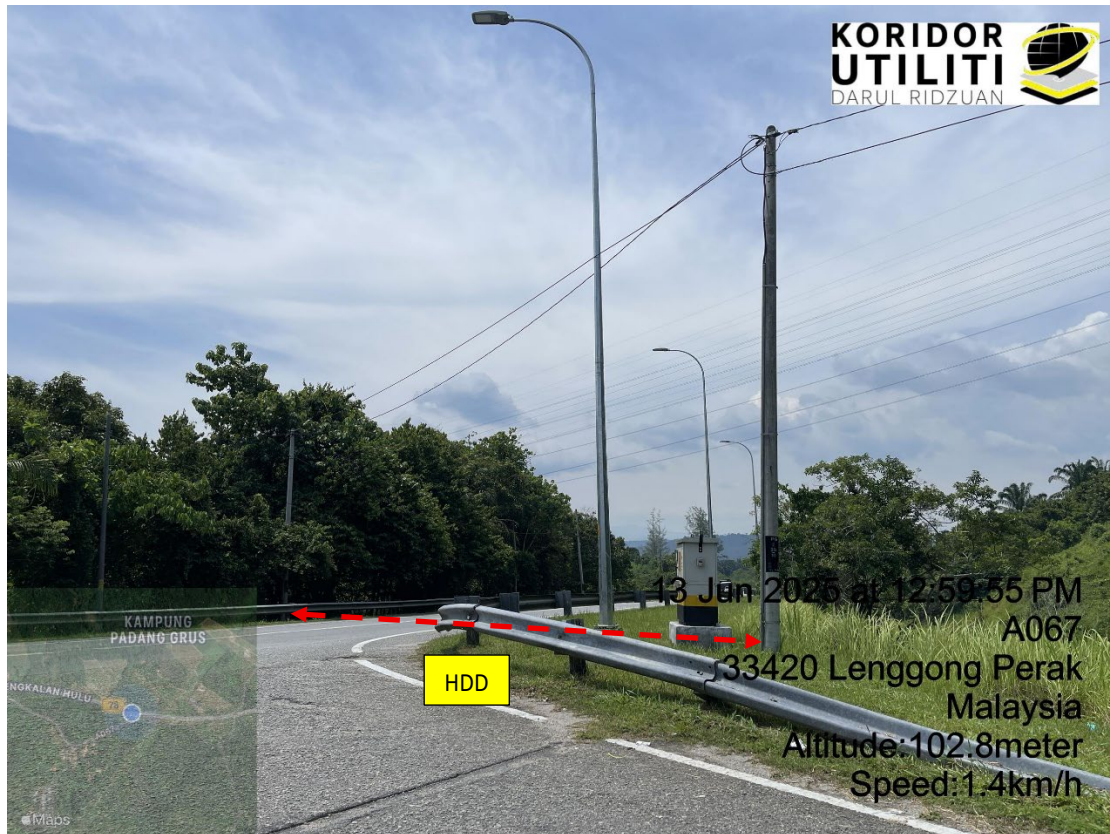
LOKASI DI JALAN PADANG GRUS (A067)