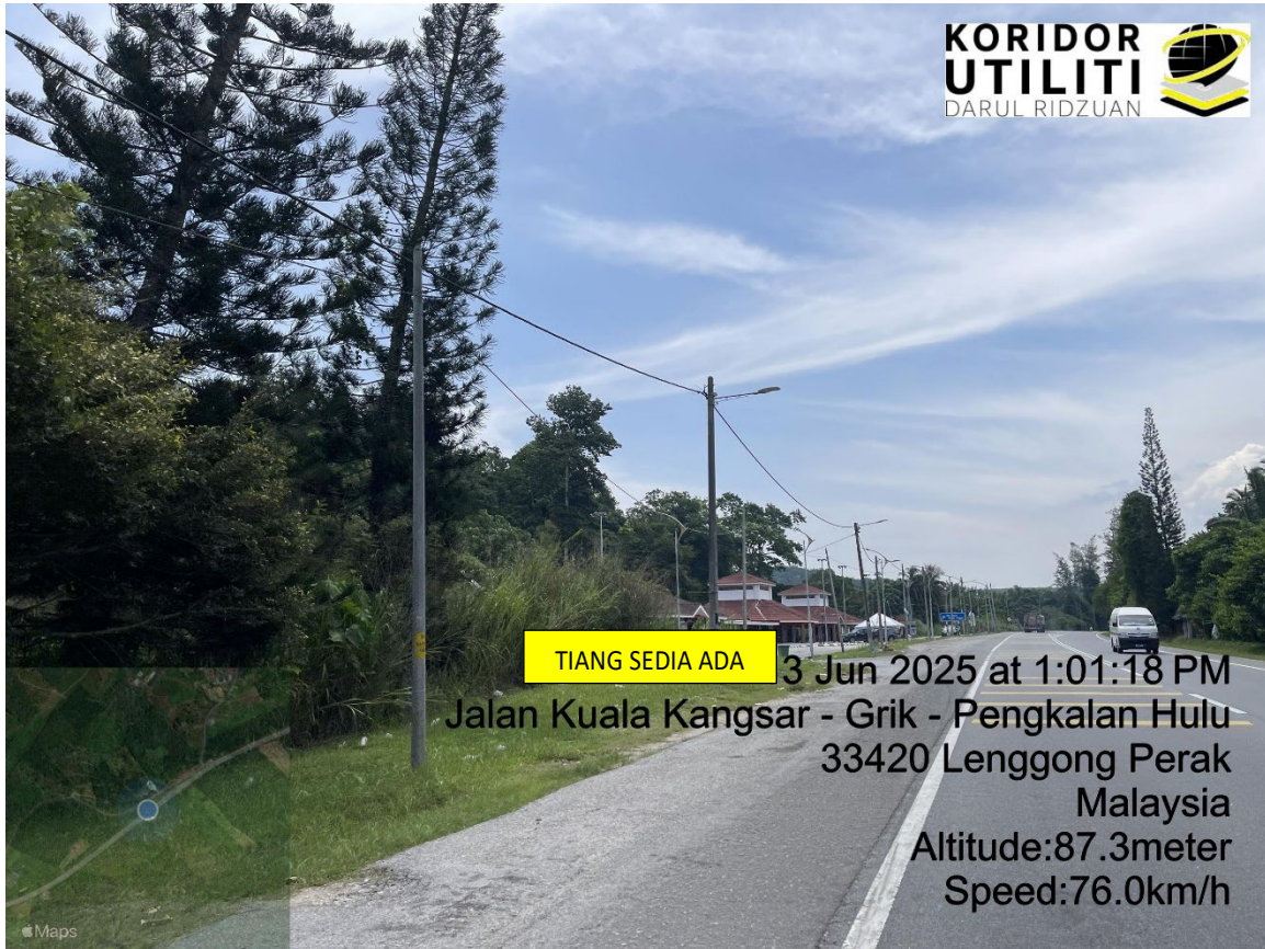
LOKASI DI JALAN KUALA KANGSAR – GRIK – PENGKALAN HULU