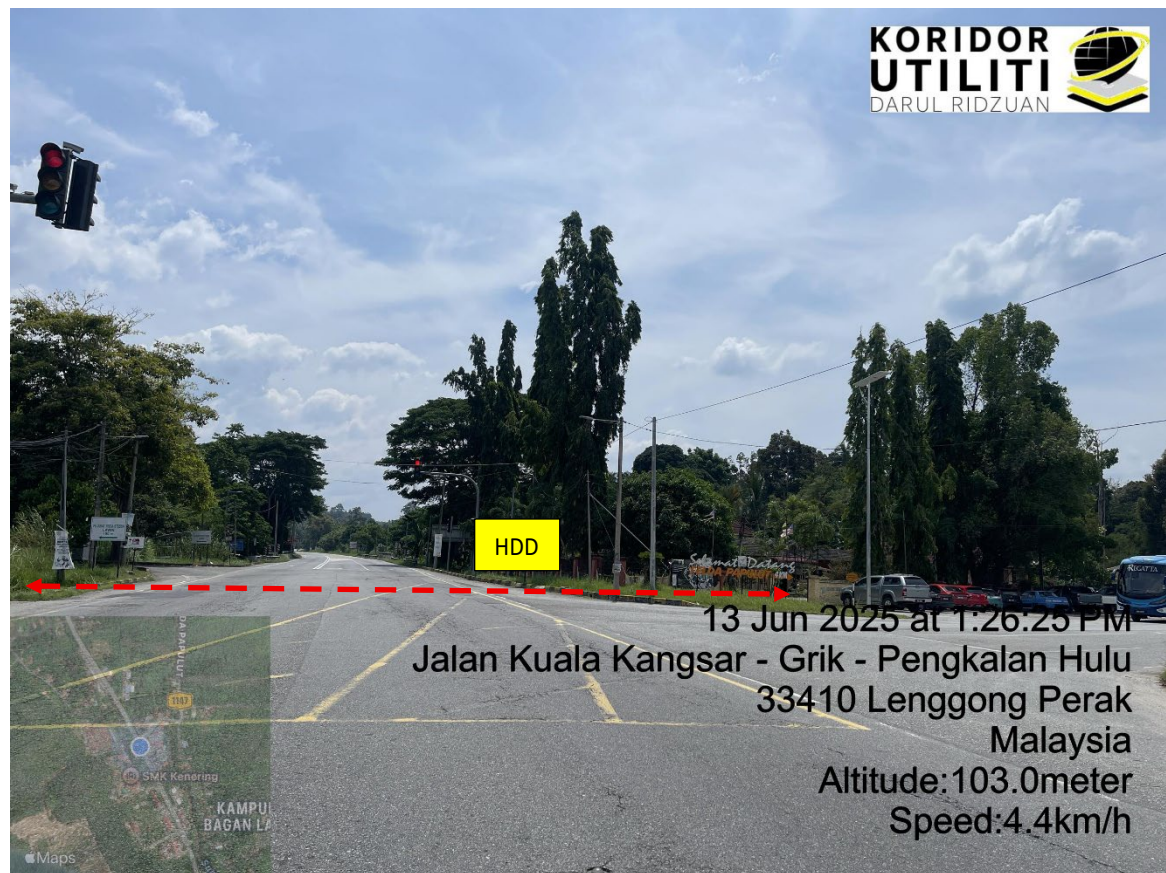
LOKASI DI JALAN KUALA KANGSAR – GRIK – PENGKALAN HULU