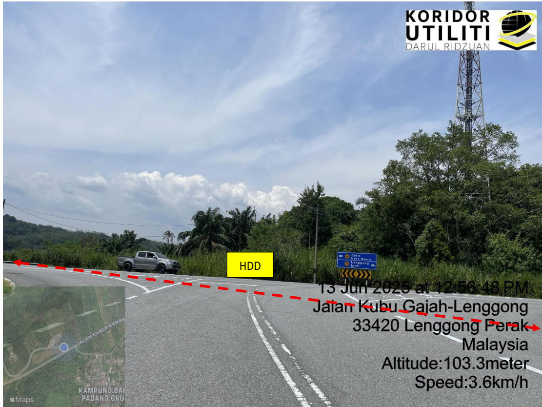
LOKASI DI JALAN KUBU GAJAH – LENGGONG