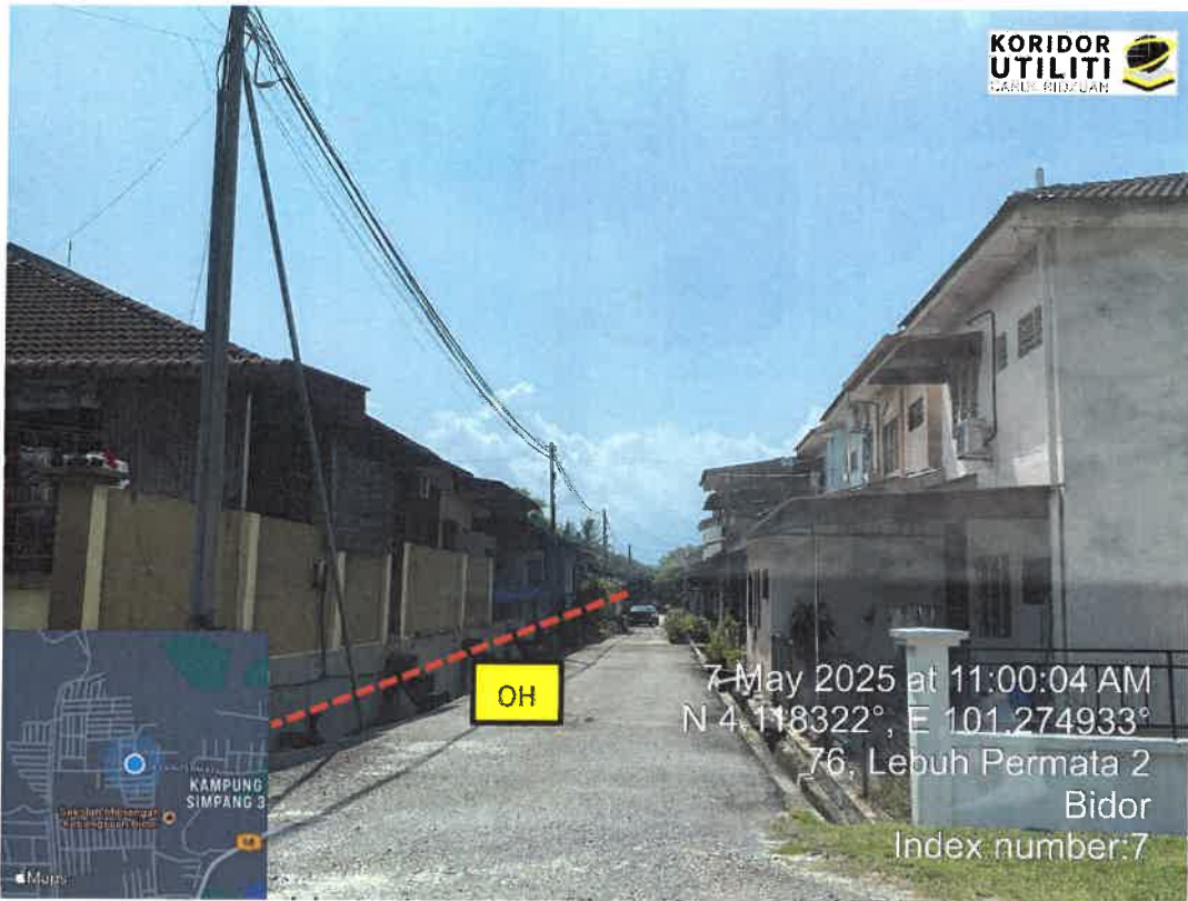
JAJARAN PEMASANGAN UTILITI