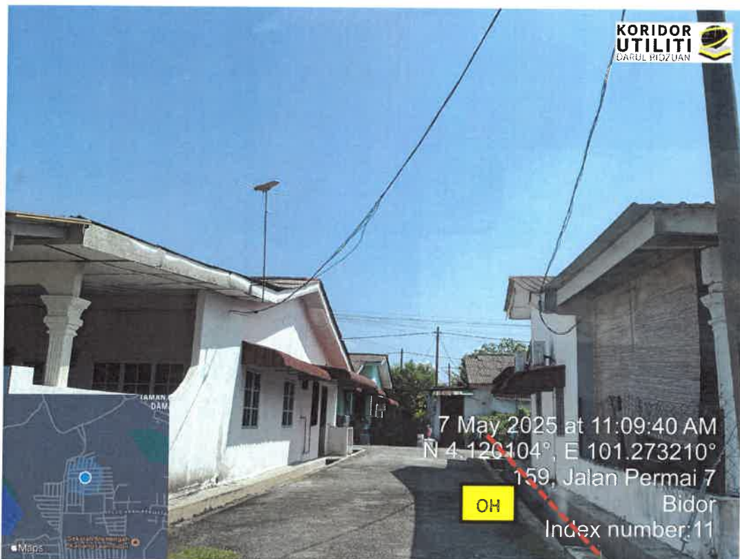
JAJARAN PEMASANGAN UTILITI