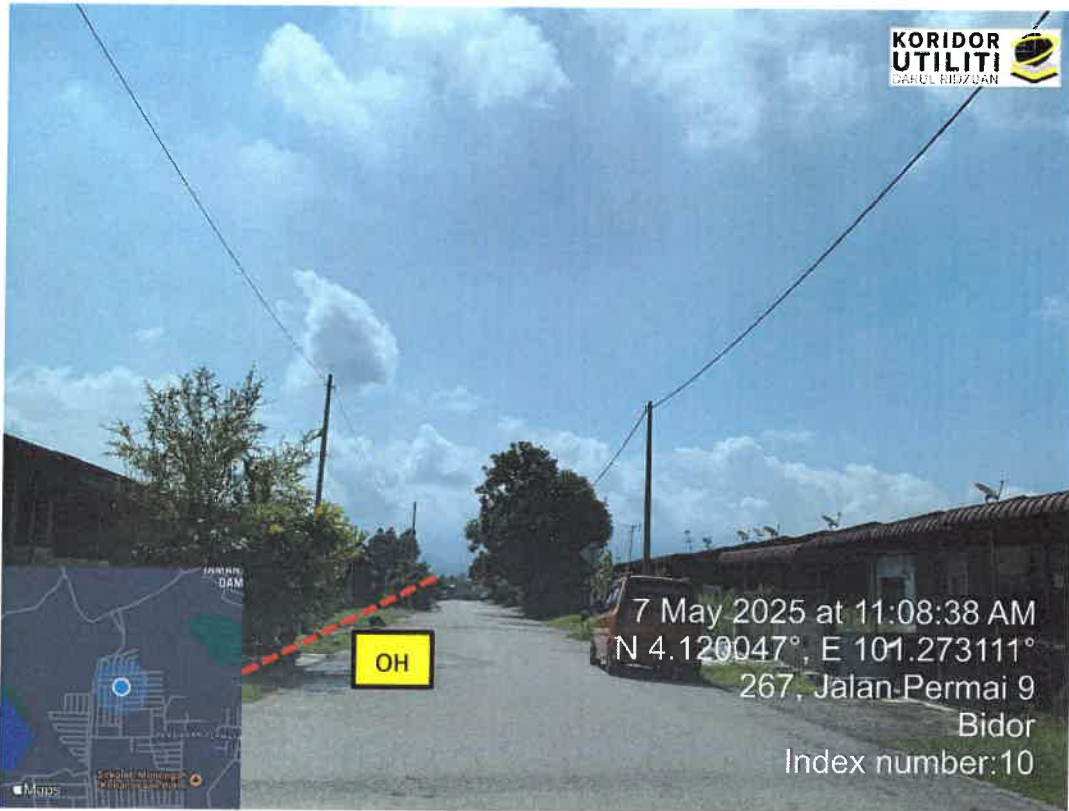
JALAN PERMAI 7