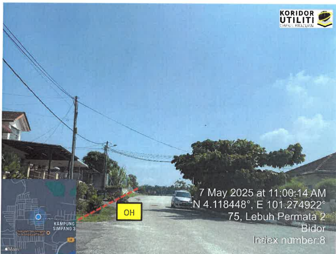
JAJARAN PEMASANGAN UTILITI