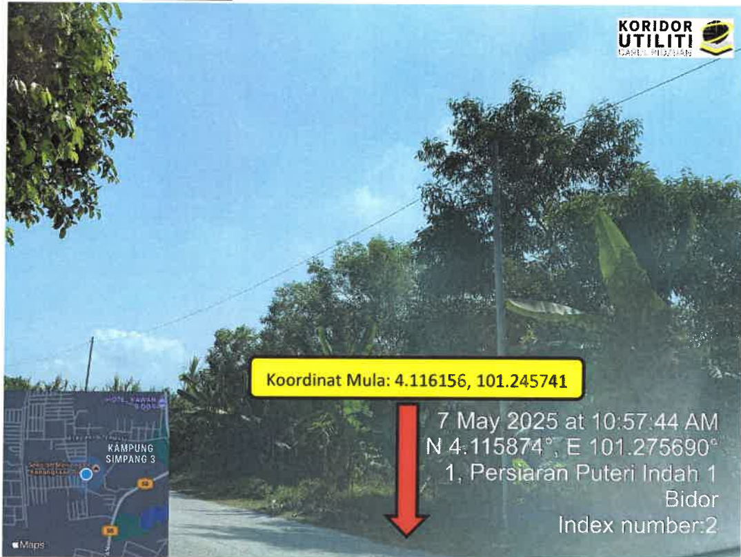
LEBUH PERTAMA 1