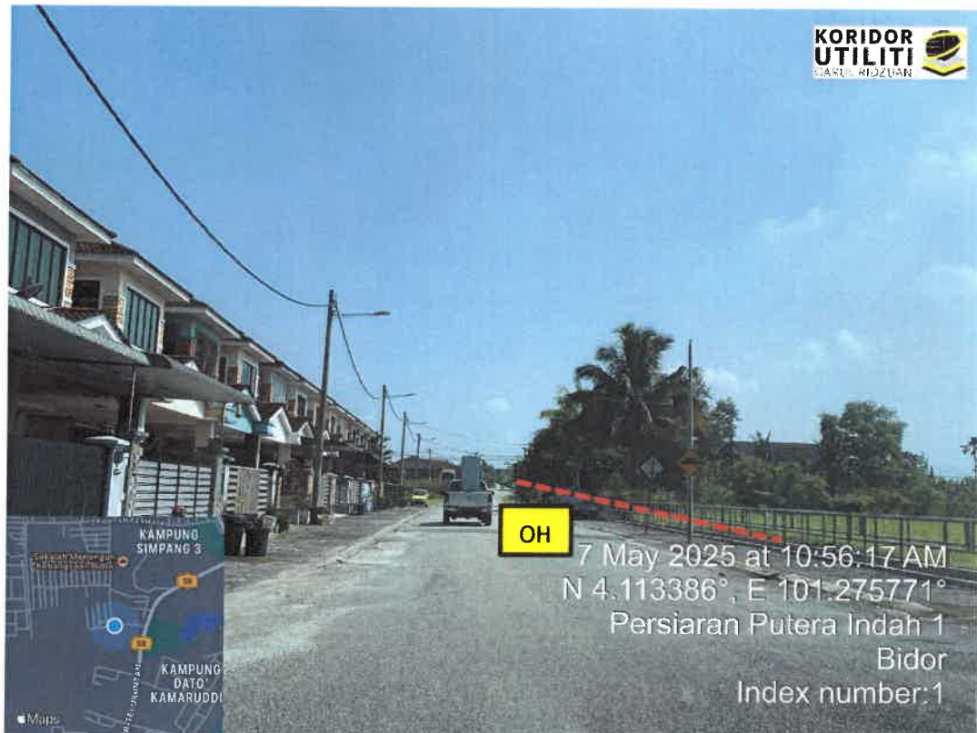
LEBUH PERTAMA 1