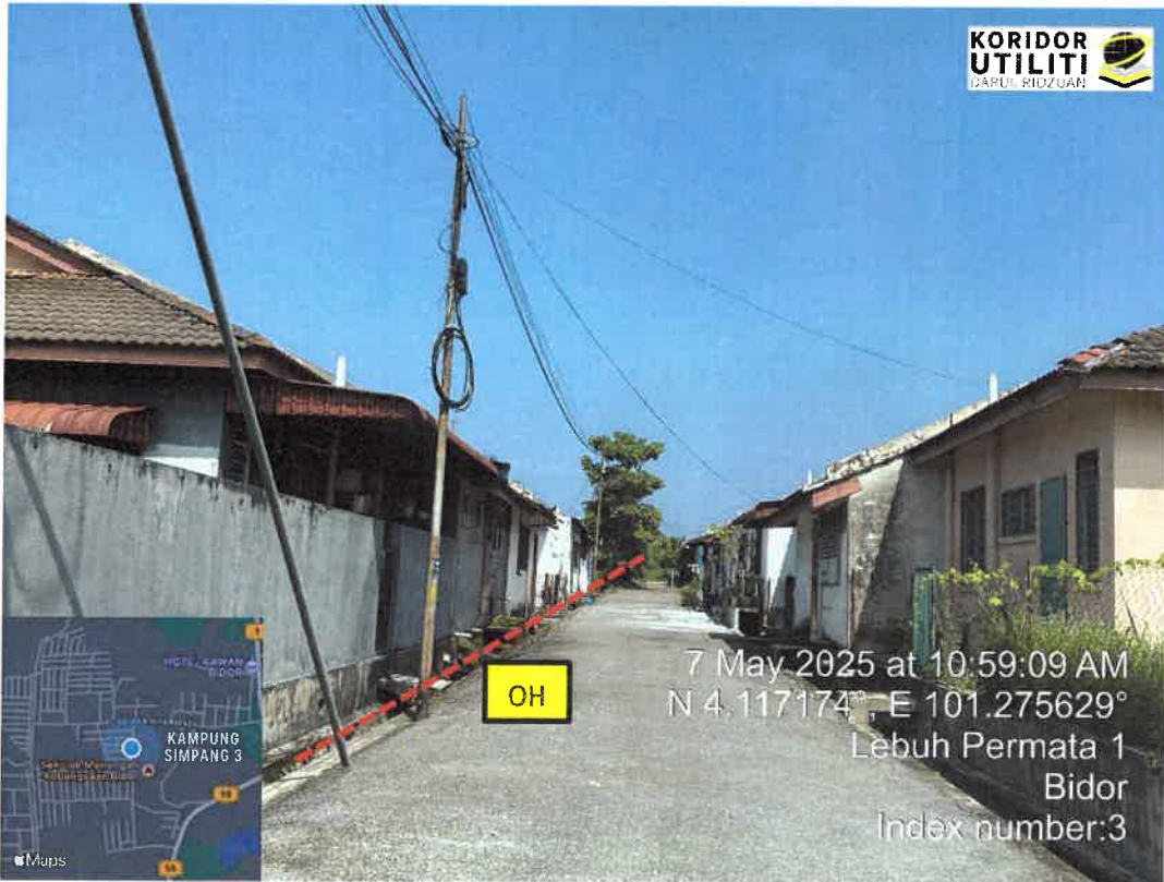
JAJARAN PEMASANGAN UTILITI