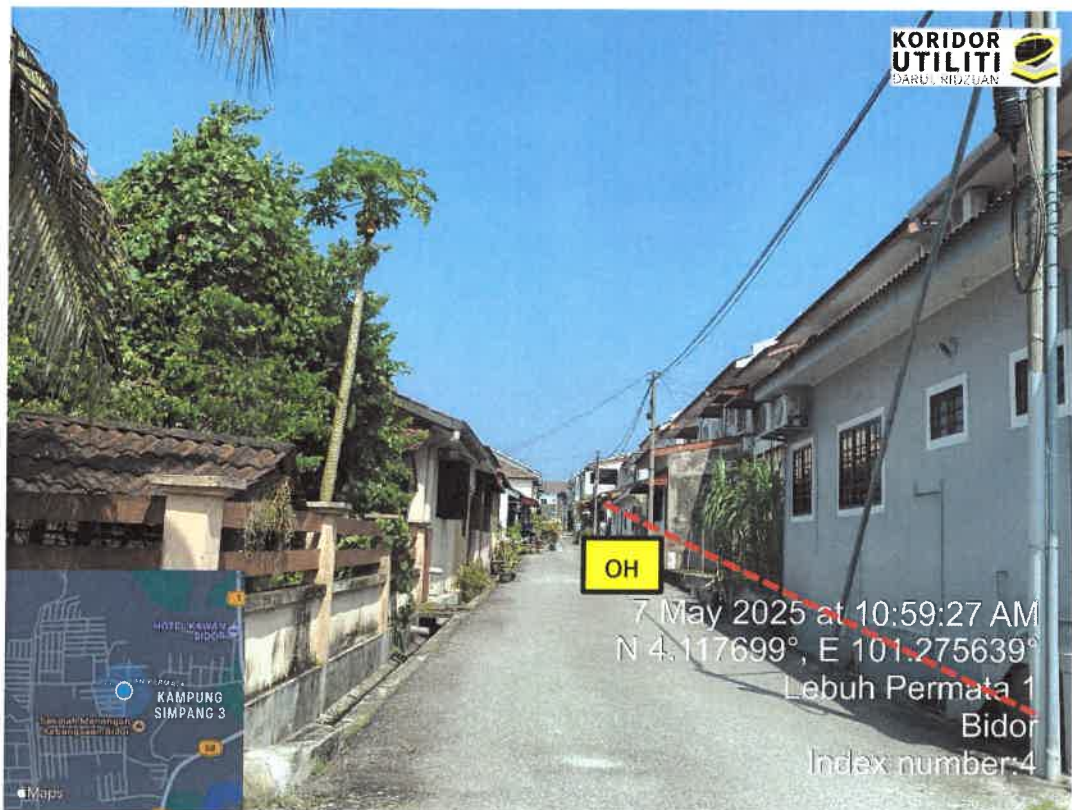
JAJARAN PEMASANGAN UTILITI