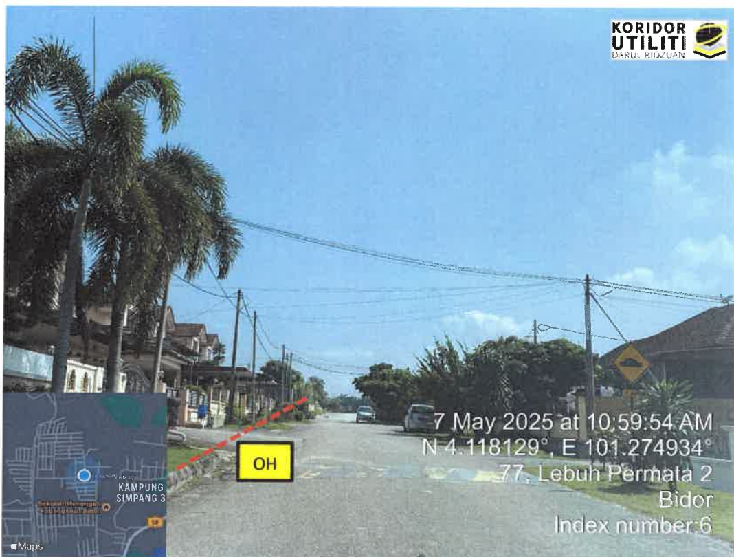
JAJARAN PEMASANGAN UTILITI