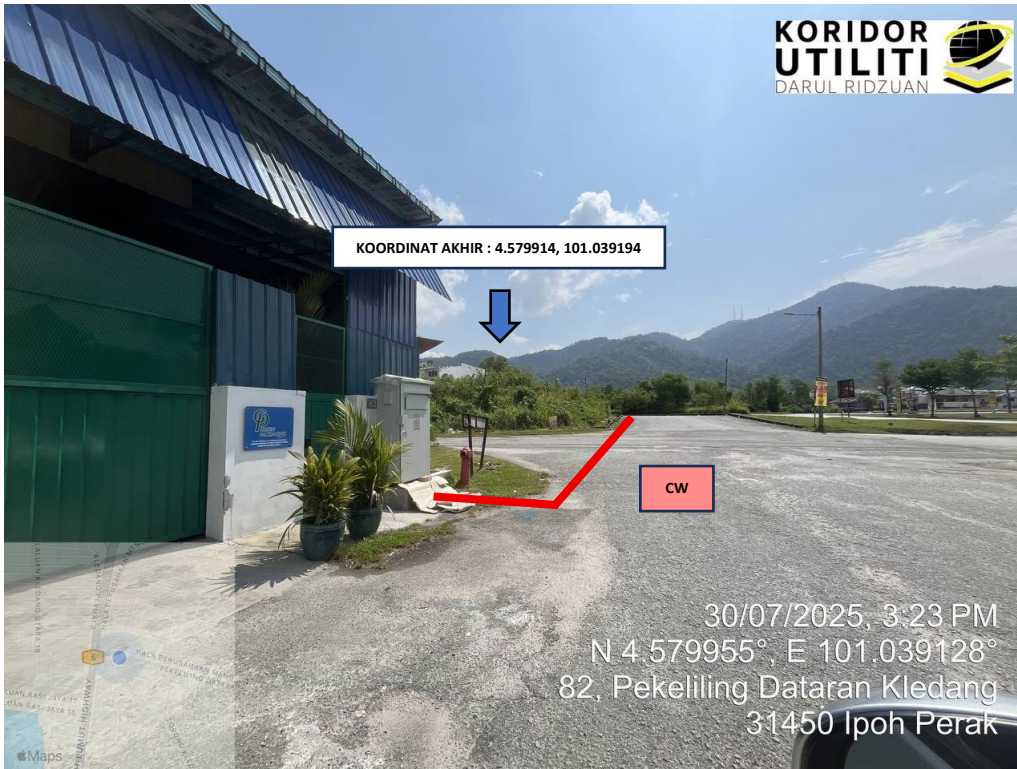
JAJARAN KOREKAN TERBUKA DI PEKELILING DATARAN KLEDANG (Sambungan akan dibuat daripada peti pembekal sedia ada ke meter kios)