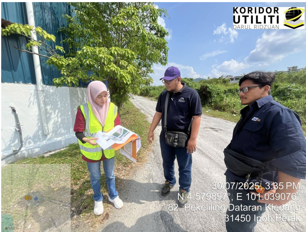
LAWATAN TAPAK AWALAN BERSAMA PEMOHON