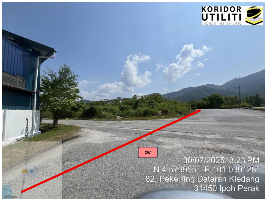
JAJARAN KOREKAN TERBUKA DI LORONG KLEDANG 1 (Sambungan akan dibuat daripada peti pembekal sedia ada ke meter kiosk)