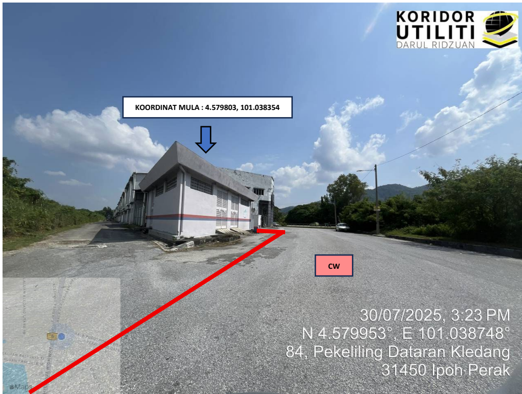
LOKASI KOORDINAT MULA KOREKAN TERBUKA DI LORONG KLEDANG 1 (Sambungan akan dibuat ke meter kiosk)