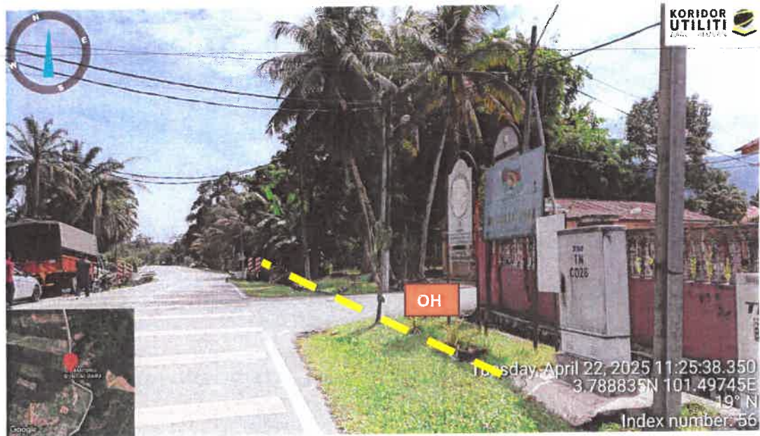
Rajah 2: Lintasan Jalan Mawar Kampung Sungai Dara