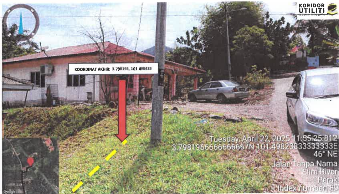
Rajah 10: Koordinat Akhir Jalan Kampung Sungai Dara Tambahan