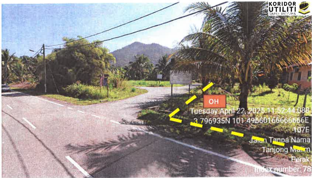
Rajah 5: Jalan Kg Tersusun Sungai Dara Tambahan