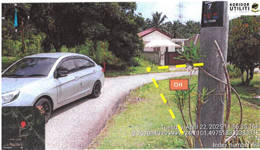
Rajah 9: Lintasan Jalan Kg Tersusun Sungai Dara Tambahan