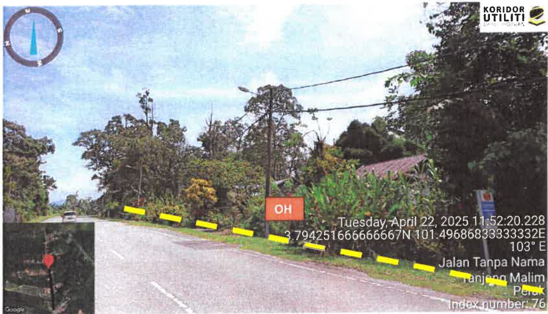
Rajah 3: Jalan A121