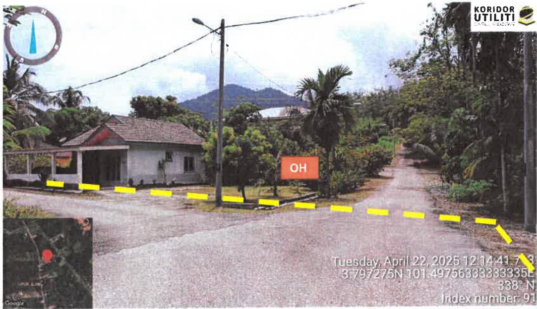
Rajah 7: Lintasan Jalan Kg Tersusun Sungai Dara Tambahan