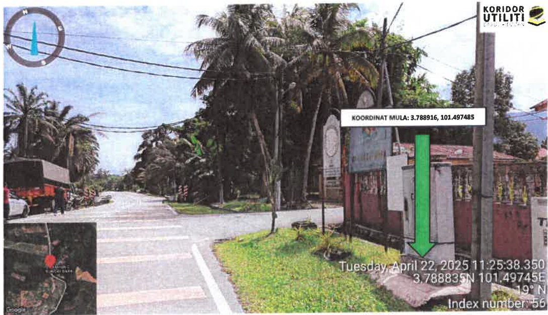
Rajah 1: Lokasi Koordinat Mula Jalan A121