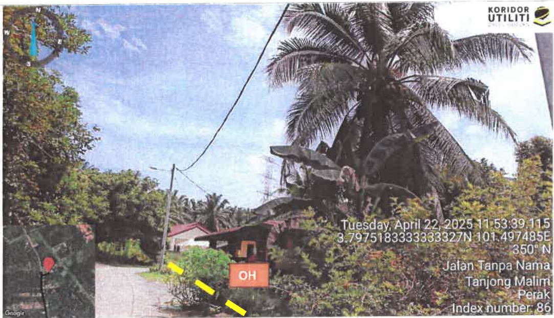
Rajah 8: Jalan Kg Tersusun Sungai Dara Tambahan