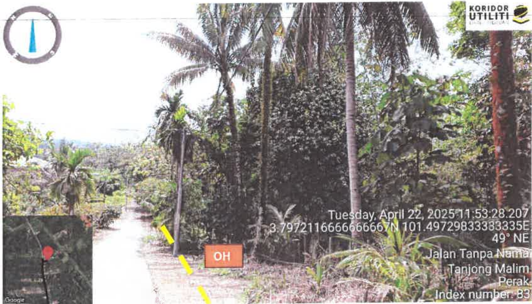
Rajah 6: Jalan Kg Tersusun Sungai Dara Tambahan