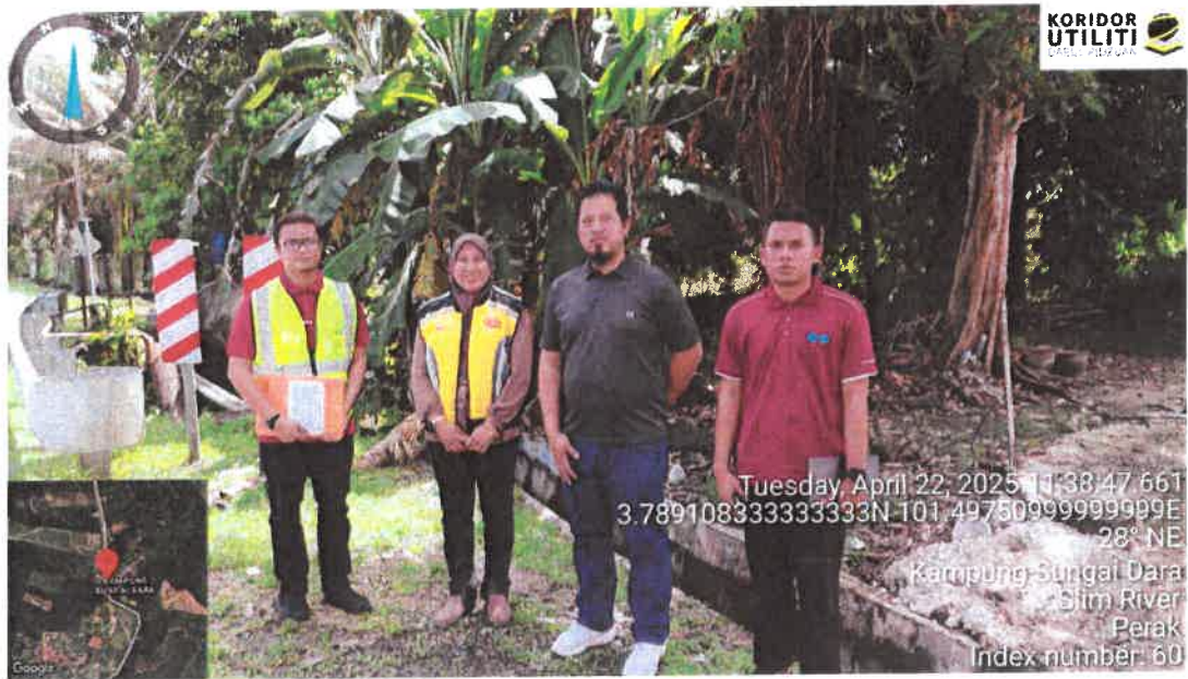
Rajah 11: Lawatan Tapak Awalan (LTA) Bersama Pihak Berkuasa Melulus (PBM) dan Pemohon