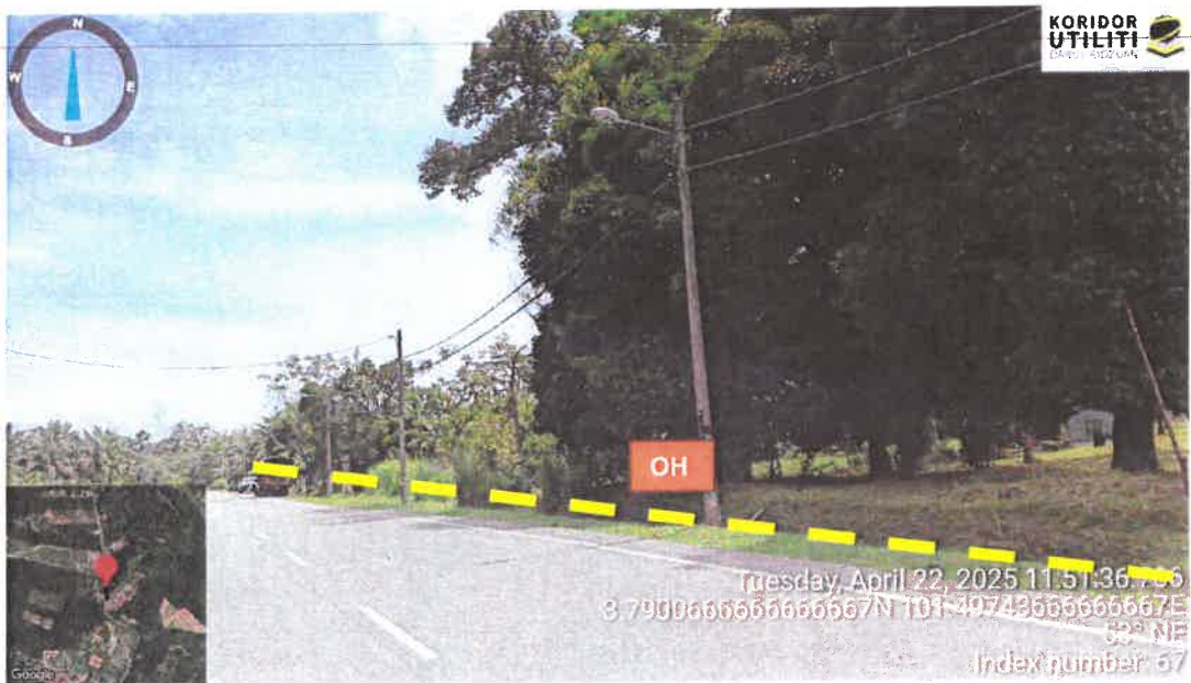
Rajah 4: Jalan A121