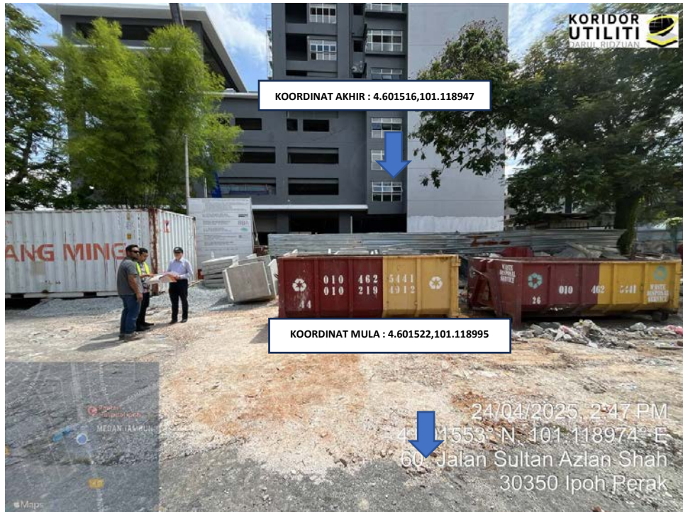
LOKASI KOORDINAT MULA DAN AKHIR KOREKAN TERBUKA DI JALAN SULTAN AZLAN SHAH