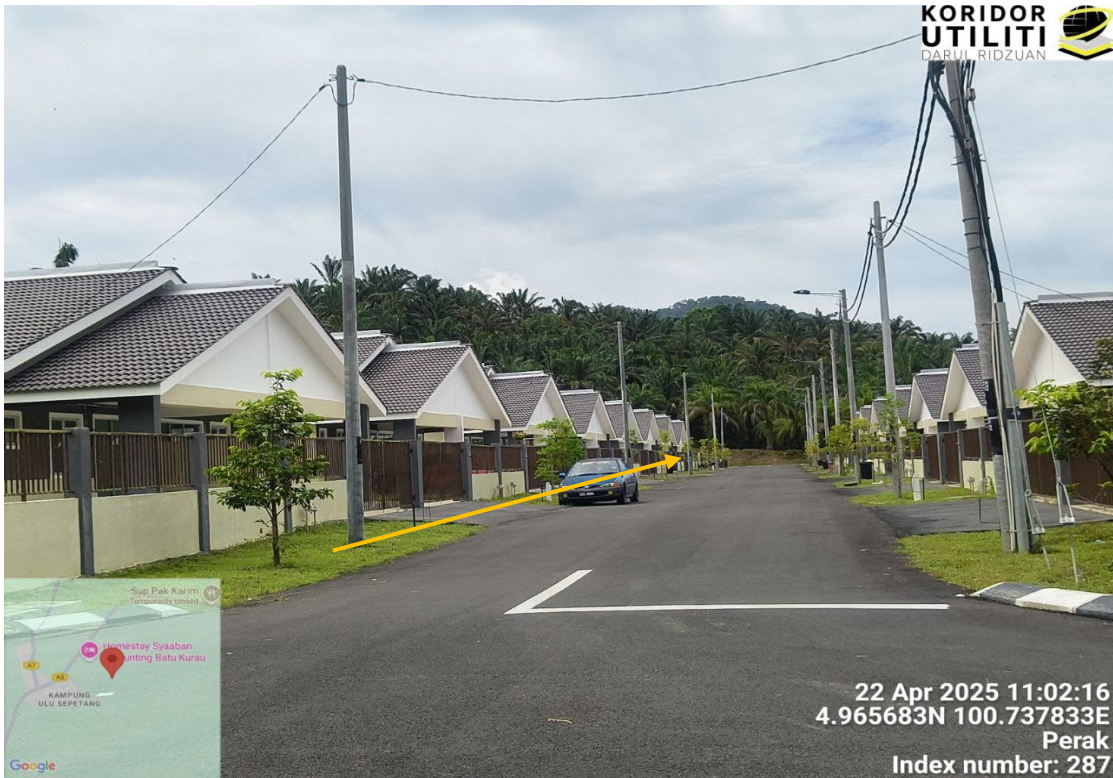
CADANGAN LALUAN PENANAMAN TIANG DI JAJARAN KIRI