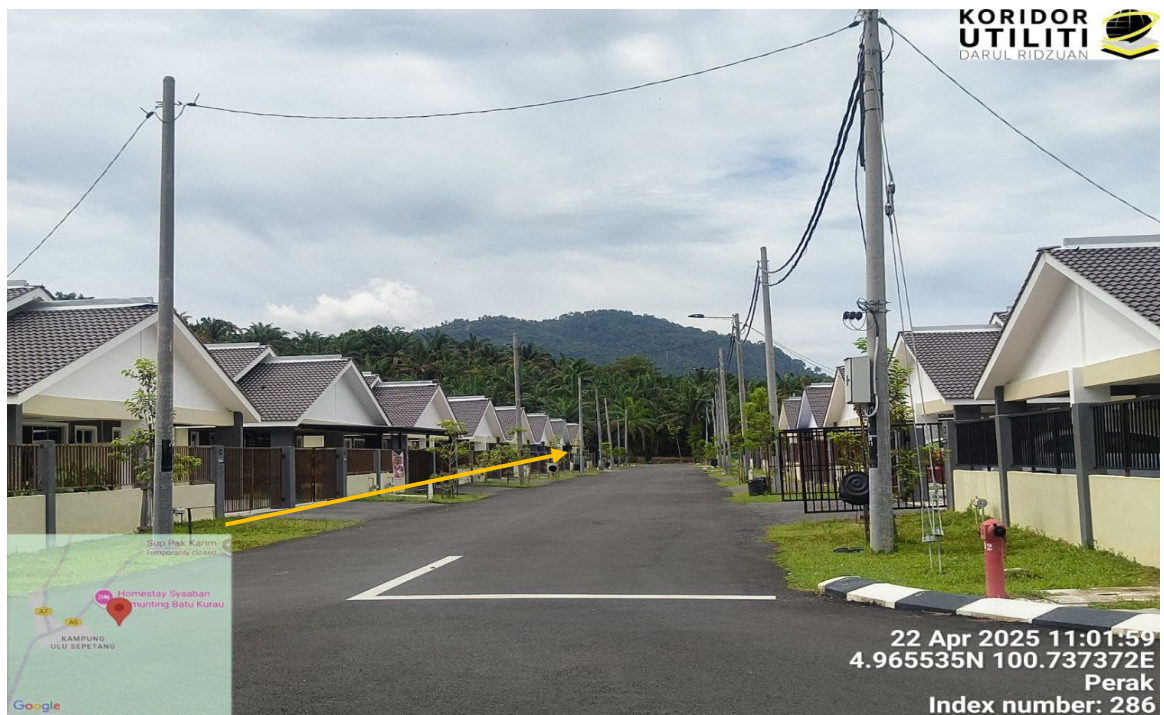
CADANGAN LALUAN PENANAMAN TIANG DI JAJARAN KIRI