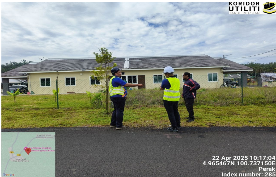
PERBINCANGAN BERSAMA PIHAK MPT DAN TM