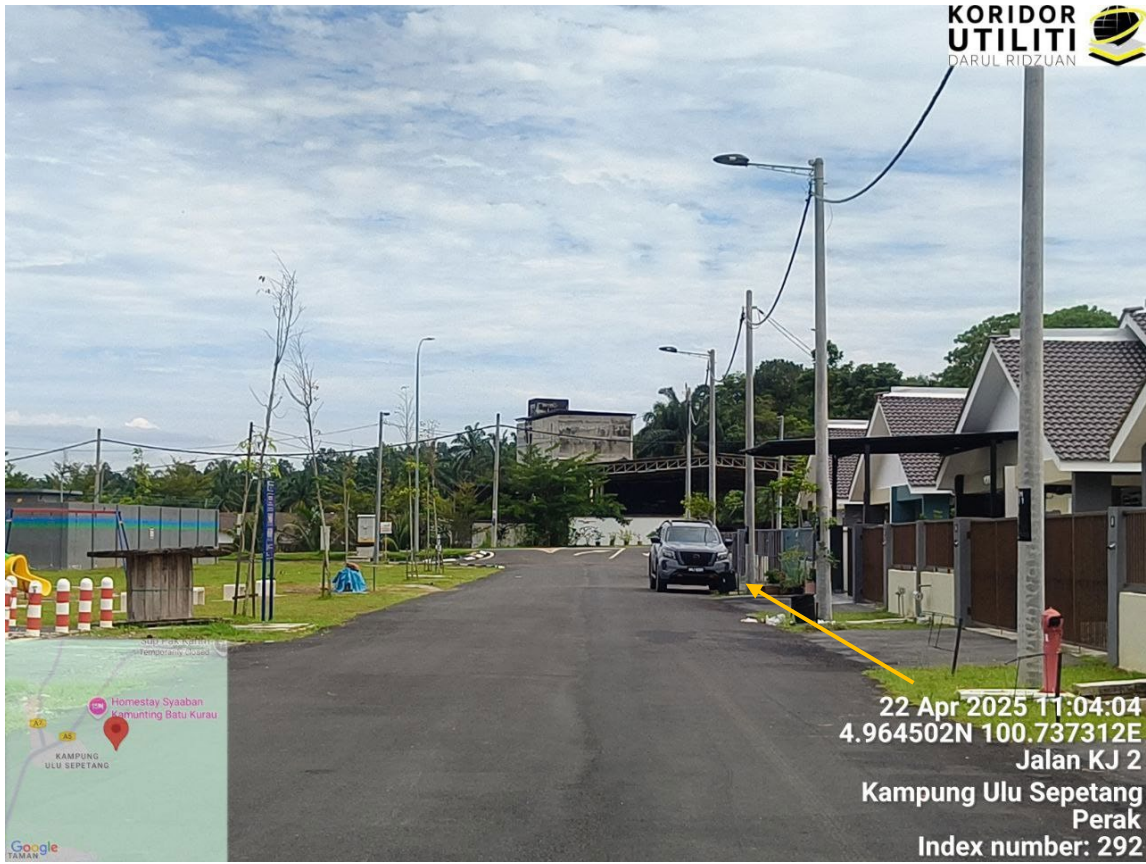
CADANGAN LALUAN PENANAMAN TIANG