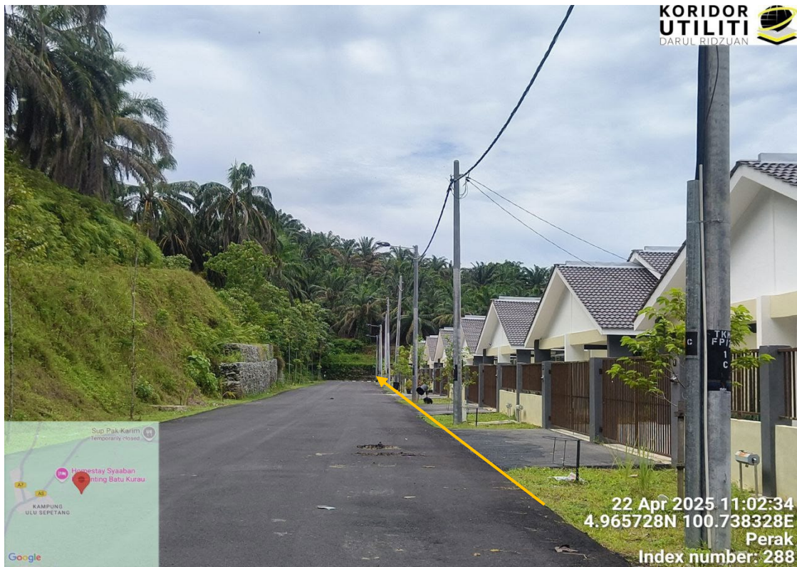
CADANGAN LALUAN PENANAMAN TIANG DI JAJARAN KIRI