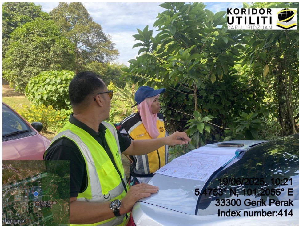
LOKASI DI JALAN KUALA KANGSAR – GRIK – PENGKALAN HULU