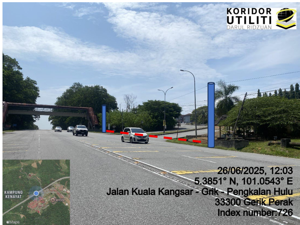
LOKASI DI JALAN KUALA KANGSAR – GRIK – PENGKALAN HULU