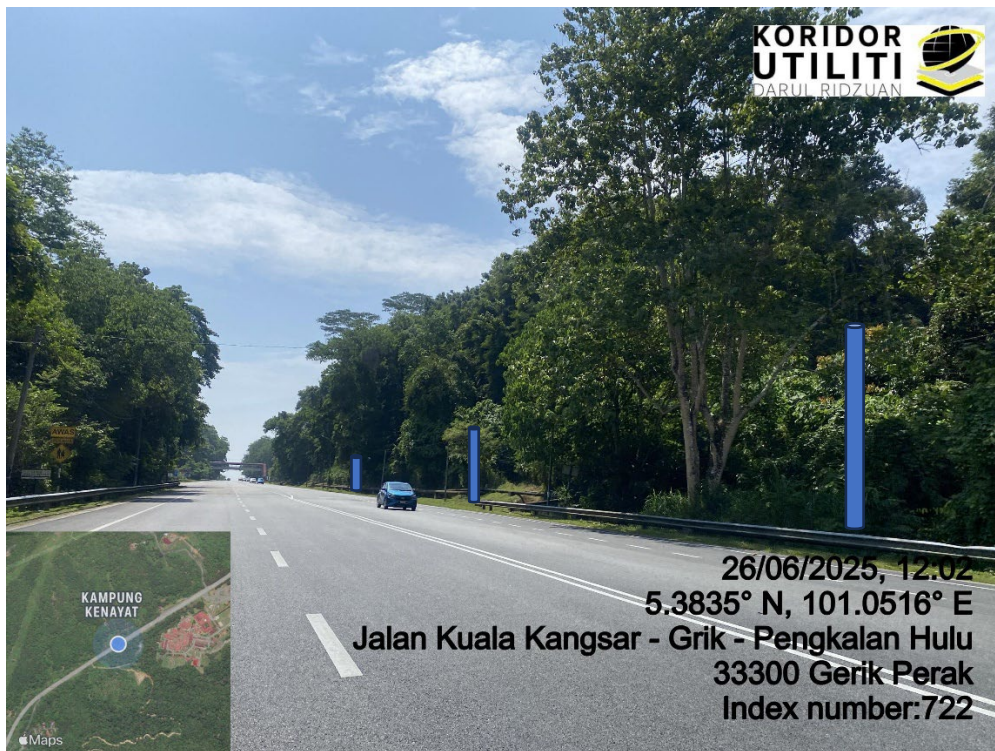
LOKASI DI JALAN KUALA KANGSAR – GRIK – PENGKALAN HULU