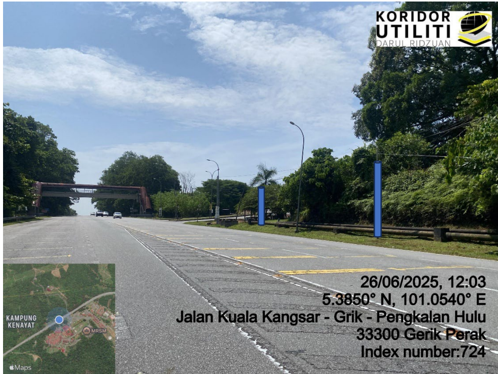
LOKASI DI JALAN KUALA KANGSAR – GRIK – PENGKALAN HULU