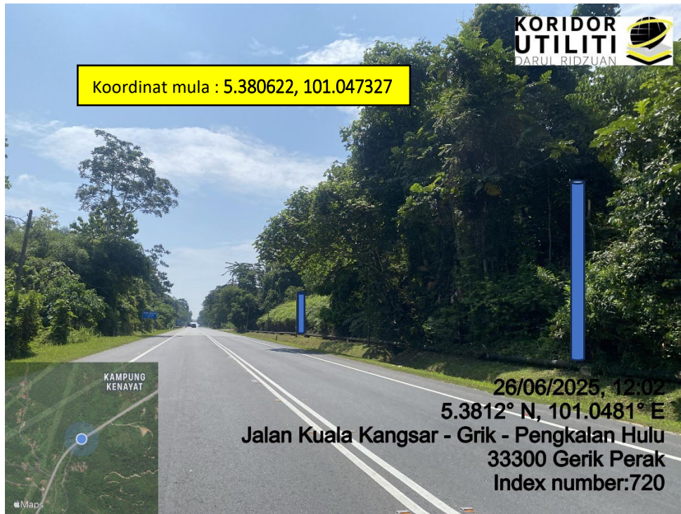
LOKASI DI JALAN KUALA KANGSAR – GRIK – PENGKALAN HULU