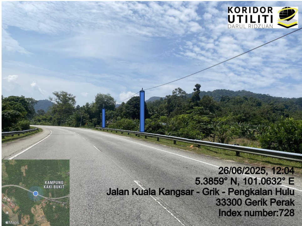
LOKASI DI JALAN KUALA KANGSAR – GRIK – PENGKALAN HULU