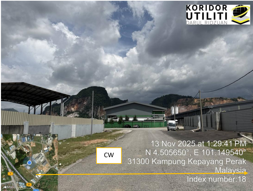
LOKASI DI PERSIARAN PERINDUSTRIAN TUNGZEN 29