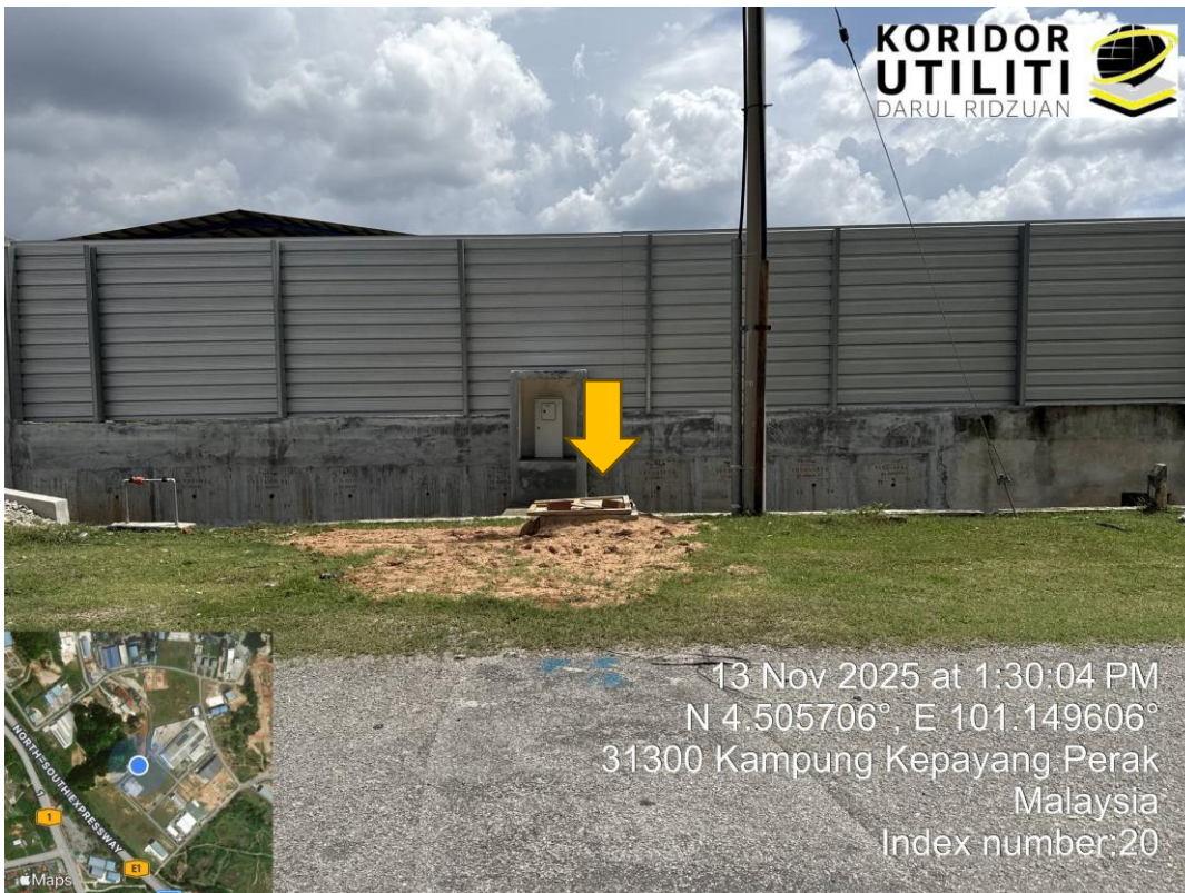
KOORDINAT AKHIR DI METER KIOSK