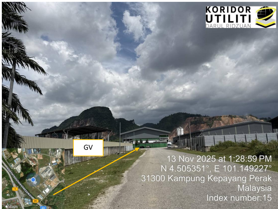
KOREKAN DI BAHU JALAN