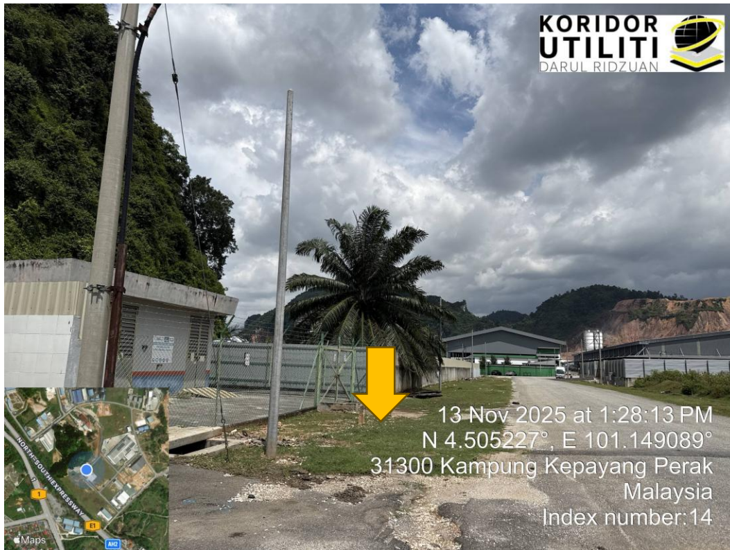
KOORDINAT MULA DI P/E GOPENG