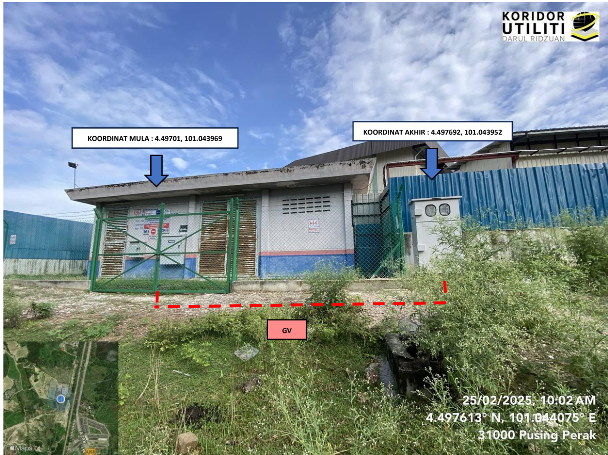
LOKASI KOORDINAT MULA DAN AKHIR KOREKAN TERBUKA DI SUNGAI TERAP