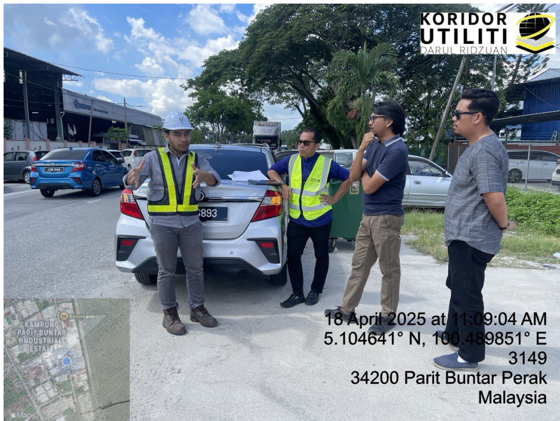
LOKASI DI JALAN PERUSAHAN