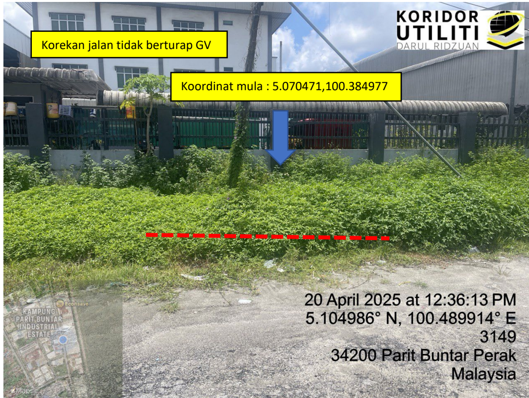
LOKASI DI JALAN PERUSAHAN