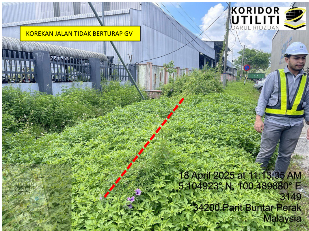
LOKASI DI JALAN PERUSAHAN