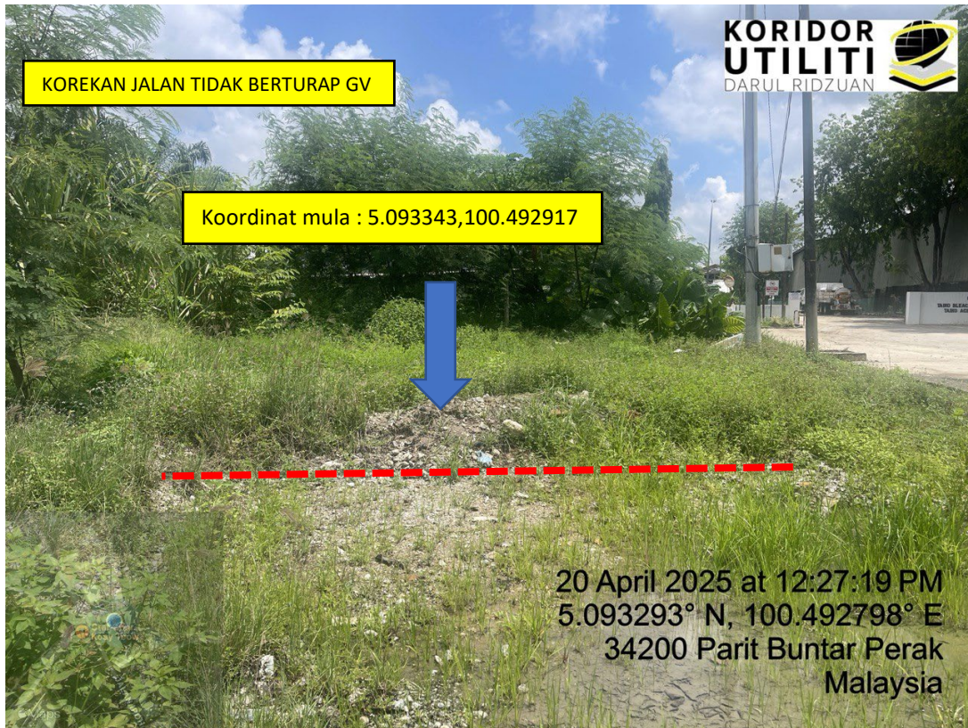
LOKASI DI JALAN PANTAI