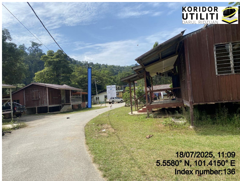
LOKASI DI JALAN RPS BANUN