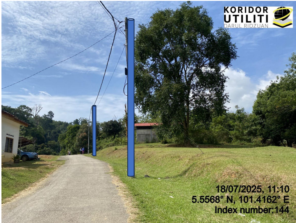
LOKASI DI JALAN RPS BANUN