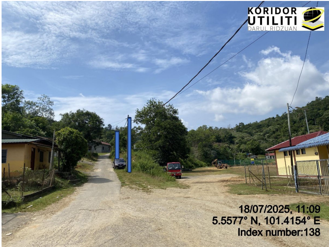
LOKASI DI JALAN RPS BANUN