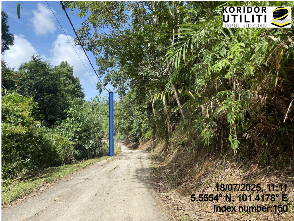
LOKASI DI JALAN RPS BANUN