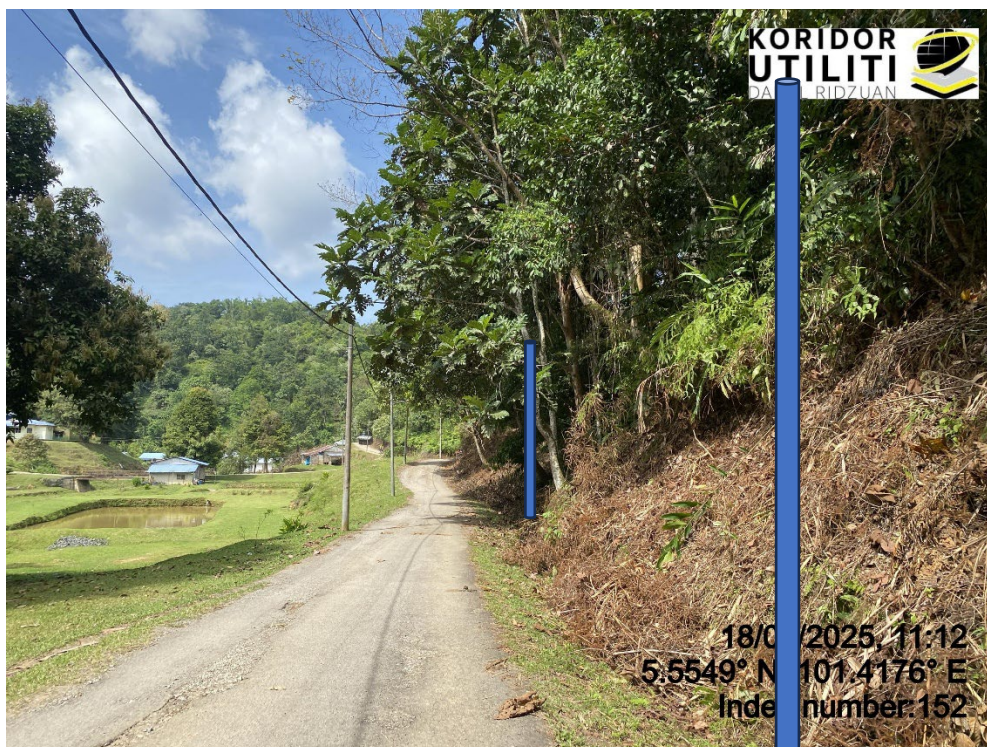
LOKASI DI JALAN RPS BANUN