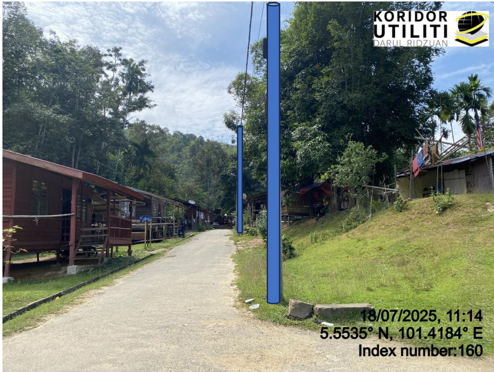
LOKASI DI JALAN RPS BANUN