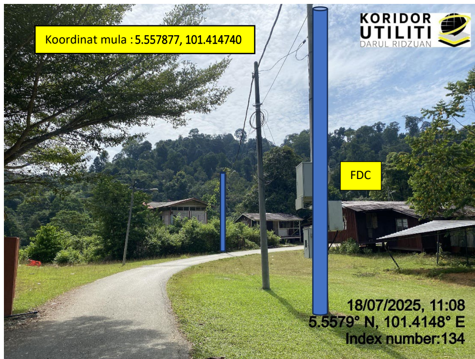
LOKASI DI JALAN SK RPS BANUN