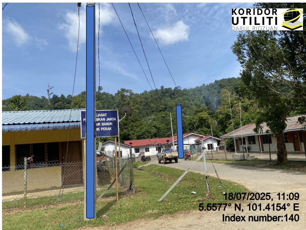
LOKASI DI JALAN RPS BANUN