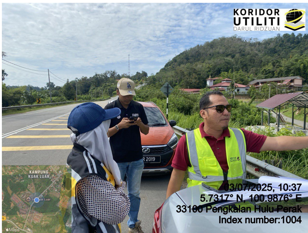
LOKASI DI JALAN SK RPS BANUN