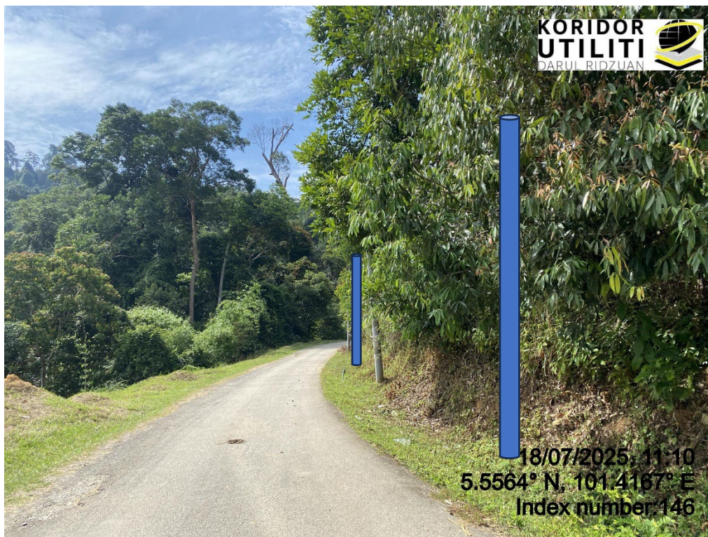
LOKASI DI JALAN RPS BANUN