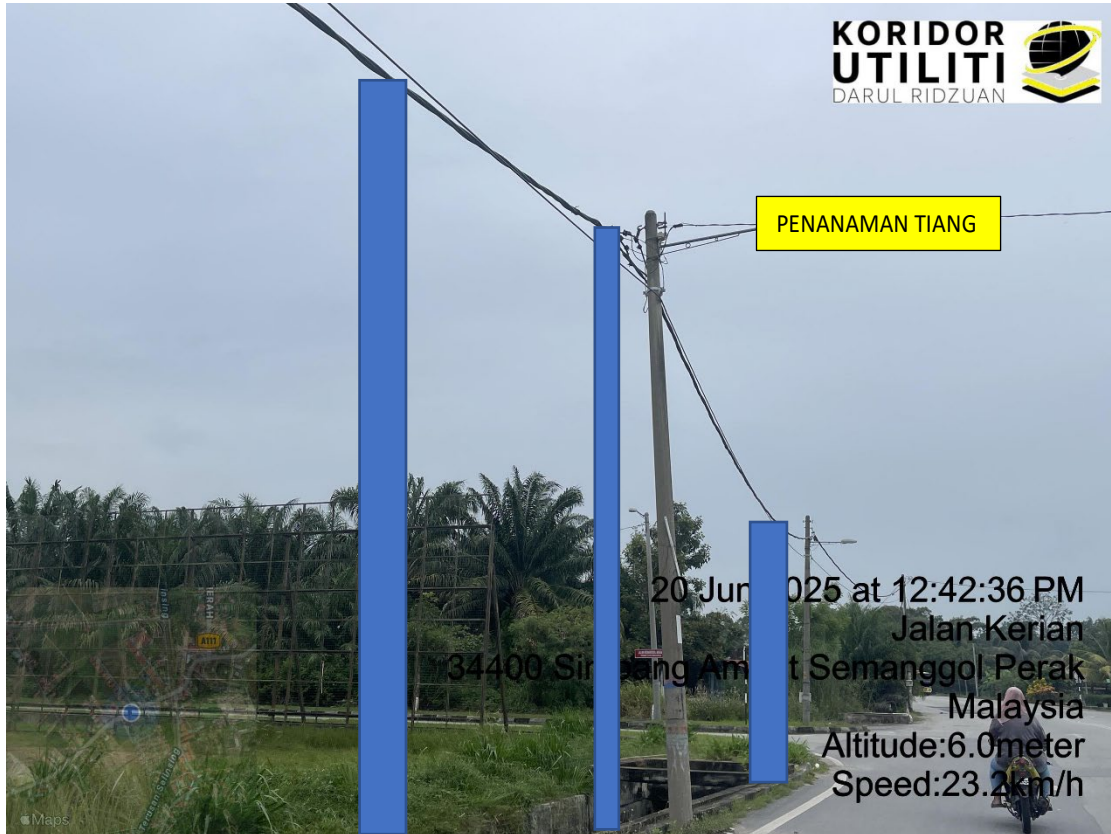
LOKASI DI JALAN KERIAN