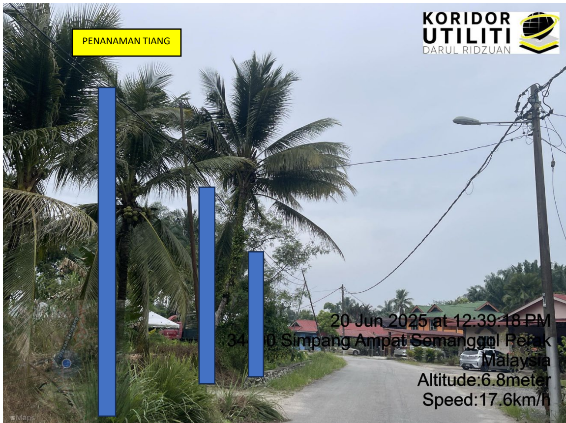
LOKASI DI JALAN KAMPUNG BUKIT SEMANGGOL