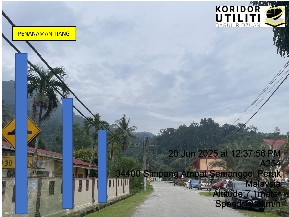
LOKASI DI JALAN KAMPUNG BUKIT SEMANGGOL