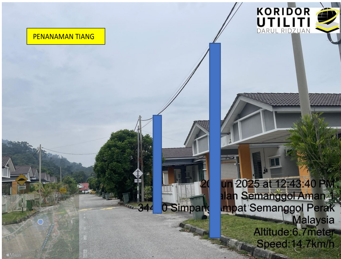
LOKASI DI JALAN TAMAN SEMANGGOL AMAN