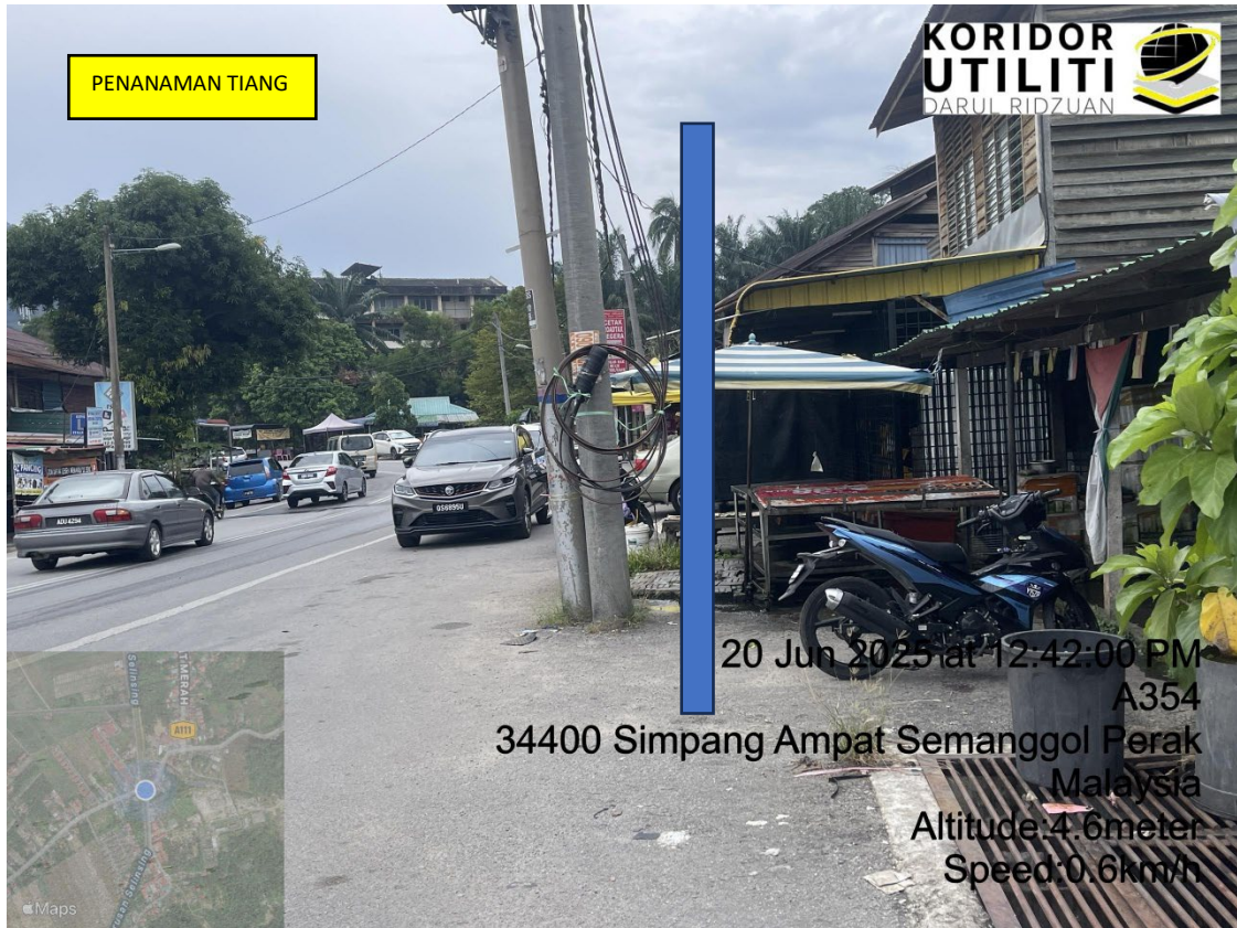
LOKASI DI JALAN KERIAN