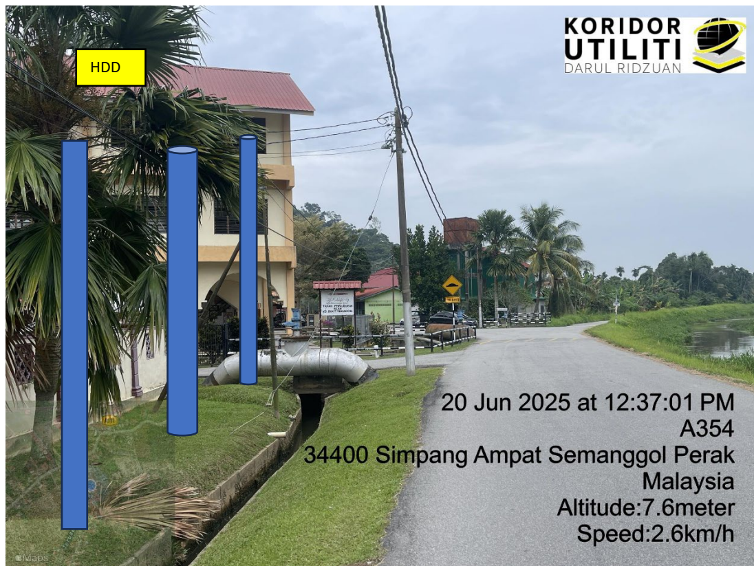
LOKASI DI JALAN KAMPUNG BUKIT SEMANGGOL