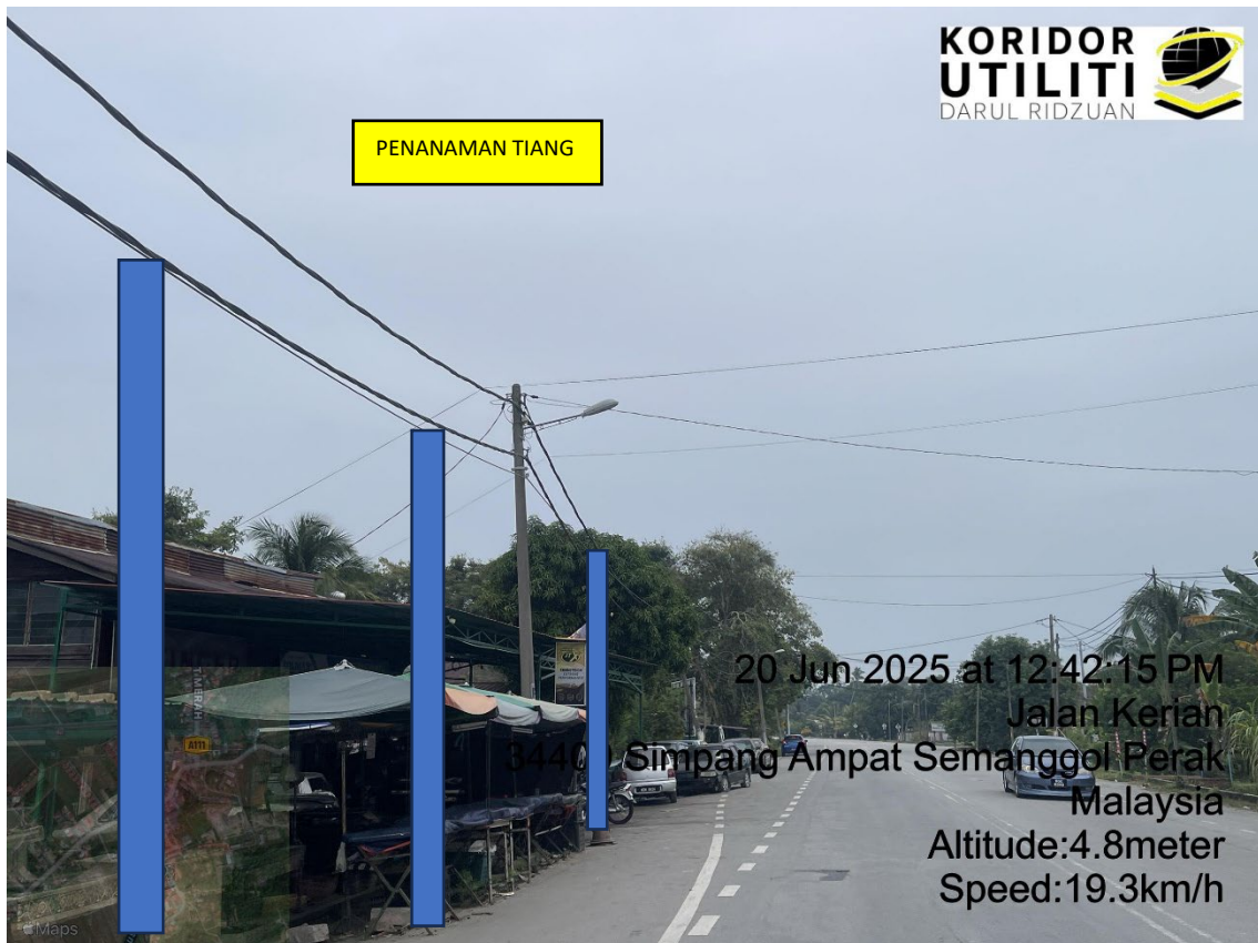
LOKASI DI JALAN KERIAN