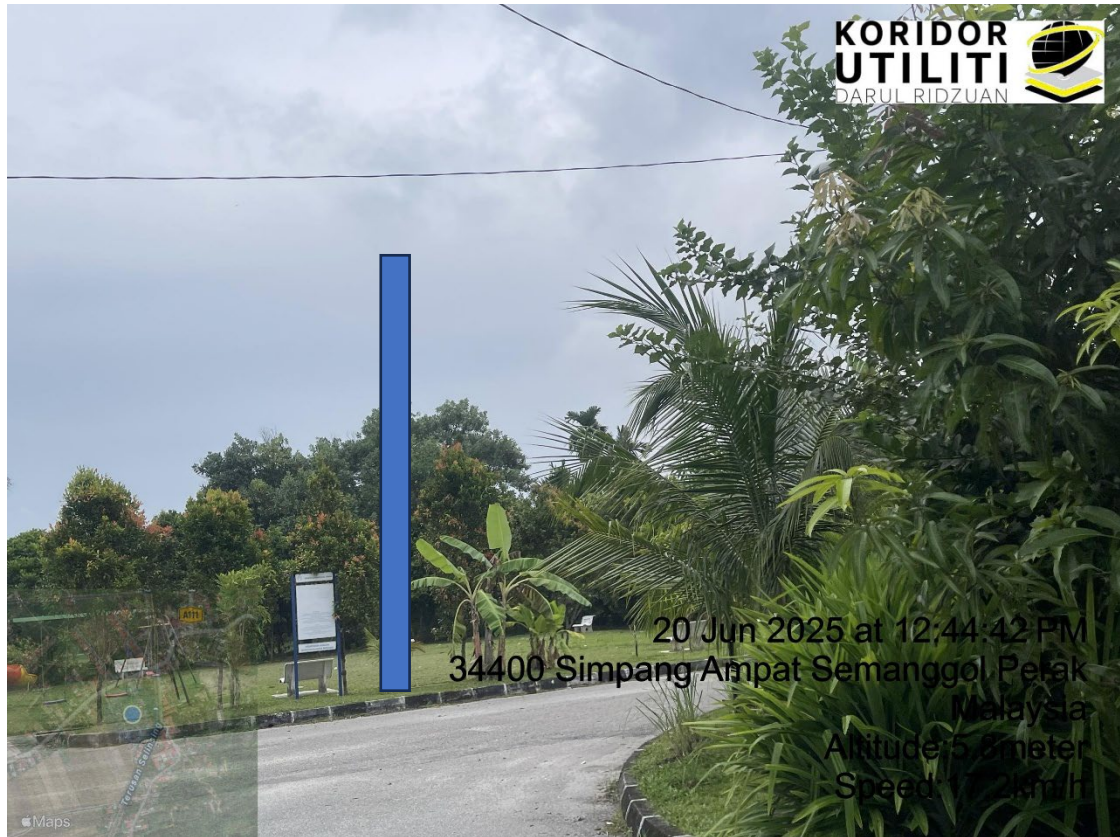
LOKASI DI JALAN TAMAN SEMANGGOL AMAN