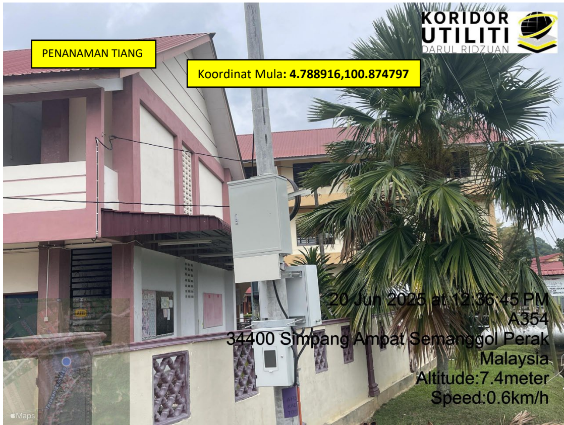
LOKASI DI JALAN KAMPUNG BUKIT SEMANGGOL