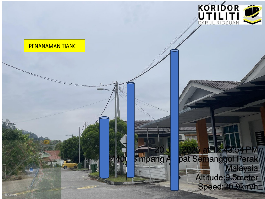
LOKASI DI JALAN TAMAN SEMANGGOL AMAN