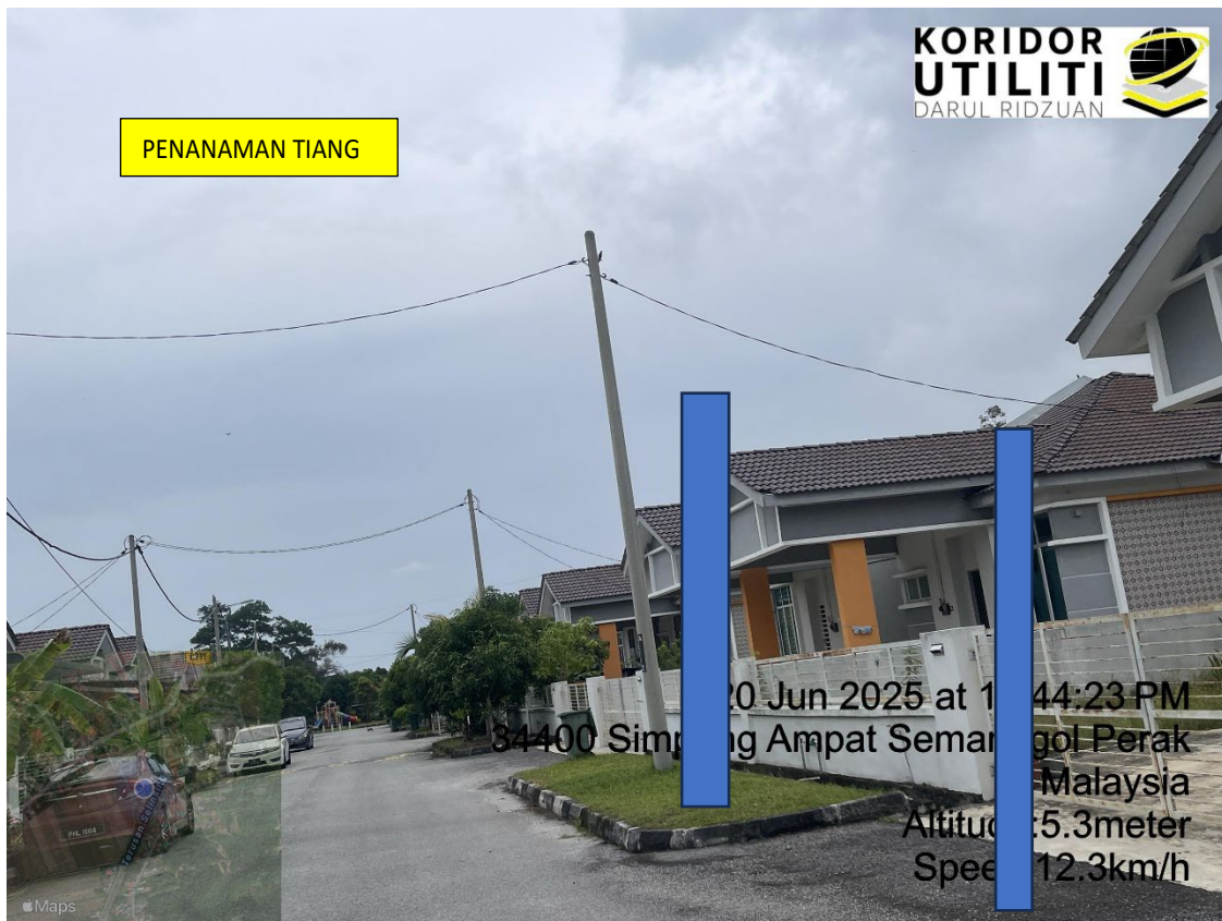
LOKASI DI JALAN TAMAN SEMANGGOL AMAN