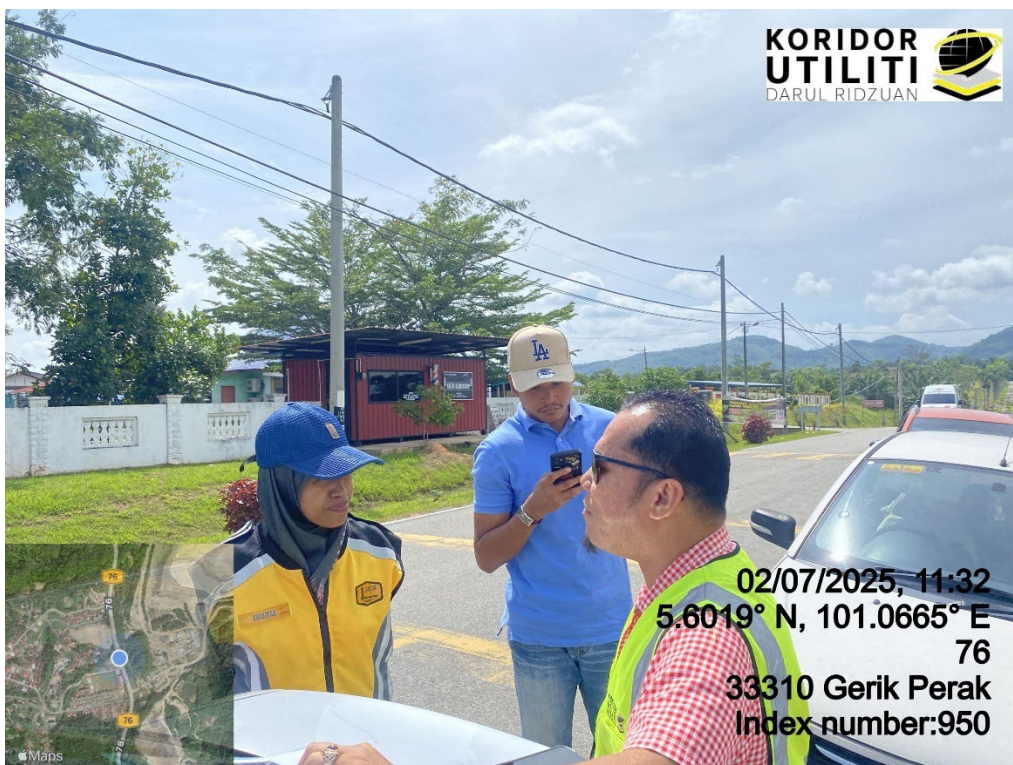
LOKASI DI JALAN SMK PENGKALAN HULU