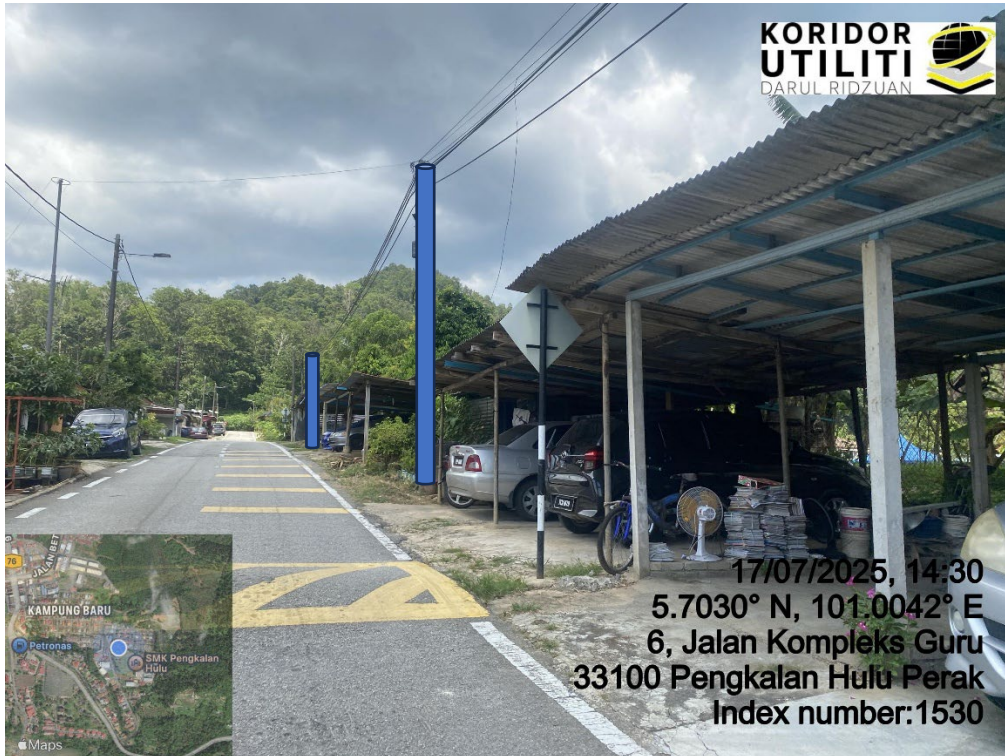
LOKASI DI JALAN KOMPLEKS GURU