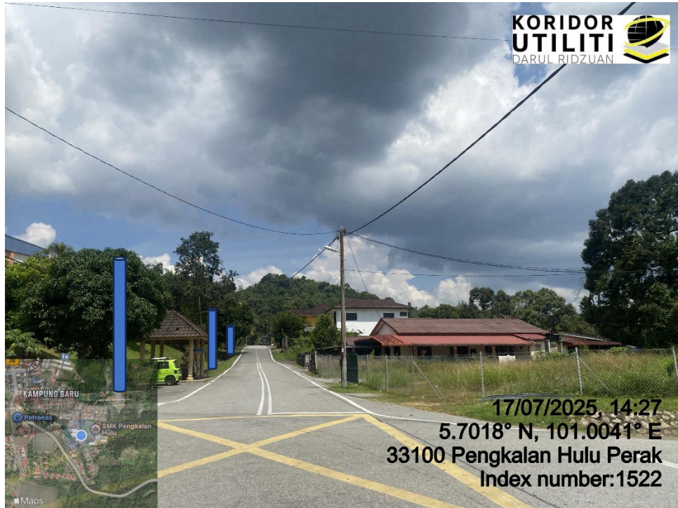
LOKASI DI JALAN KOMPLEKS GURU