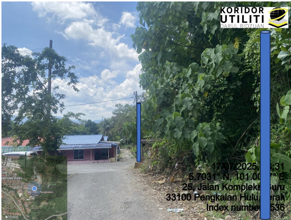
LOKASI DI JALAN KOMPLEKS GURU