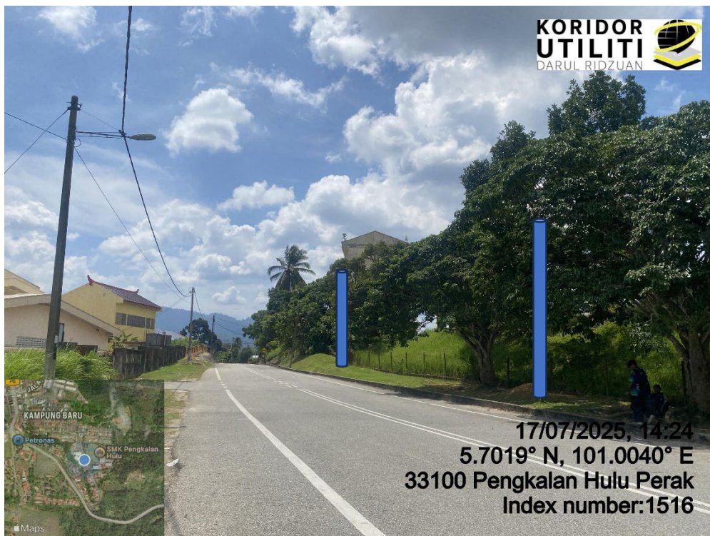
LOKASI DI JALAN KOMPLEKS GURU