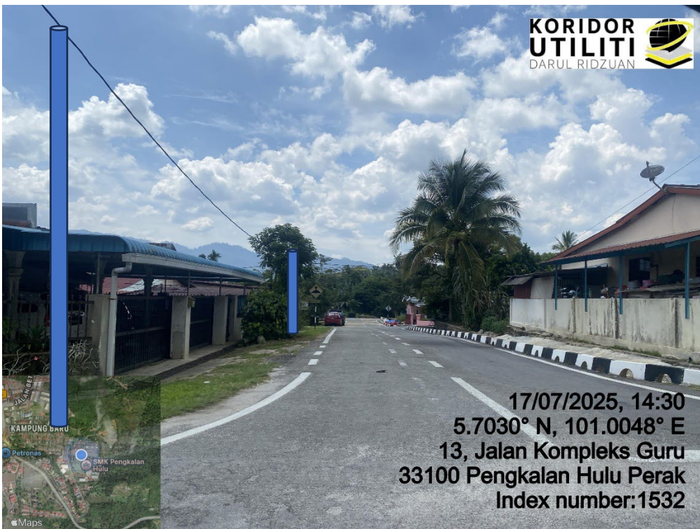
LOKASI DI JALAN KOMPLEKS GURU