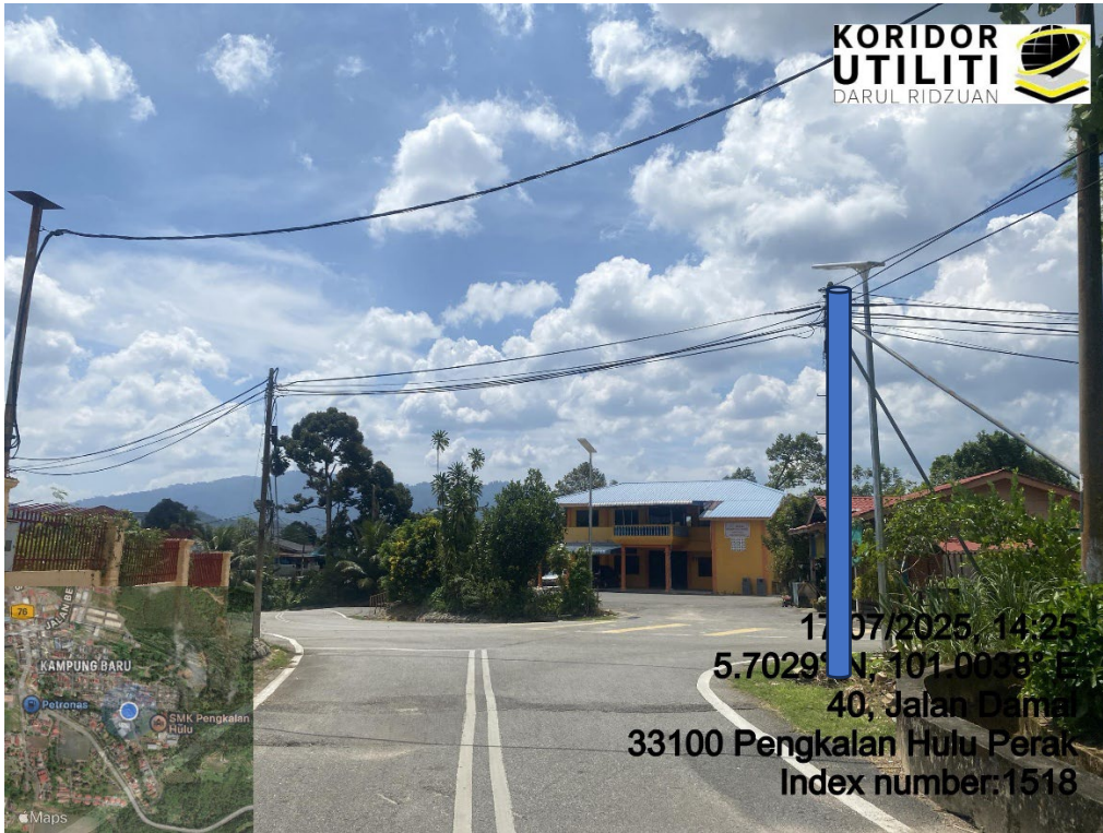
LOKASI DI JALAN KOMPLEKS GURU