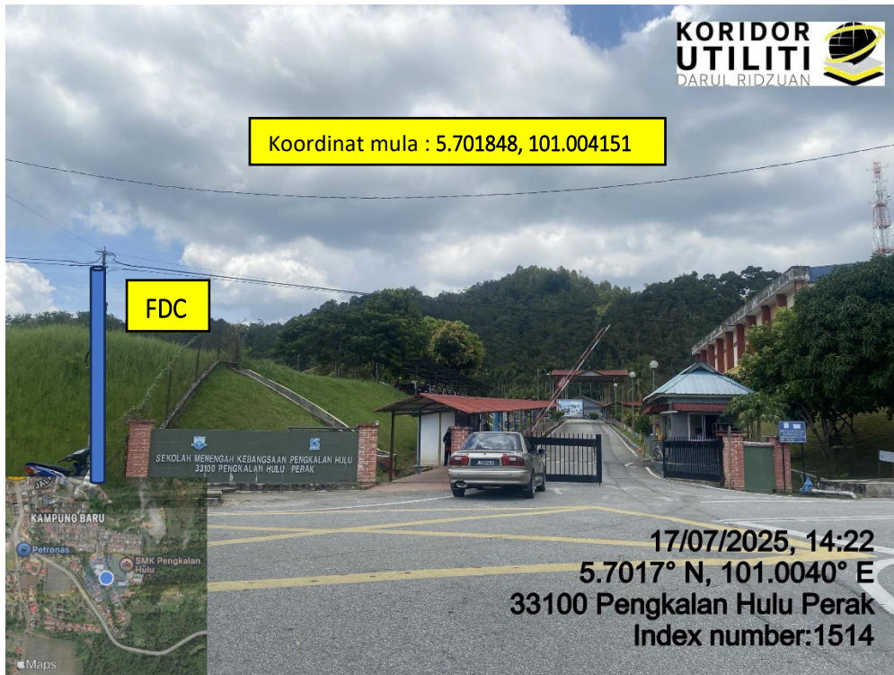
LOKASI DI JALAN SMK PENGKALAN HULU