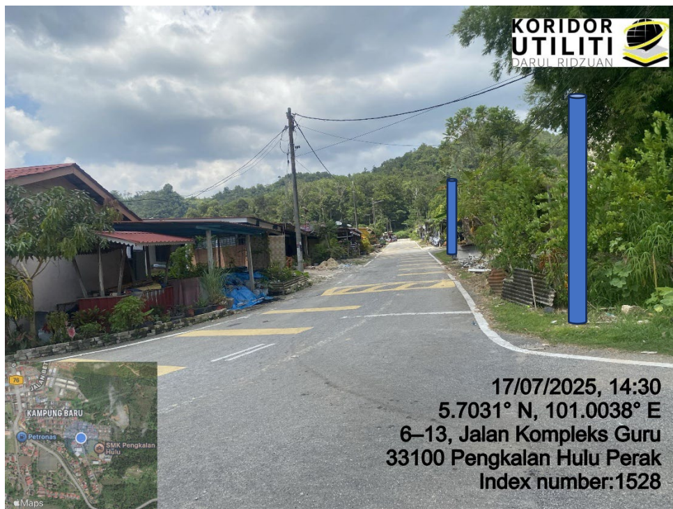
LOKASI DI JALAN KOMPLEKS GURU