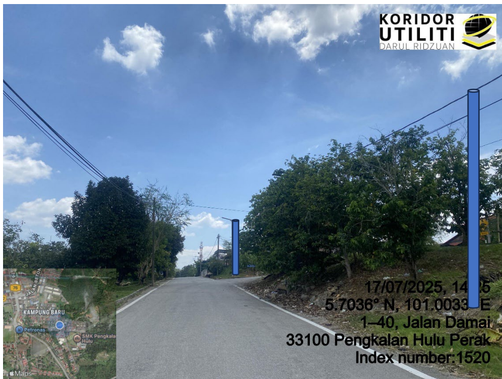
LOKASI DI JALAN DAMAI